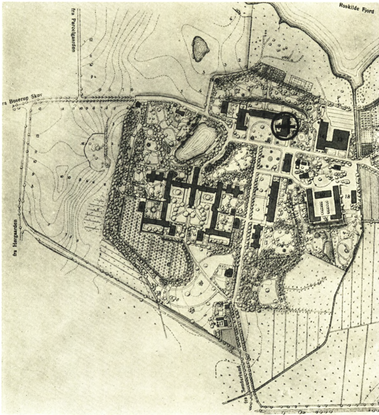
Fig. 1. †Bistrup. Ældre Situationsplan af S. Hans Hospital. Nord opad. Kirkens Beliggenhed er vist ved en sort Cirkel med indtegnet Kors. Det i Teksten omtalte Voldsted findes under de med Tallet 10 mærkede Bygninger.