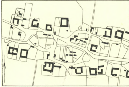
Fig. 8. Ishøj 1798.