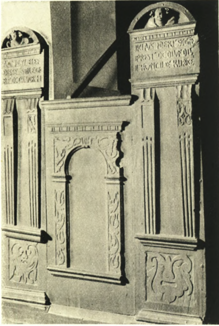
Fig. 5. Ishøj. Stolestade 1631 (S. 536).