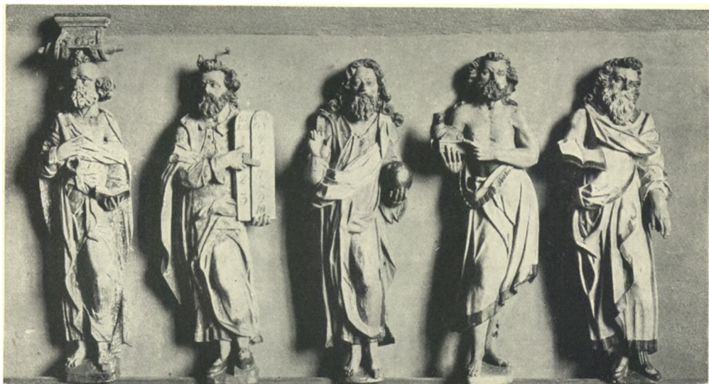
Fig. 4. Ishøj. Figurer fra Prædikestol (S. 536).