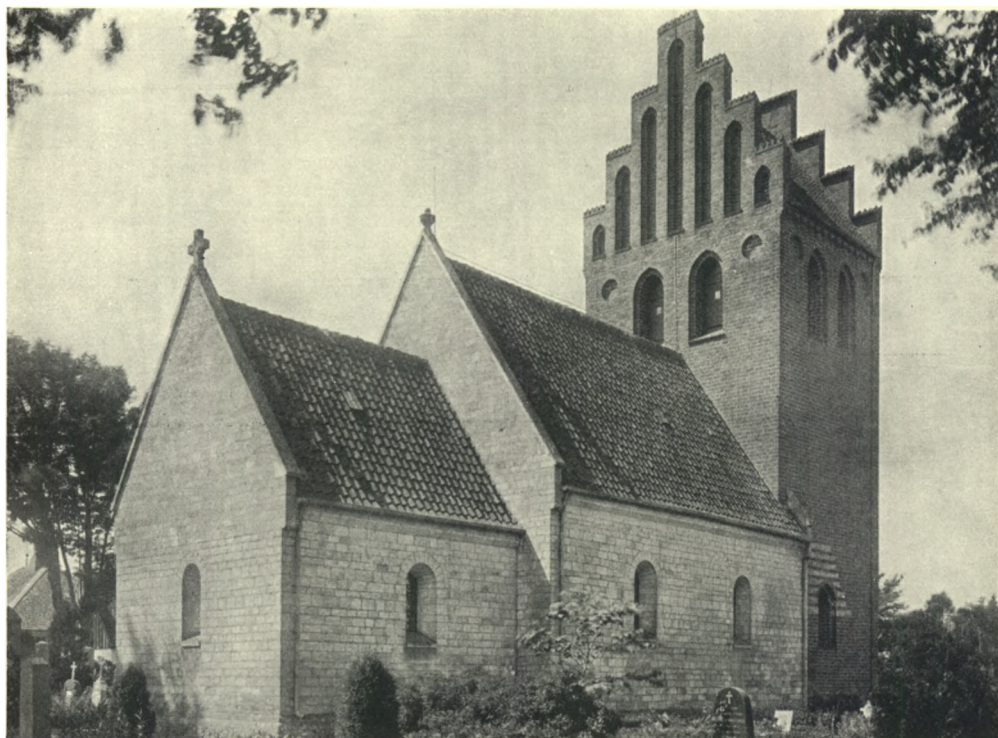
Fig. 1. Ishøj. Ydre, set fra Nordøst.