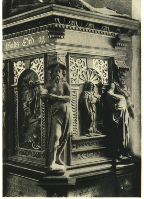
Fig. 6. Ishøj. Prædikestol, malet 1620 (S. 535).

1821«. Disk med graveret Cirkelkors og under Bunden Kursiv: »Cura Mag. I. Braem 1688« (»paa Foranledning af I. B.«), indrammet af to sammenbundne Grene. † Kalk og † Disk blev stjaalet 1684 (Rgsk.). Rund Oblatæske med Københavns Byvaaben 1864 og Mestermærke: F. Dahl. Ny Alterkande af Plet, i Empirestil. Fire † Vinflasker paa en Pot nævnes 1817 (Inventarium).