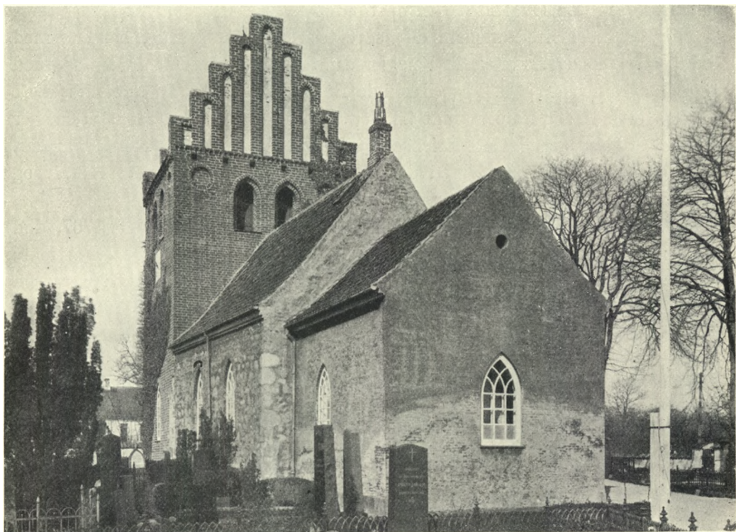
Fig. 1. Hersted-Øster. Ydre, set fra Sydøst.