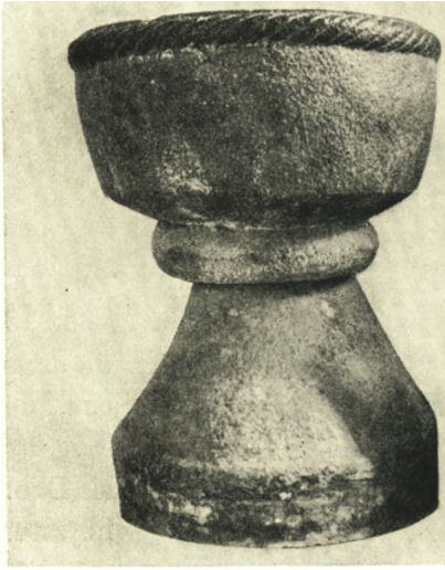
Fig. 4. Hersted-Øster. Døbefont (S. 482).