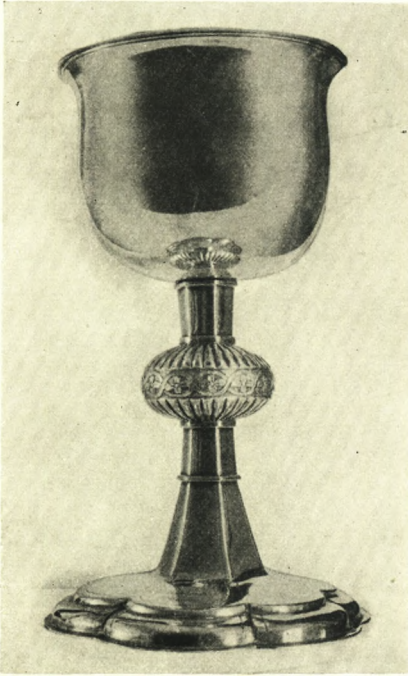
Fig. 4. Brøndby-Øster. Alterkalk (S. 462).