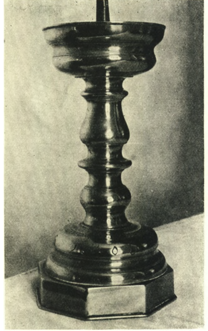
Fig. 5. Brøndby-Øster. Alterstage 1605 (S. 463).

utvivlsomt fra 1830, bærer Frederik 6.s kronede Navnetræk. Glat Disk med Københavns Mærke 1830 og graveret: »Brøndbyeoester Kirke«; Mestermærke for P. R. Eggersen. † Disk foræredes sammen med Kalken 1667 af Guldsmed Jacob Kitzerou (Rgsk.). Oblatæske med graveret: »Brøndbyøster Kirke«, og Christian 8.s kronede Navnetræk.