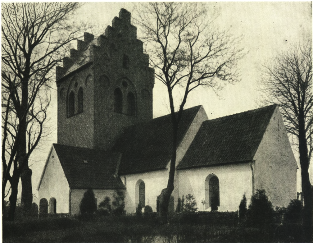
Fig. 1. Brøndby-Øster. Ydre, set fra Sydøst.