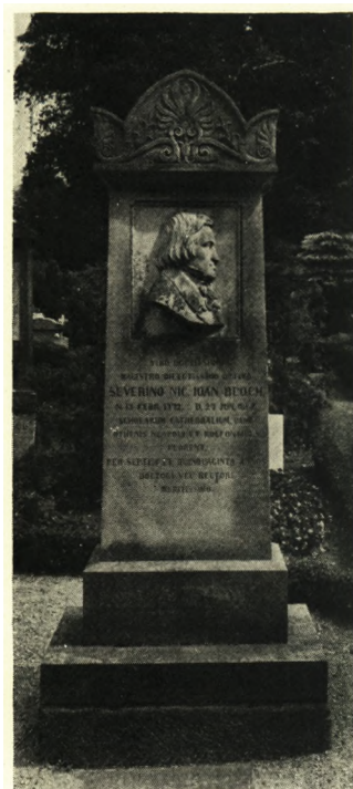
E. M. 1941