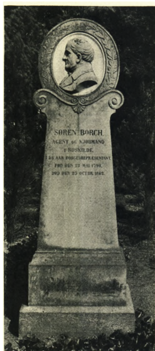
E. M. 1941