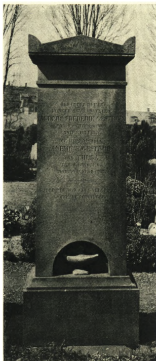
E. M. 1941