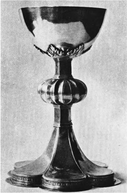
K. AV. 1946