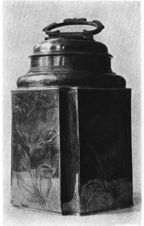
K. W. 1946