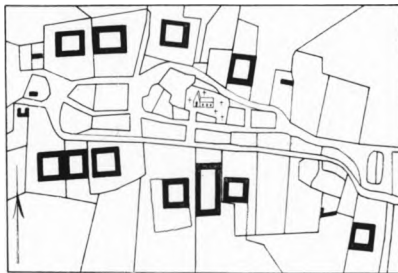
Fig. 9. Jersie 1800.

1 Kronens Skøder II, 598—602. 2 Mackeprang: Døbefonte S. 405. 3 Ved Einar V. Jensen. 4 Indskriften kan oversættes: »Maria er mit Navn, (det eller jeg) skal være velbehagelig for Gud«; imidlertid synes det manglende Grundled at tyde paa, at Indskriften ikke er fuldstændig, og dette bekræftes vistnok af Indskriften paa Klokkeren i Esbønderup (Frederiksborg Amt) af samme Støber; den lyder nemlig: ». . . es mine name, min luut sy God bekvame« (». . . er mit Navn, min Lyd skal være (sei) Gud velbehagelig«); sml. J. F. Fenger i Kirkehist. Saml. II, 85. 5 AarbKbh. 1914. S. 62.