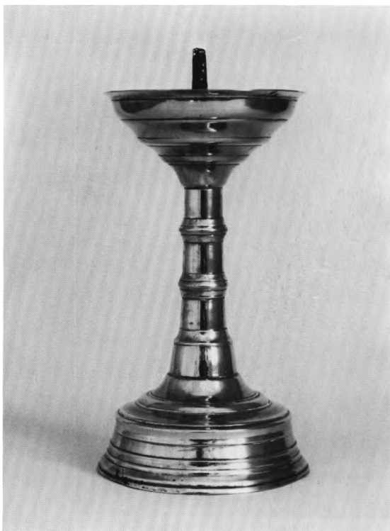
Fig. 17. Sengotisk alterstage, nu uden fødder (s. 1231). NE fot. 1979. - Late Gothic candlestick.

skafringe. Tragtformet lyseskål med lysepig af jern. - Syvarmet stage , fra o. 1900, såkaldt Ttusstage, nu på højt skafft. Ved fonten.