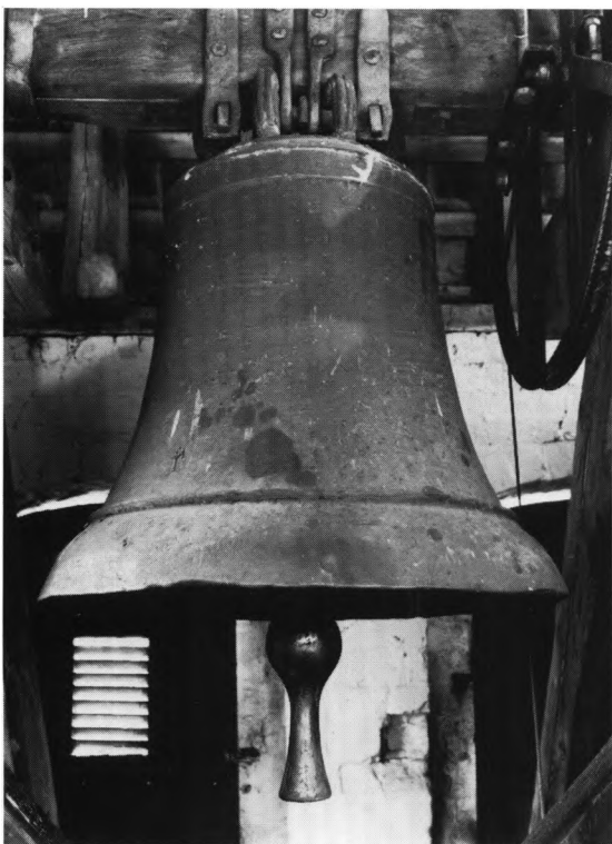
Fig. 20. Klokke fra 1300'rne (s. 1235). NE fot. 1981. - Fourteenth-century bell.

dens indretning, således i forbindelse med synet 1923, da vægpanelet ved præstens stol i sakristiet skulle fornyes eller bænken erstattes med en stol. 14 1927 ønskedes et bord til sakristiet, og 1937 trængte stolen til reparation. 9