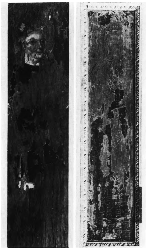
Fig. 10a-b. a. Rester af maleri forestillende S. Laurentius på *fløj (nu i NM2) fra en sengotisk altertavle (s. 1228). b. Den anden side af fløjen, der har været brugt som postamentfyldning i altertavlen fra 1595, fig. 11 (s. 1226f.). LL fot. 1985. - a. Fragments of a painting representing St. Lawrence on *wing (now in NM2) of a late Gothic altar-piece. b. The other side of the wing, once used as pedestal panel in the altar-piece from 1595, fig. 11.

te, bærer arkadernes glatte bueslag. I sviklerne reliefskårne rosetter. Fodlisten har fornyede fremspring under pilastrene, mens gesimsens frise er glat med tandsnit foroven under kronlisten. Sidepanelerne, 100 x 78 cm, har glatte, firkantede fyldinger.