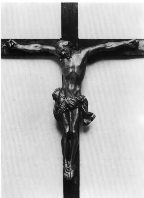
Fig. 21. Kistekrucifiks af bly, fra 1700'nes første halvdel (s. 1235). - Lead crucifix from the first half of the 1700s.

Kirkegårdsmonumenter . 1) O. 1840. E. Olivia Appeldorn, f. Hesselberg, *7. april 1806, †10. april 1840. Hvid marmortavle, 80 x 45 cm, med fordybde, sortmalede versaler, i ramme af rødlig granit og kronet af trekantgavl med reliefhugget sørgende engel. Indmuret i østre kirkegårdsмур ved sydøstre hjørne.