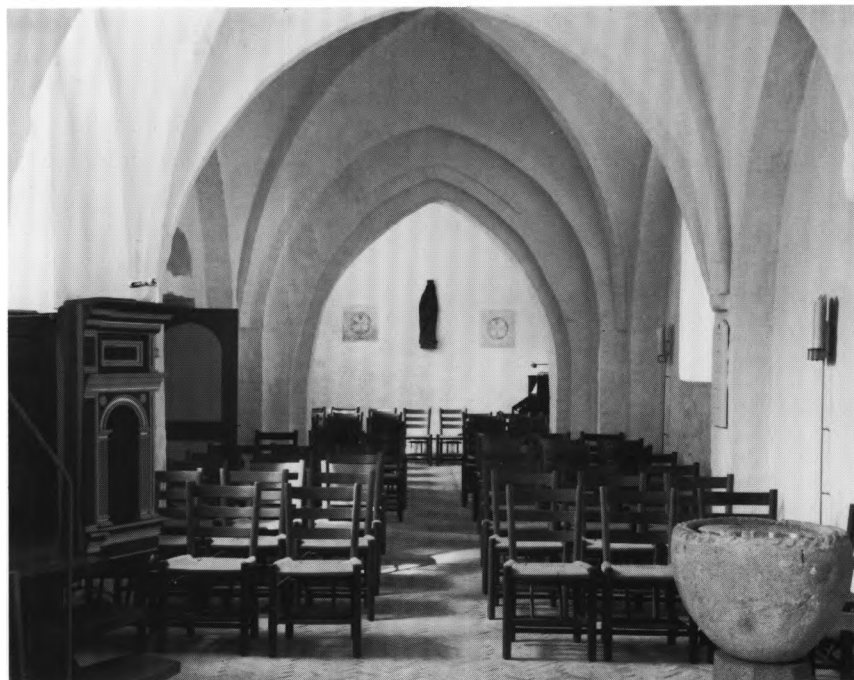
Fig. 7. Indre, set mod vest. - Interior to the west.

snævre spindels loft er af vandrette binderstik.