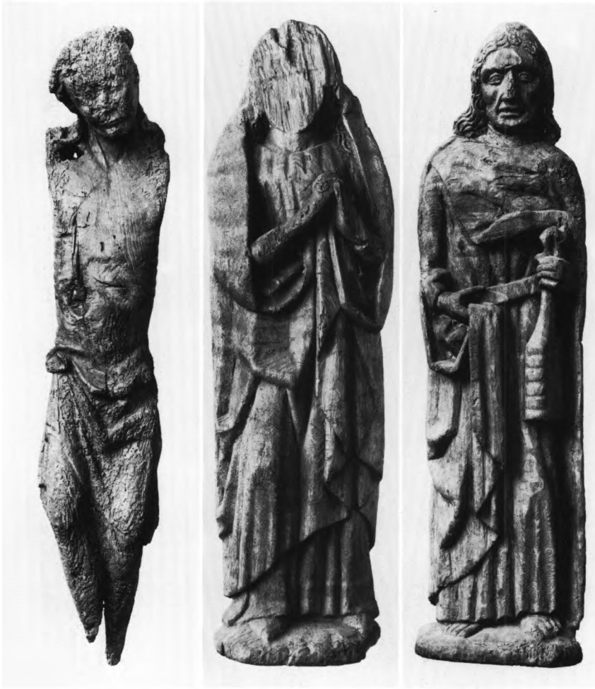
Fig. 12-13a-b. 12. *Kri- stusfigur fra o. 1250- 1300, nu uden arme og fødder (s. 1232). 13a-b. *Sidefigurer, fra 1400' rnes slutning, til korbu- ekrucifiks. Maria og Jo- hannes (s. 1230). I NM2. - 12. *Fi- gure of Christ from c. 1250-1300, now with- out arms and legs. 13a-b. *Flanking figures from the close of the 1400s, part of a chancel-arch crucifix. The Virgin and St. John. In NM2.