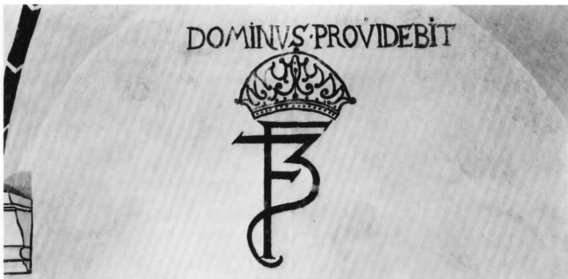
Fig. 9. Frederik III.s (1648-71) valgsprog og kronede monogram. Kalkmaleri på korets nordvæg (s. 1224). E. Lind fot. 1959. - Frederik III's (1648-71) motto and crowned monogram. Mural on the north wall of the chancel.

hvis rygge brydes af hvide, nedadvendte spar-rer, dels er benyttet til en afstribning af hvæl- konsollernes profil. Foroven på korets nord- væg er endelig malet kongens kronede mono- gram (fig. 9) under hans latinske valgsprog i versaler: »Dominus providebit« (Herren vil være mit forsyn).