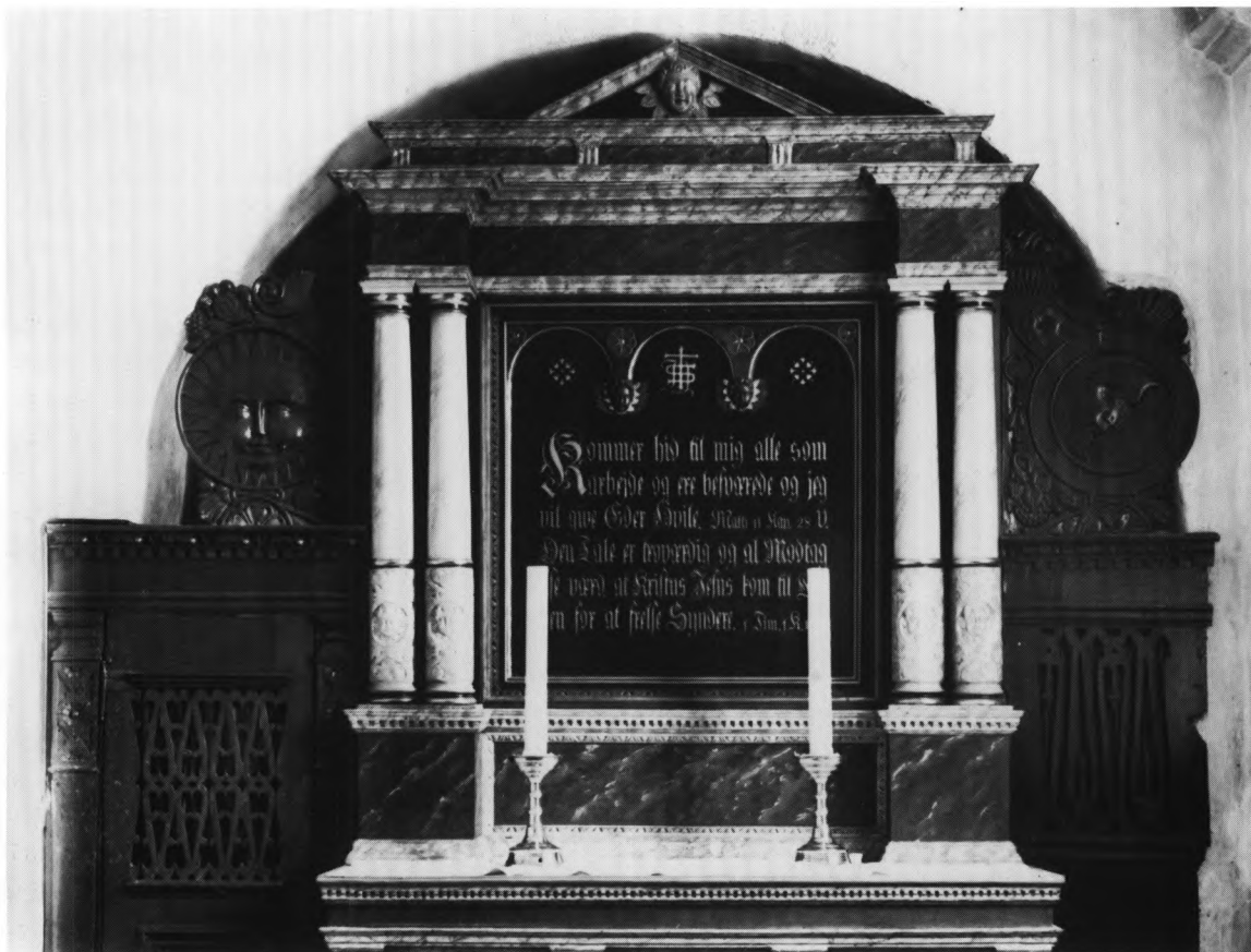
Fig. 11. Altertavle fra 1595 med nyere malet indskrift i storstykket. Bemærk det udsavede gitterværk, som flankerer tavlen og skjuler det nederste af dens vinger. Stykket til venstre bruges nu som dør for skab i våbenhuset; det har oprindelig været opstillet i forlængelse af alterbordets forside, mens det lavere gitterværk (til højre i billedet) var anbragt vinkelret på, mellem døren og altertavlen, jfr. udsavning i pilasteren til højre ved væggen, af hensyn til profillisten mellem altertavlens postament og storstykke. Med denne opbygning skabtes det lille sakristi, som omtales 1667 (s. 1226). - Altar-piece from 1595 with a more recent inscription painted on the central panel. Notice the lattice flanking the altar-piece and concealing the lower part of its wings. The lattice to the left is now used as a cupboard door in the porch; it has originally been put up in continuation of the altar frontal. The lower latticework (to the right) has stood at right angles, between the door and the altar-piece, cf. the sawn out piece in the engaged pilaster to the right, made for the moulding between the pedestal and central panel of the altar-piece. This arrangement made a little sacristy mentioned in 1667.

le. Den glatte gesims er forkroppet over søjlerne og bærer et lavt gesimsled delt af fire triglyfplader. Dette led har oprindelig siddet over en \dagger baldakin og må tænkes at have båret et \dagger topstykke, kronet af den bevarede lave trekantgavl hvori englehoved, svarende til Havrebjergs (s. 1100).