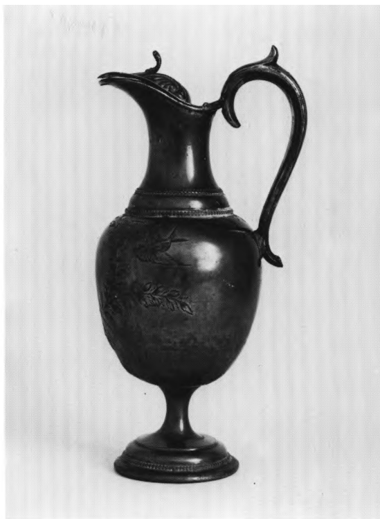
Fig. 16. Alterkande, muligvis anskaffet 1844 (s. 1231). - Wine jug, possibly acquired in 1844.