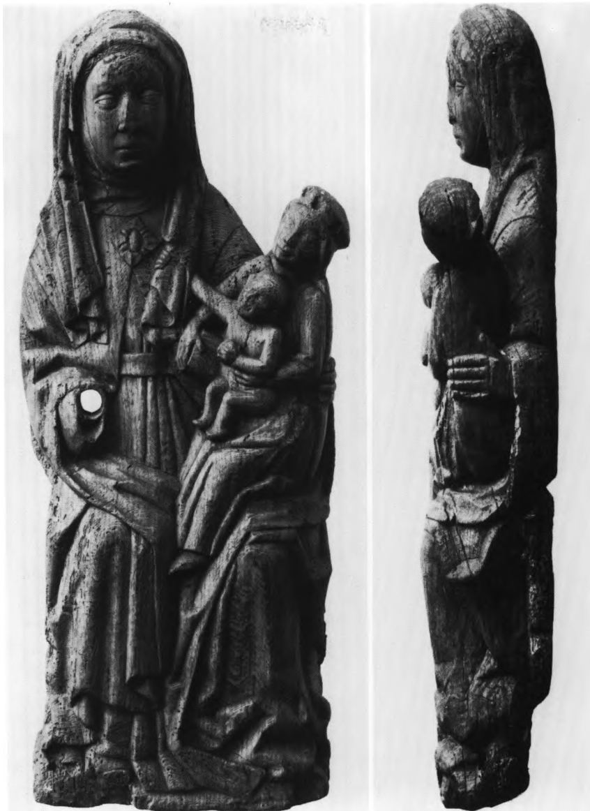
Fig. 14. Anna selvtræde, fra slutningen af 1400'erne, oprindeligt anbragt i skabsaltertavle (s. 1229). LL fot. 1960. - St. Anne, the Virgin and Infant Jesus, from the close of the 1400s, originally in an altar-piece.

matika eller klædning for en diakon«. 1957 erhvervet af Nationalmuseet (inv. nr. DI155/1984).