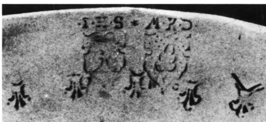
Fig. 18. Detalje af dåbsfad med våbener og initialer antagelig for Jakob Hansen og Metilla Knudsdatter (s. 1232). - Brass baptismal dish. Detail showing coats of arms and initials.

* Korbuekrucifiks , o. 1275-1300. Den især af orm stærkt medtagne Kristusfigur (fig. 12), hvis nuværende højde er 75 cm, mangler begge arme og det nederste af benene. Øverste del af ansigtet er ligeledes beskadiget, så at øjnernes udformning ikke kan iagttages. Hovedet hælder mod højre, håret er strøget om bag ørerne, og en lok ligger næsten vandret på hver af skuldrene; det synes at have en tilsvarende længde bagtil. Munden ser ud til at være lukket, mens udformningen af et smalt hage- og kindskæg vanskeligt lader sig konstatere. Resten af flettet tornekrone. I issen nedboret hul lukket af træprop. Kroppen er flad bagpå og virker næsten firkantet, med vandrette ribben markeret på siderne; vunde i højre side. Lænde-kledet, der dækker venstre knæ, har to kraftige v-formede folder foran og knude i højre side. Klædet hænger ned bag figuren i højde med