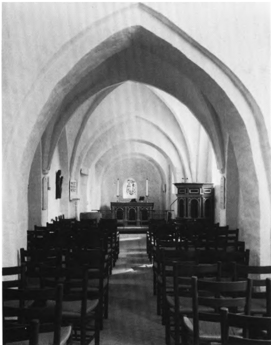
Fig. 8a-b. Indre, set mod øst. a. Efter den radikale restaurering 1957. b. Inden restaureringen. - Interior to the east. a. After the restoration 1957. b. Prior to the restoration.