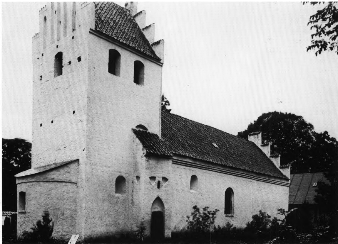
Fig. 6. Ydre, set fra nordøst. Poul Nørlund fot. 1922. - Exterior seen from the north-east.

Det sekundære trappehus er af munkesten og med halvtæg. Den fladbuede underdør har spidsbuet spejl. Herover findes en smal lysprække, flankeret af skjoldblændinger; en tilsvarende tredje blænding ses på østsiden. Den