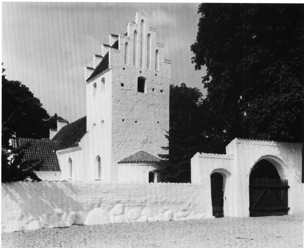
Fig. 2. Ydre, set fra sydøst. 1979. - Exterior seen from the south-east.

i kirke i Gørlev. De lovede derfor at bygge deres egen kirke, og man viste tidligere murrester på det sted, hvor de skulle have boet. 9 - Tårnets anbringelse over koret i øst har medført, at sognets navn allerede 1755 tolkedes som en afspejling af dette normbrud: Bakkendrup skulle således komme af »Bagvendrup«. 10