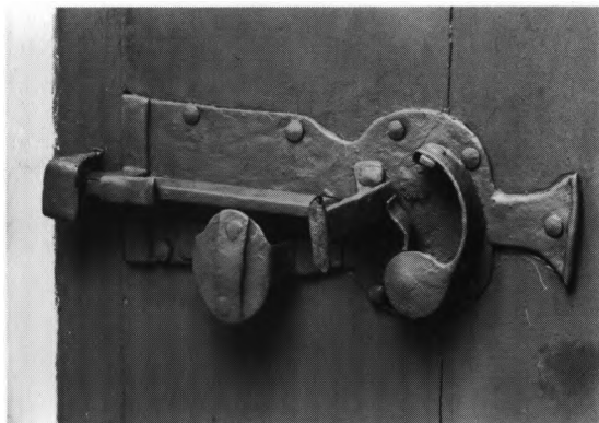
Fig. 22. Lås på dørløj mellem våbenhus og skib (s. 1234). NE fot. 1979. - Lock on the door between the porch and the nave.

2) 1611, støbt af Borchardt Gelgiesser, tv. 92 cm. Om halsen indskrift med reliefversaler mellem lilje- og palmetfrise: »Verbvm domini manet in æternvm. Gos mich Borchart Gelgieser. Anno domini 1611«. 41 Profillister over