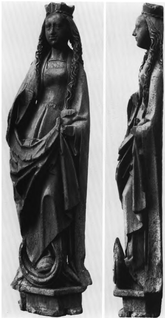
Fig. 15. Maria stående på måneseglen, fra 1500'ernes begyndelse, oprindelig anbragt i skabsaltertavle (s. 1230). - The Virgin standing on the new moon, from the beginning of the 1500s, originally in an altar-piece.

steder i klædedragten, og af den bænk, hun har siddet på, er blot en ubetydelig rest bevaret. Figuren er hulet i ryggen.