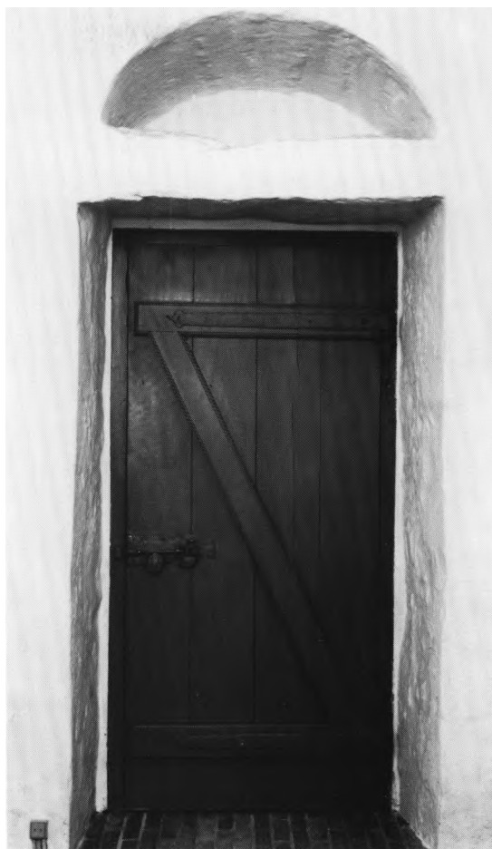
Fig. 5. Skibets syddør (s. 1220). - South door of the nave.

Forhøjelsen af flankemurene, der nu har udvendig falsgesims, er af mindre sten, lagt i