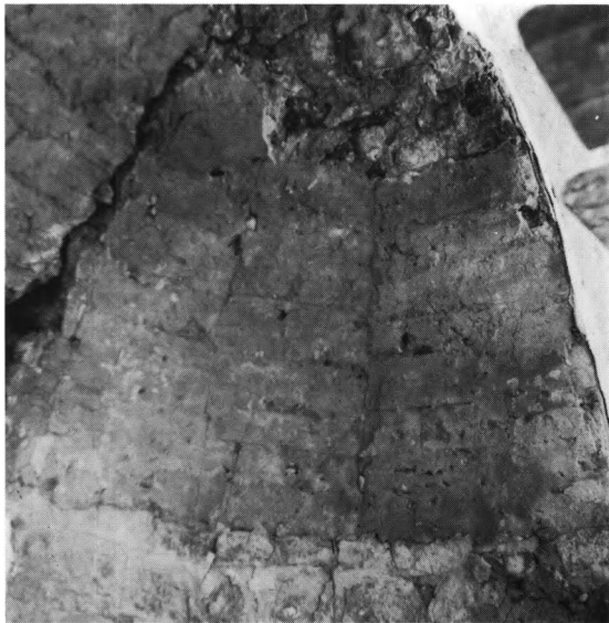
Fig. 4a-b. Apsidens murværk, afklædt under restaurering. a. Hvælv med aftryk af forskallingsbrædder (s. 1220). b. Nordre del med kvaderridsning og pudslag, hvorpå kalkmalerifragment fra 1600'rne (s. 1219, 1225). Tage E. Christiansen fot. 1957. - Apse wall after the removal of plaster when under restoration.

Vinduer og døre. Apsisvinduet er bevaret, men helt omdannet. Udvendig fremtræder den smigede åbning med fladbuget murstensstik, mens den indvendig er uregelmæssigt rundbuget. Derimod er samtlige nordvinduer foruden det vestligste i syd helt eller delvis intakte. Skibets to vestligste lysåbninger er dog tilmuret, og nordsidens ydermere delvis slugt af det nuværende vindue. Den tekniske behandling fremgår imidlertid af sydsidens, hvis vestre smig er synlig fra våbenhusloftet. Denne er sat af tilhuggede marksten, der i lighed med selve vangen har stået dækket af grovkornet puds. Korets og skibets østligste nordvindue er der-