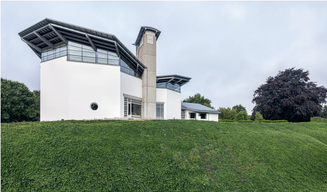
Fig. 1. Kirken set fra sydøst. Foto Arnold Mikkelsen 2022. – The church seen from the south-east.