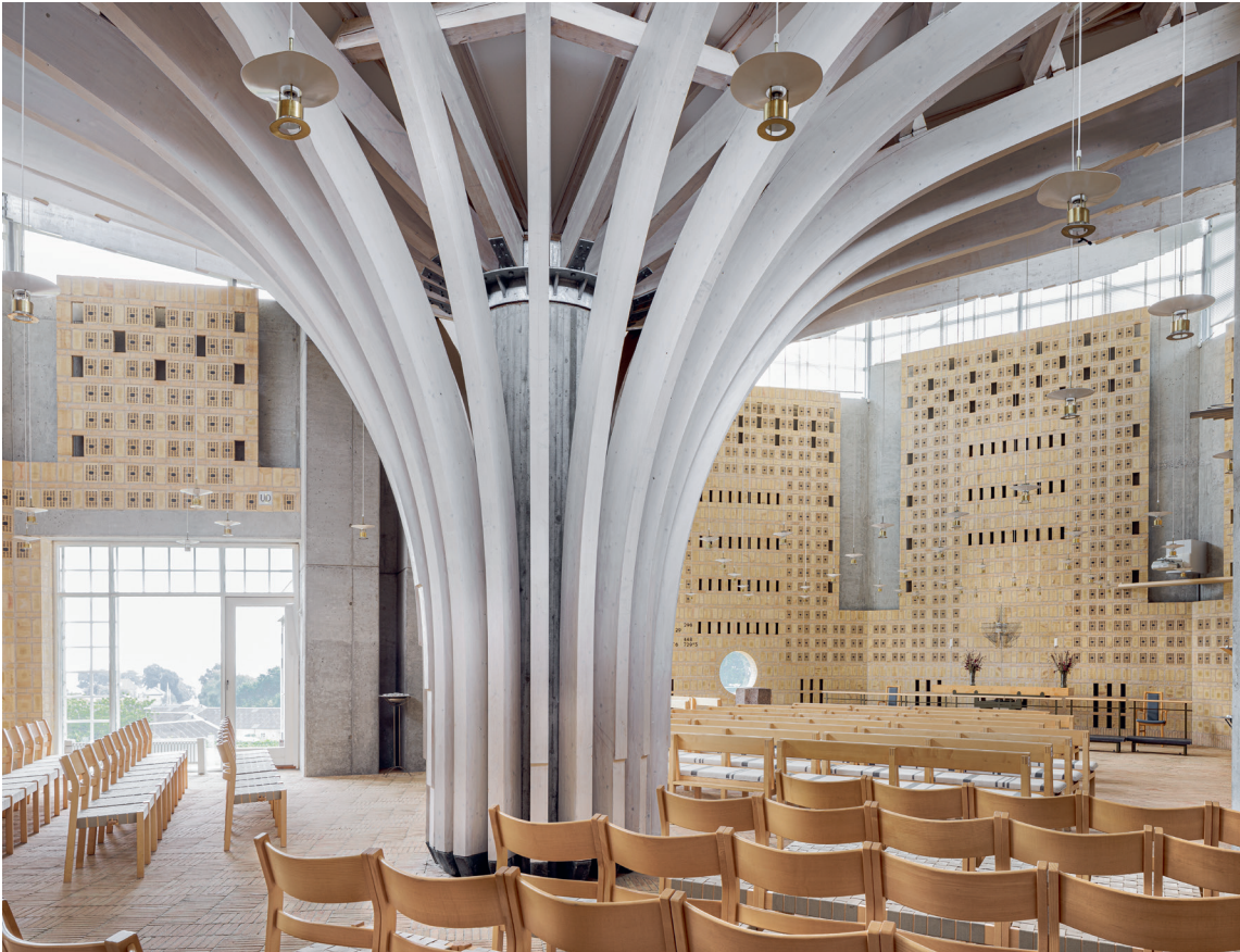
Fig. 5. Kirkens indre set mod øst. – The interior of the church looking east.