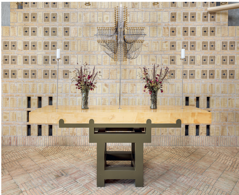
Fig. 4. Alterbordet med Bent Exners alterbordskors (s. 3665). – The Communion table with Bent Exner's Communion table crucifix.

Kirken gennemgik 2008, efter konstateringen af blandt andet fugtskader, en omfattende renovering, hvor store partier af murværket blev udskiftet, tagbeklædningen fornyet med zink og bygningens udvendige træværk indkapslet af samme materiale. Herved ændredes fremtoningen af især tagudhængets underside fra den oprindelige hvide farve til den nuværende mørkere nuance (arkitektfirmaet Lauridsen & Lundehøj, Fredericia). Kirkens tage var oprindeligt belagt med blybelagte, rustfrie stålplader.