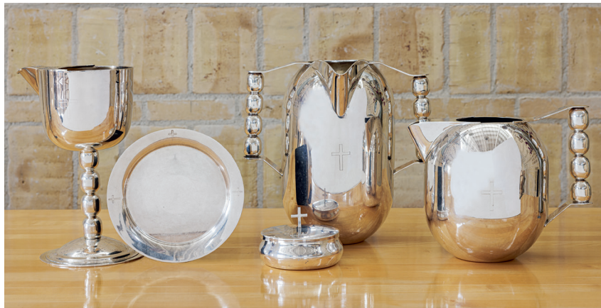
Fig. 6. Altersølv og dåbskande, 1994 (s. 3665-66). – Altar silver and baptismal jug, 1994.

Alterkande (jf. fig. 6), 1994, af forsolvet messing, udført af Fredericia Sølv. Den er 20,5 cm høj og udformet som en superellipse; uden fod. Hanken er formet som fire små superellipser på række. Ustemplet.