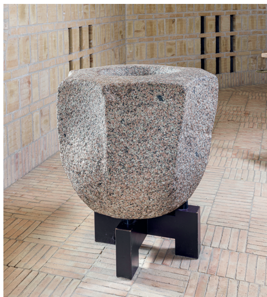
Fig. 7. Romansk vievandskar, nu anvendt som døbefont (s. 3666). – Romanesque holy water font, now used as baptismal font.

Litteratur. Inger, Johannes og Karen Exner og Finn Larsen, »Lyng Kirkecenter«, Haderslev Stiftsbog 1995, 44-47.