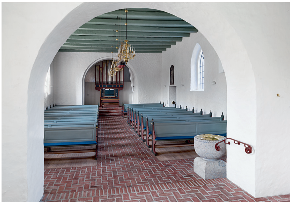
Fig. 9. Indre set imod vest. Foto Arnold Mikkelsen 2016. – Interior looking west.

9 Harmoniet annonceredes januar 2017 til salg på internettet. Yderligere oplysninger om kirkens musikinstrumenter findes i Den Danske Orgelregistrant.