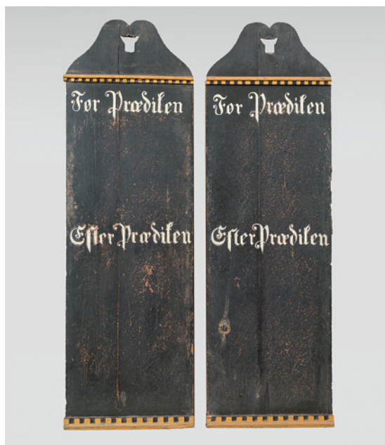
Fig. 7. Salmenummertavler, 1877, nu i kirkens museum (s. 2677). – Hymn boards, 1877, now in the church museum.

krucifiksets. Korset er glat og står i blankt træ. Nu over prædikestolen, før 1971 overfor i nord.