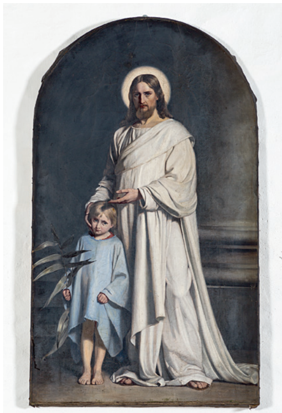
Fig. 6. Kristus med Barnet, tidligere altermaleri udført af Chr. Andersen efter Carl Bloch (s. 2676). – Christ with Child, earlier altar painting by Chr. Andersen after Carl Bloch.

Det tilføjede tårn i vest har i hver af de fire sider to rundbuede, faldede glamhuller og et let svejftet pyramidetag, der ligesom den øvrige kirke er tækket med skifer. Indvendig forbindes tårnrum og kirke med en rund, falset bue. En kælder under tårnet var indtil 1971 indrettet til ligkapel, hvorefter den blev omdannet til fyrkælder.