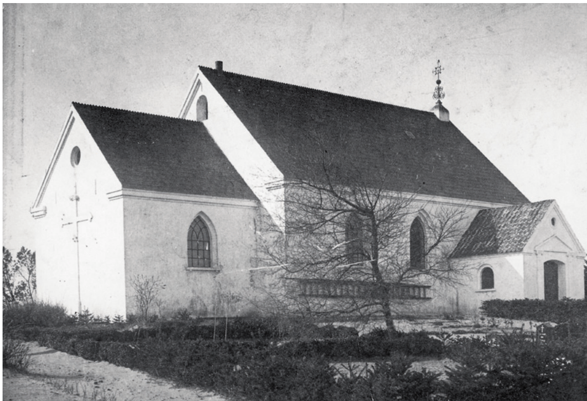
Fig. 2. Kirken set fra nordøst 1920. Foto ved kirken. – The church seen from the north east, 1920.