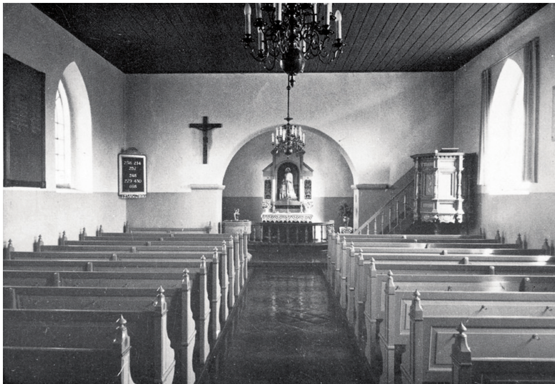
Fig. 3. Indre set imod øst 1970. Foto ved kirken. – Interior looking east, 1970.