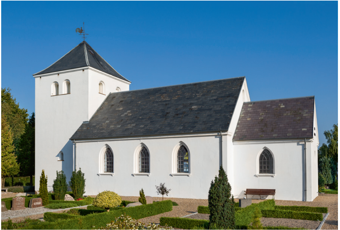
Fig. 1. Kirken set fra sydøst. Foto Arnold Mikkelsen 2016. – The church seen from the south east.