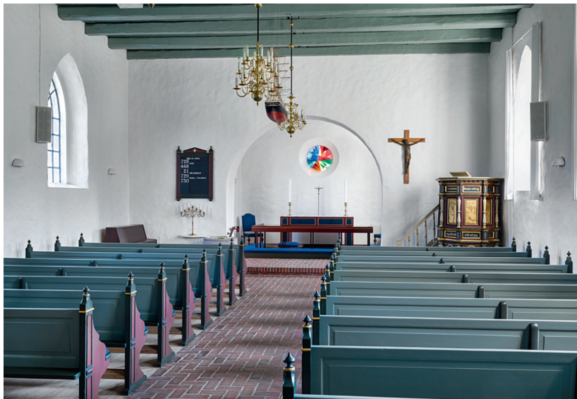
Fig. 4. Indre set imod øst. – Interior looking east.

ndf.). Her var facaden tidligere smykket med et stort muret kors ligesom det i Blåhøj. I det indre fremtræder det hvidtede, nypudsede rum nu i den skikkelse, det fik ved den seneste istandsættelse og restaurering 1997. I gulvet ligger store røde mursten på fladen og rummene dækkes af gråblå bræddeløfter hvilende på frilagte bjælker.