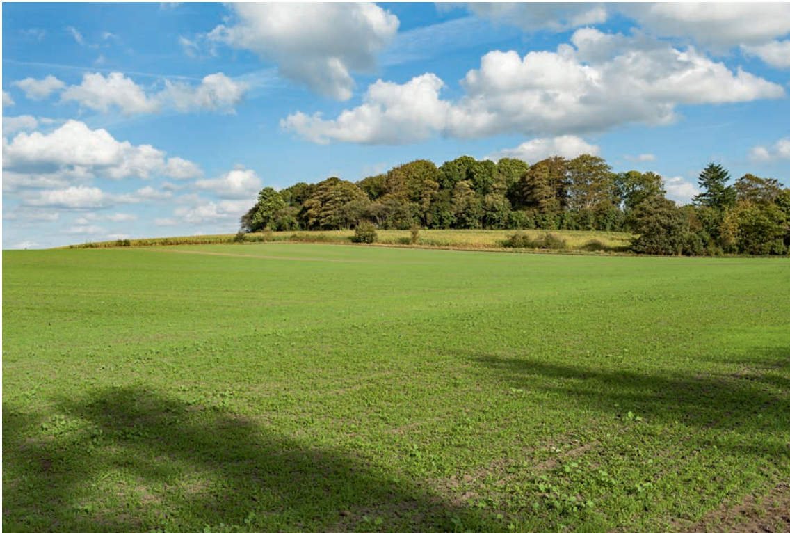
Fig. 1. Kirken lå på en bakketop, der gemmer sig i skovtykningen. Set fra sydvest. Foto Arnold Mikkelsen 2016. – The church was on a hilltop hidden in the forest. Seen from the south west.