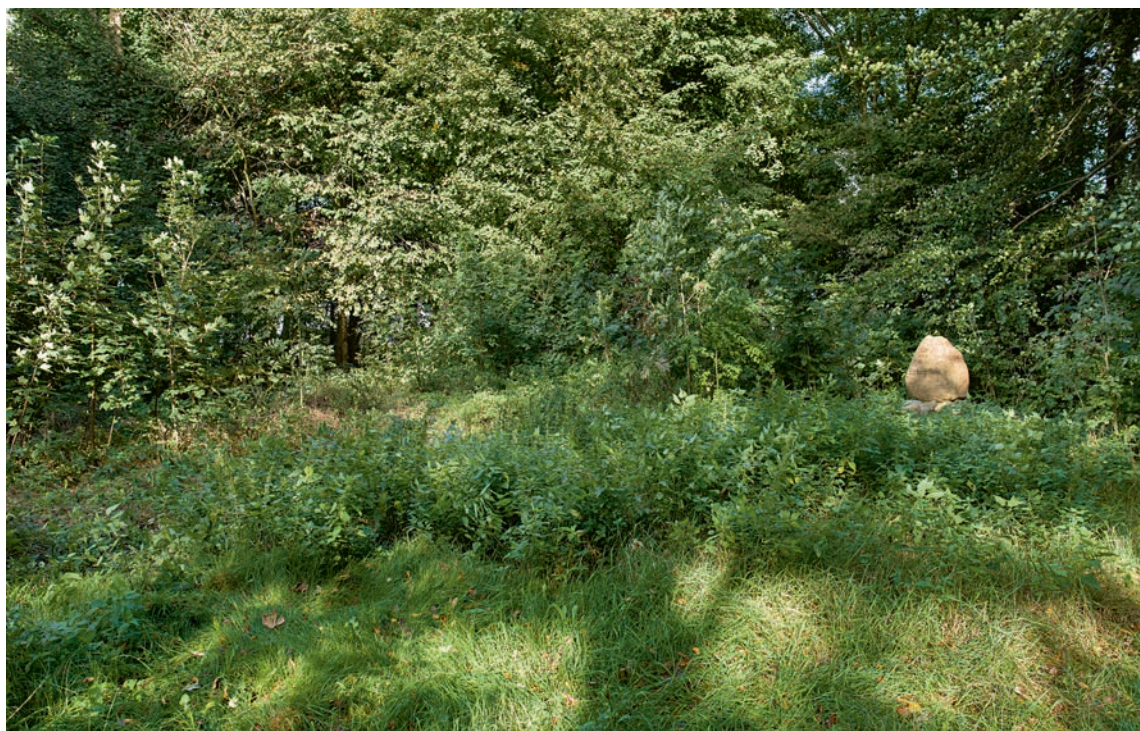
Fig. 2. Anlægget omkring kirketomten er groet til. Set fra sydvest. – The grounds around the church site are overgrown. Seen from the south west.