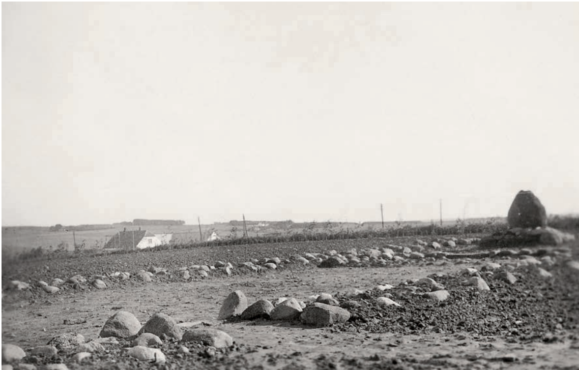
Fig. 4. Midt i koret en mindesten med indskriften »1321 Her laa Sæthorp Kirke«, mens tomten er markeret med kampesten. Set fra sydvest. – In the middle of the chancel, a memorial stone with the inscription '1321 Here lay Sæthorp Church' while the site is marked by fieldstones. Seen from the south west.