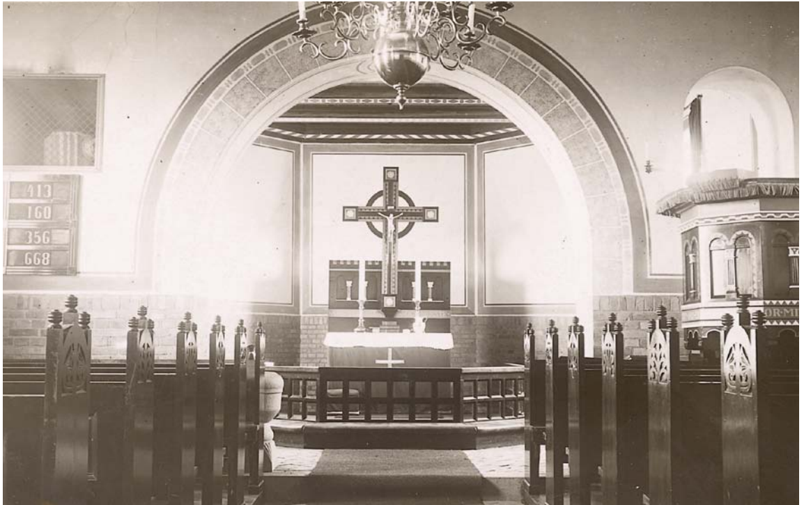
Fig. 5. Indre set mod øst o. 1920. – Interior seen towards the east, c. 1920.

afsluttes i et slankt spir, hvis højde svarer til bygningens. Spiret er tækket med et spåntag af zink, og vindfløjen herover udgøres af en vejrhane.