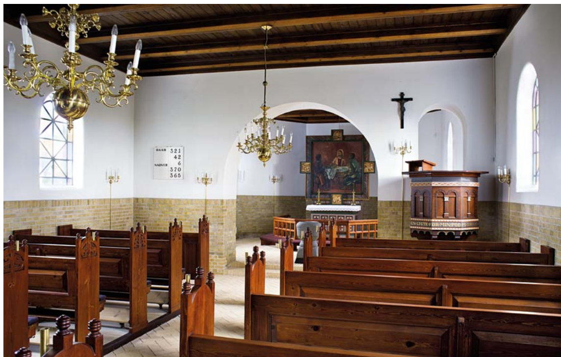
Fig. 6. Indre set mod øst. – Interior seen towards the east.

Den oprindelige alterprydelse var et krucifiks (fig. 5) af ringkorstype med kvadratiske endefelter, 185 cm højt. Det stod på en \dagger predella med dobbeltarkader i stil med prædikestolen. Nu hænger det (uden figur) på skibets nordvæg imellem de to vestligste vinduer.