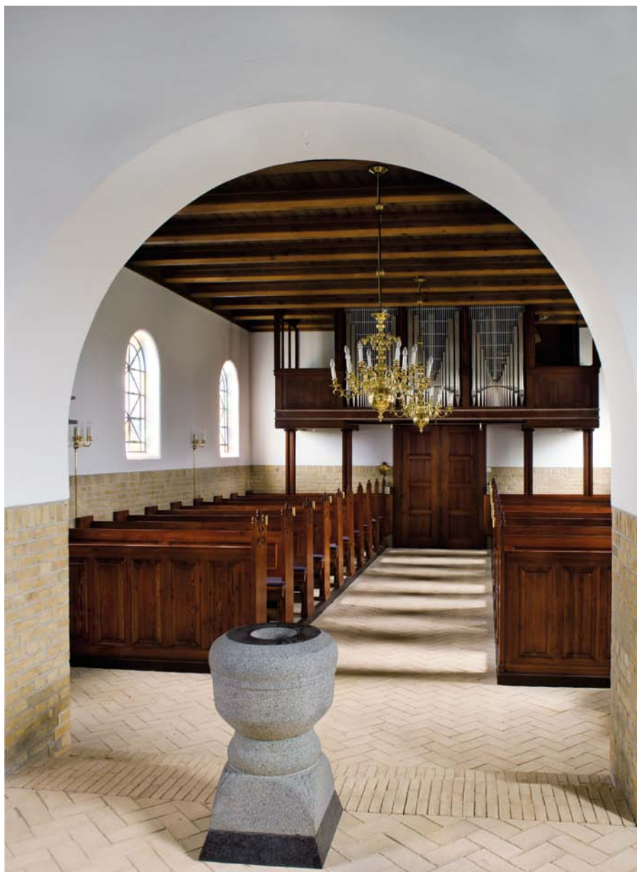
Fig. 4. Indre set mod vest. – Interior seen towards the west.

ker og kan sammenholdes med kirkerne i f.eks. Herborg (1898), Hodsager (1903) og Troldhede (1905), alle i Ringkøbing Amt.