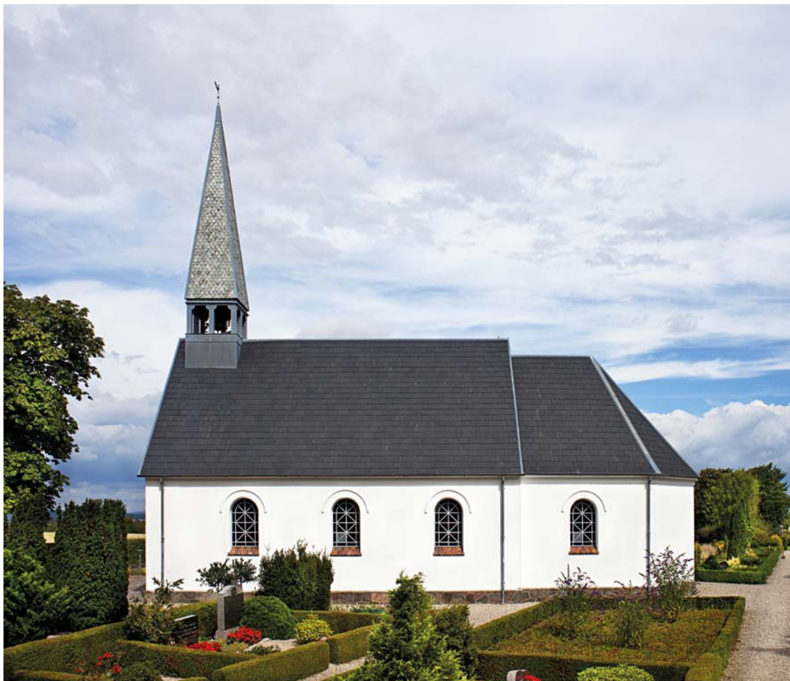
Fig. 1. Klejs Kirke set fra syd. – The church seen from the south.