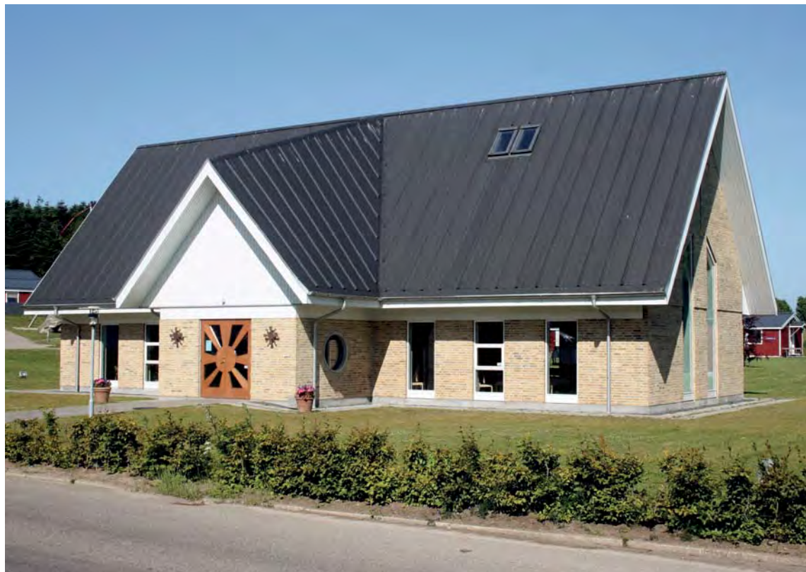
Fig. 1. Kirkebygningen set fra sydvest. – Church building seen from the south west.