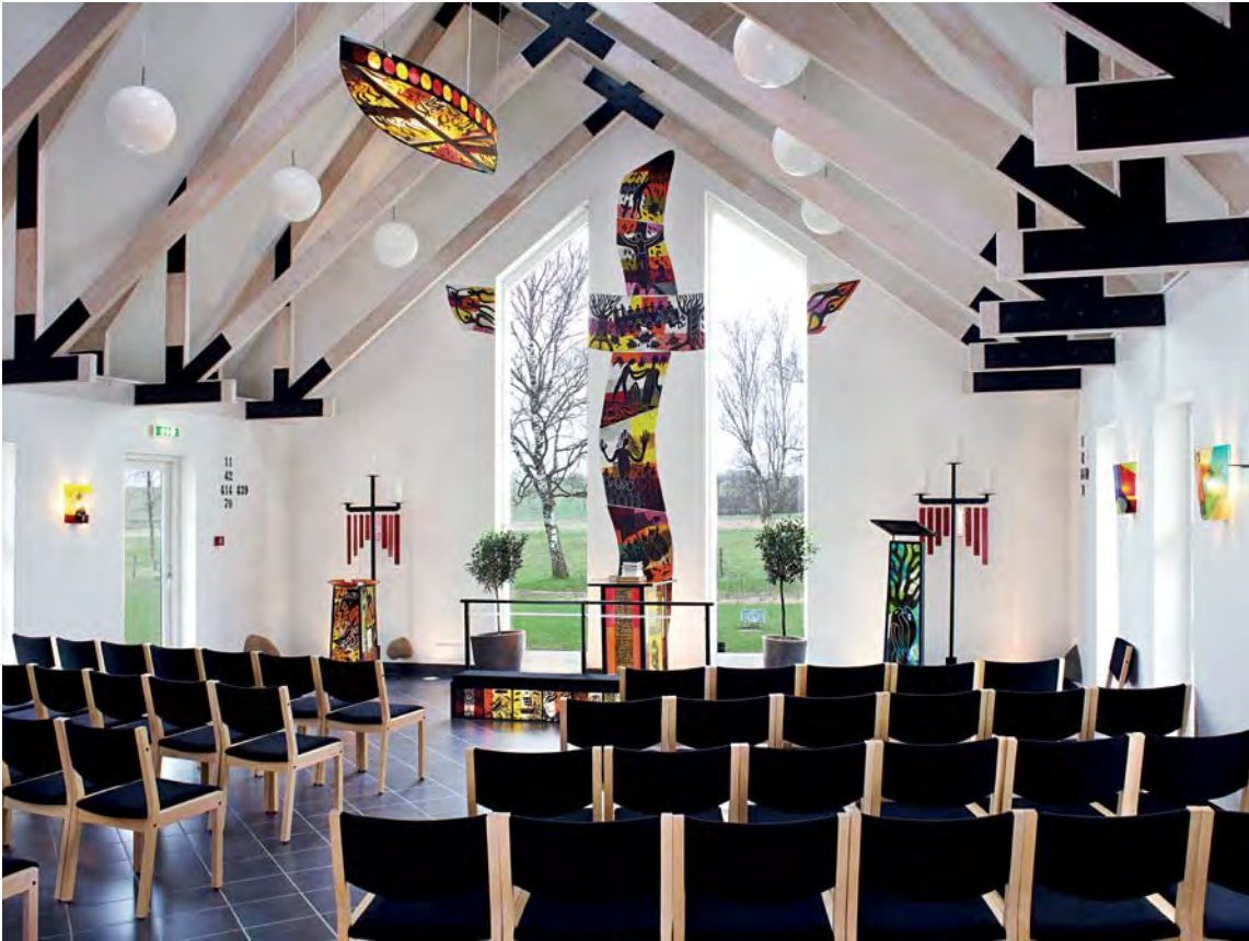
Fig. 3. Kirkesalens indre set mod syd. Foto AM 2011. – Interior of church seen towards the south.

af motiver, der skyldes de indsatte og viser hen til episoder i Jesu liv.