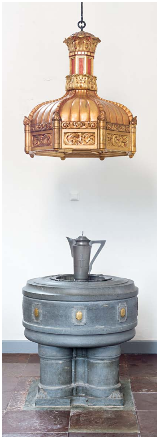
Fig. 6. Døbefont og fontehimmel, o. 1913 (s. 1402 f.). Foto AM 2010. – Font and font canopy, c. 1913.