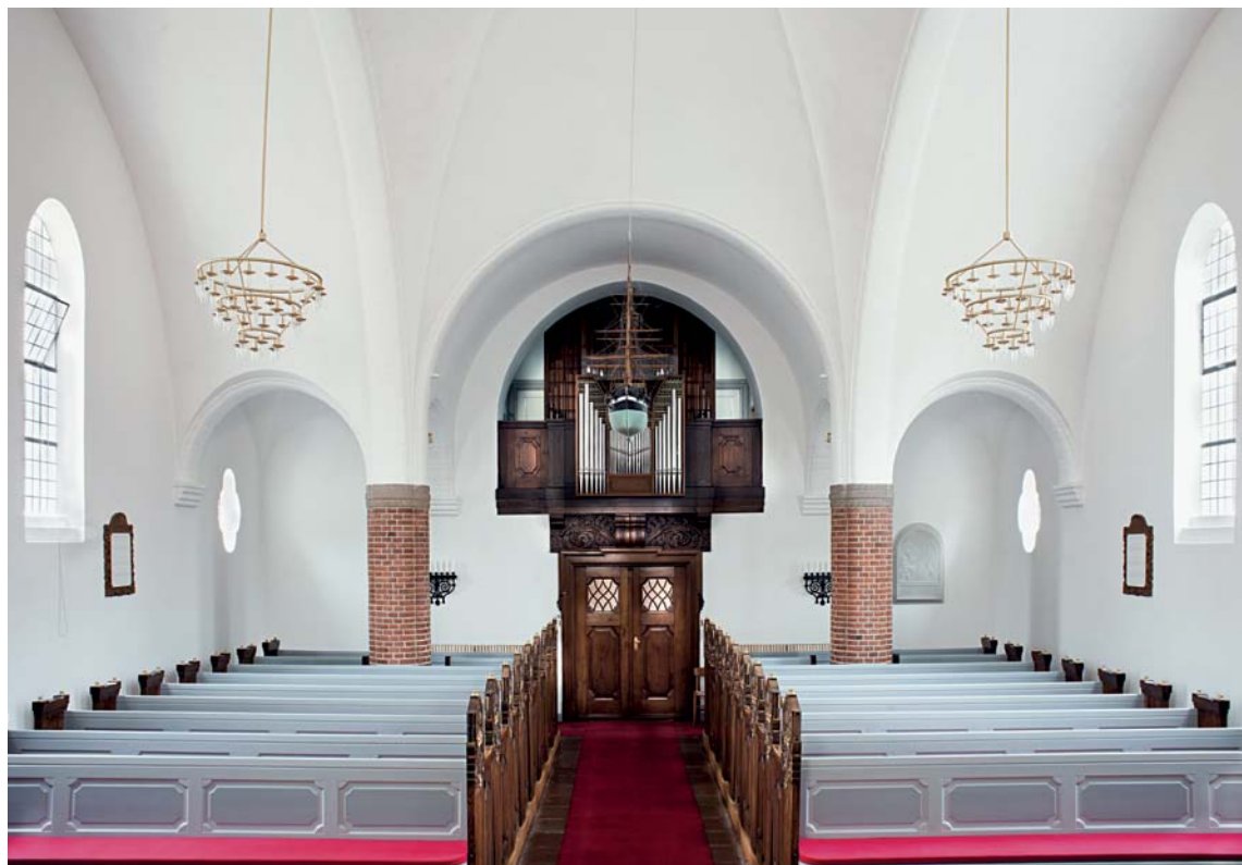
Fig. 5. Indre set mod vest. – Interior seen towards the west.

sten, prydes af kamme og blændinger i en lidt varieret udgave.