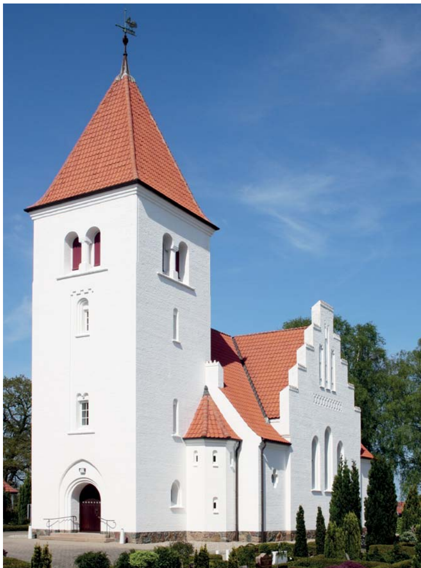
Fig. 4. Kirken set fra sydvest. – The church seen from the south west.

bygningen holdt i et frit blandet, middelalderligt formsprog med såvel senromanske som gotiske elementer, hvortil kommer en national symbolværdi: den hvidkalkede kirke med de røde tage.