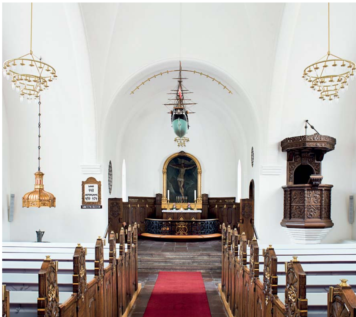
Fig. 1. Indre set mod øst. Foto AM 2010. – Interior seen towards the east.