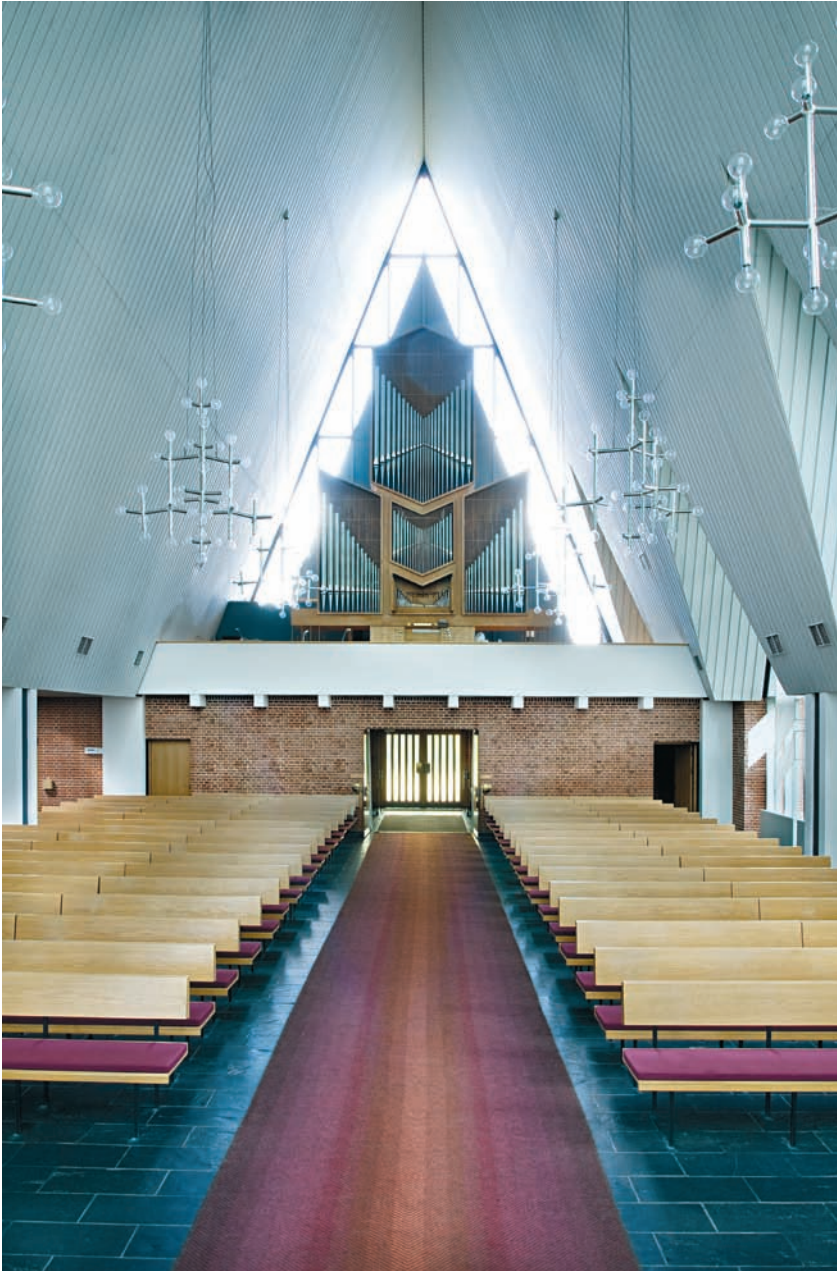
Fig. 5. Indre set imod indgangen i nord. – Interior viewed towards the entrance in the north.

udstyret med smalle vinduesbånd langs taglinjen. Foruden lysindfaldet fra gavlene, får rummet lys gennem tre store, tagformede vinduer i øst, hvis spidse gavle er skåret ind i langhusets tagflade, hvorved vinduerne nærmest får karakter af små 'kapeller'. Et lavt sideskib i vest, der i hele sin