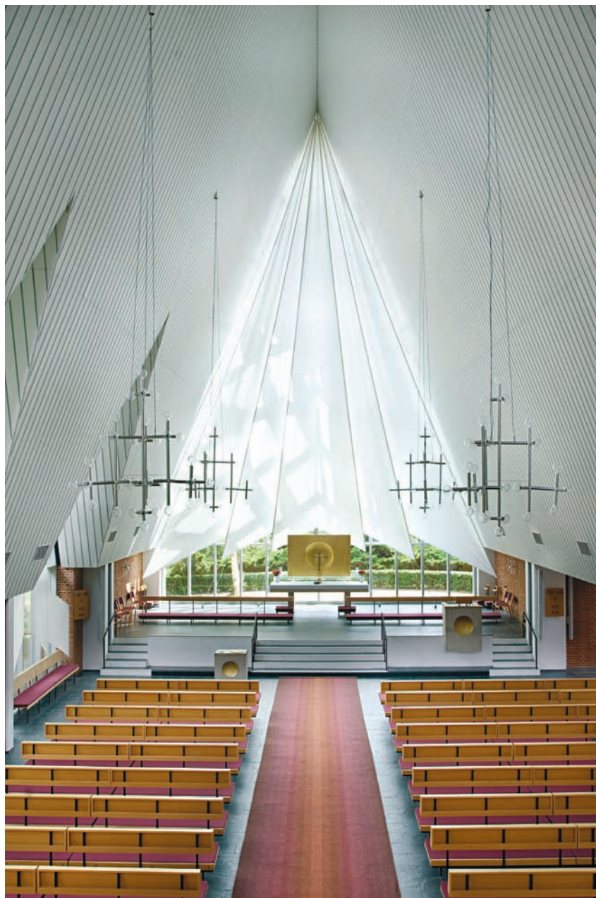
Fig. 4. Indre set imod alteret i syd. – Interior viewed towards the altar in the south.

Udefra domineres bygningen af de store tagflader over langhus og tårn, hvis mørke, irrende kobberdække opleves som en markant kontrast til kirkerummets lysfyldte indre. Langhusets stejle tag er rejst over lave, blanke mure af røde teglsten, og netop taget, der indvendig står med åben tag-