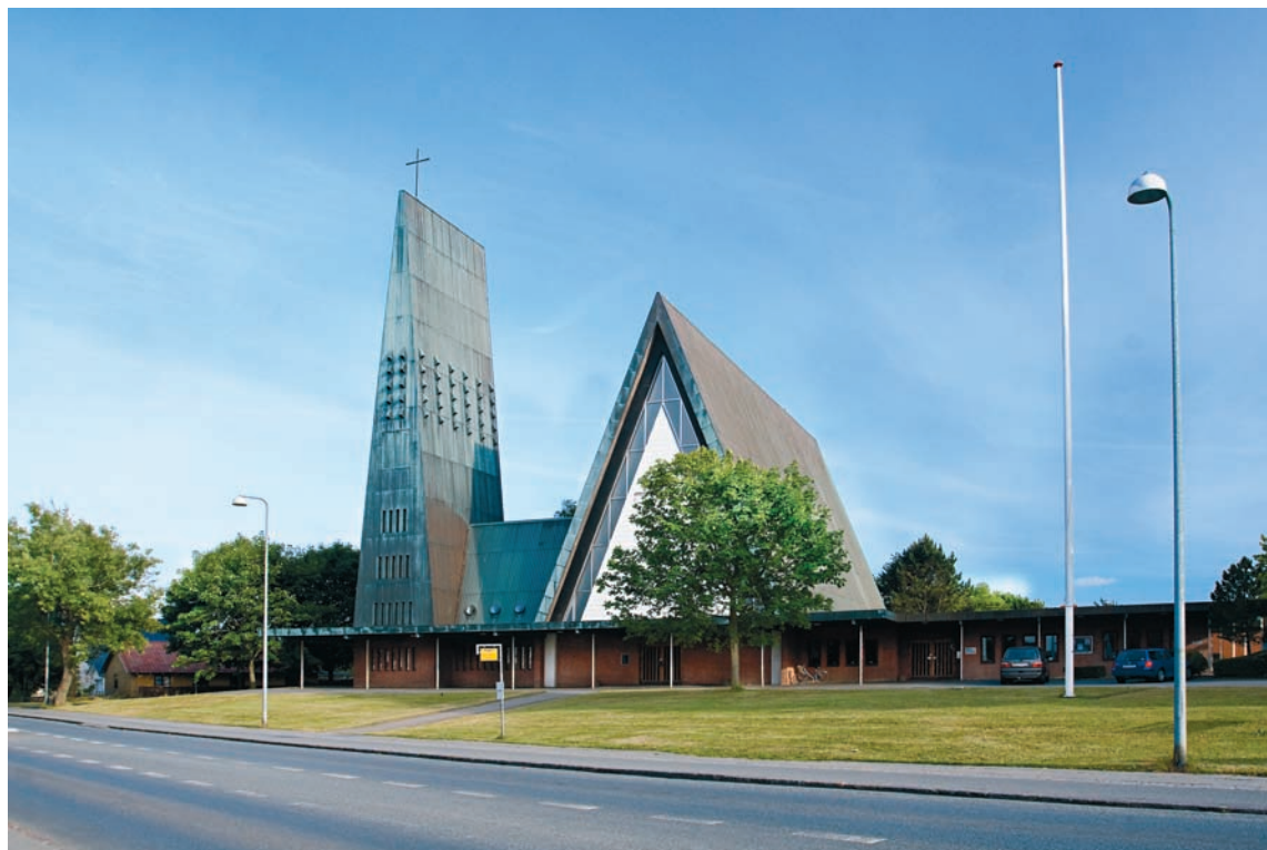
Fig. 1. Kirken set fra nordvest. The church viewed from the north west.