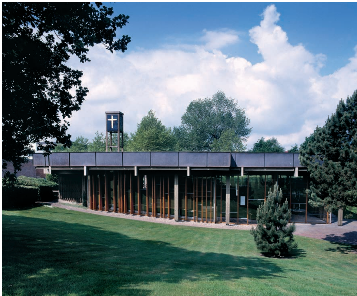
Fig. 1. Hannerup Kirke set fra øst. Foto AM 2006. – The church viewed from the east.