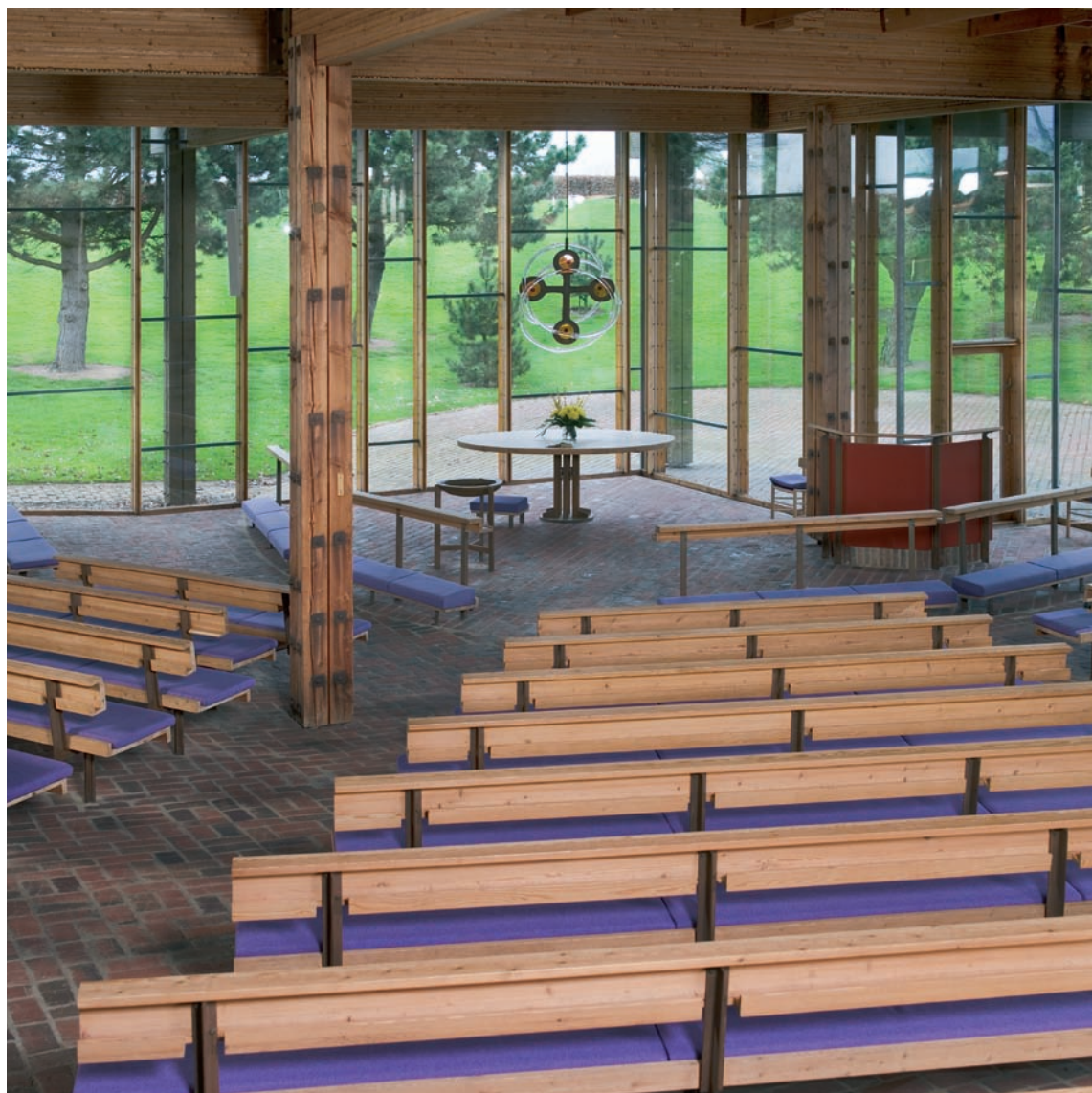
Fig. 3. Indre set imod nordøst. Foto AM 2006. – Interior viewed towards the north east.

det smukkere og mere værdigt, hvis altergæsterne modtog nadveren stående i en kreds. Kirkerummet burde nemlig ikke være en verden for sig, men et 'åbent mødested', der ikke appellerede til 'mystik og stemningsmageri'. Den foreslåede kirkebygning, med vægge af glas, skulle i sin essens være 'et tag i træ, båret af træ søjler', der kunne opfattes som 'stammer på træer', hvis kroner beskyttede det område, der udgjorde kirken.