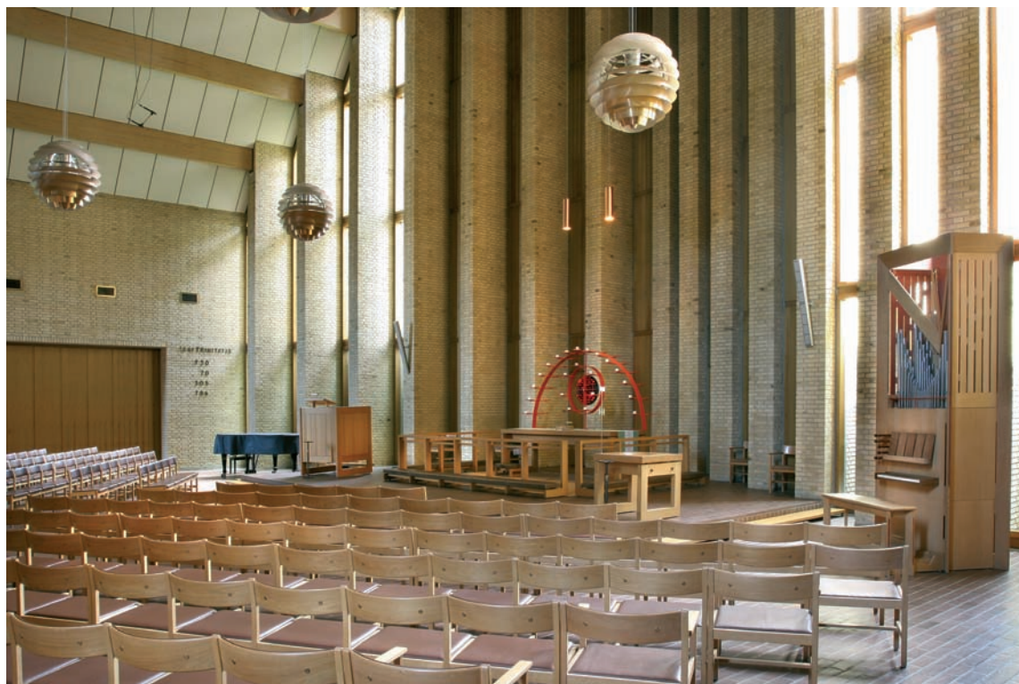
Fig. 4. Indre set mod øst. – Interior viewed towards the east.

en lille oblat med fremstilling af den korsfæstede, sejrende Kristus. Den er fremstillet i hvid emalje og indfattet af en ring af guld. Opbygningens jern er bevidst råtvirket og fremhæves med en skarp orange bemaling. Halvcirkelbuen bærer afsatser til levende lys og blomster, og jerncirklen indenfor har pladser for syv lys, der angiveligt skal minde om en syvstage, der stod i den gamle kirke, og som nu findes i sydfløjens ligkapel.