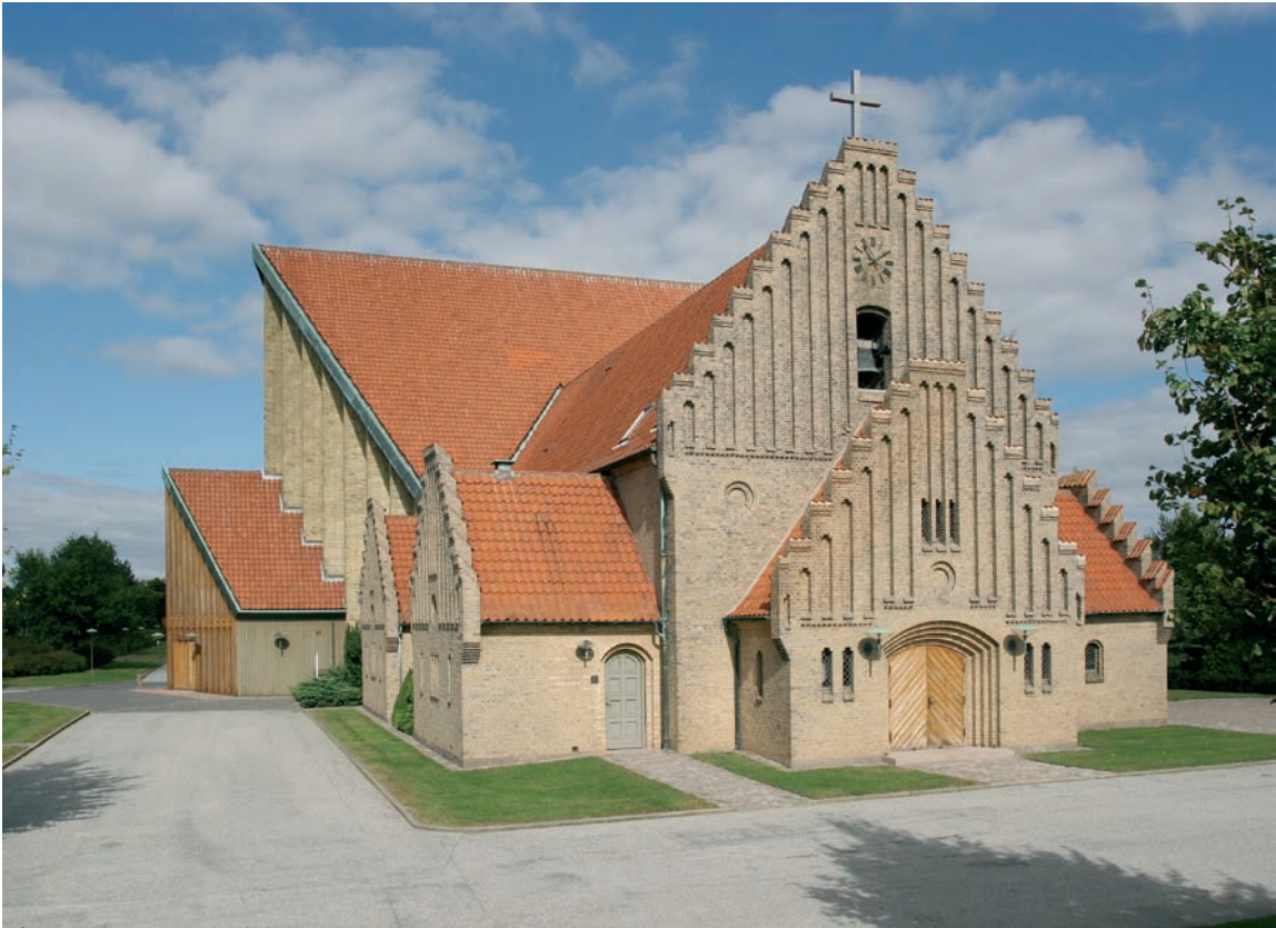
Fig. 1. Kirken set fra sydvest med det oprindelige kapel fra 1931 i forgrunden og bagest den tværvendte kirkefløj fra 1972. Foto HW 2005. – The church viewed from the south west.