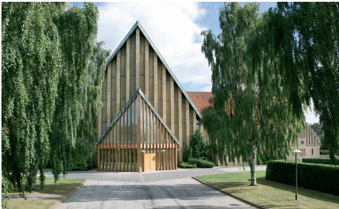
Fig. 3. Kirkeanlægget set fra vest med indgangen til fløjen fra 1972 i forgrunden. – The church viewed from the west.

Lillebælt. De fleste begravelser er foretaget i foråret 1945, de seneste i august 1947, efter at byen havde modtaget et stort antal tyske flygtninge og sårede soldater. Den græsklædte fællesgrav, der vedligeholdes i samarbejde med Volksbund Deutscher Kriegsgräberfürsorge, optages af mere end 200 liggende, kvadratiske gravsten af grå granit af gængs tysk type for grave fra 2. verdenskrig, almindeligvis med to navne på hver sten. Blandt de begravede er mere end 80 mindreårige børn, heraf mange spæde, døde i foråret 1945. 2