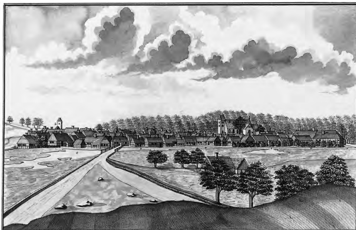
1. S. Nicolai Kirke. 2. Rådhuset. Prospekt af Vejle, sågen fra den Sydlige Side. Anne 1755. 3. Sjøer Port. 4. Vejle Naes Jærte.