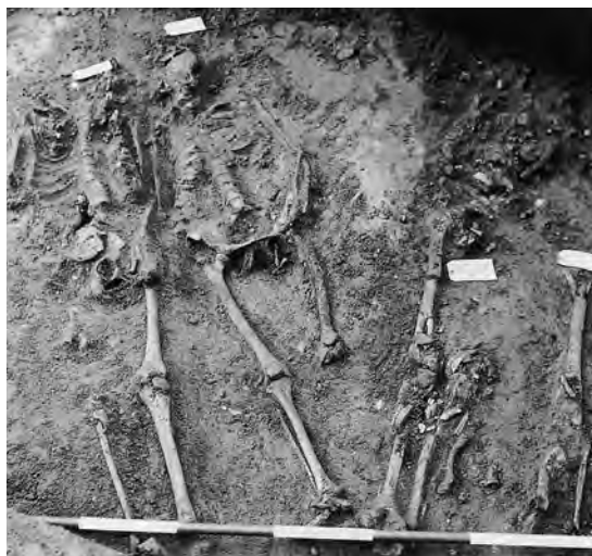
Fig. 9. Middelalderlige begravelser med indbyrdes afvigende orientering. Afdækket 1982 sydvest for kirkens fundamenter (s. 265) Efter Vejles Historie 1 , 1997. – Medieval burials with varying orientations. Uncovered in 1982 south west of the foundations of the church.