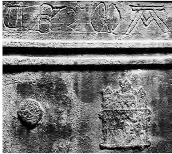
Fig. 8. Klokke, o. 1400, udsnit med indskrift, støberens »Olug Jurgensuns« bomærke (nr. 20) og pilgrimsmærke fra Kölns domkirke (s. 264). – Bell, c. 1400, detail with inscription, the mark of the bell-founder "Olug Jurgensun" and a pilgrim's badge from Cologne Cathedral.

I begravelserne, af hvilke hen ved 30 har ligget inde i kirken, har ligene øjensynligt hovedsagelig haft armene lagt over bækken, mave eller bryst, traditioner, der passer udmærket med en forventet henførelse til den sene middelalder. 61 Det gælder med sikkerhed de ovennævnte to begravelser (murede?), der fremkom 1937 under arrestforvalterens nu nedbrudte bolig. Fra disse grave stammer to velbevarede *gravsværd , 120 og 110 cm lange, 62 hvis nedlæggelse repræsenterer en udpræget ridderlig skik. Både slagsværdene selv og den tradition, deres medgivelse i graven tilhører, peger på en datering efter 1450. Der har således været tale om mandlige adelsbegravelser af en status, som så at sige alene kan tænkes inde i kirken eller i en kapeltilbygning (jf. ovf.). 63 Sværdene befinder sig i Vejle Museum (inv.nr. VKM 474×1-2).