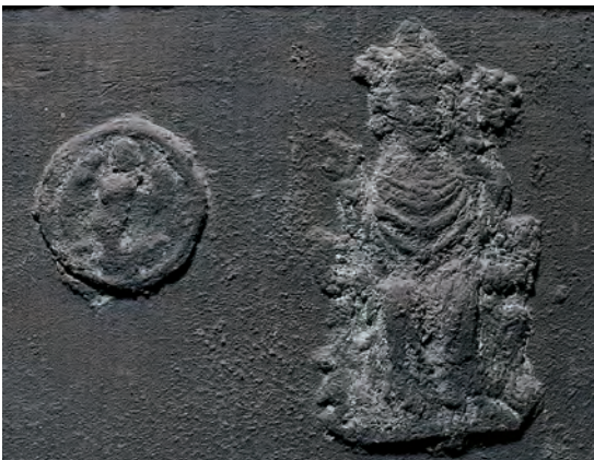
Fig. 7. Klokke, o. 1400, udsnit med cirkulært tegn (en engel) og pilgrimsmærke fra Skt. Theobald i Thann i Elsass (s. 264). – Bell, c. 1400, detail with circular token (an angel) and pilgrim's badge from St. Theobald in Thann in Alsace.

Ved de arkæologiske udgravninger er der i og omkring kirketomten afdækket et større antal begravelser og spor efter sådanne, der vel løber op imod et halvt hundrede (fig. 2). Enkelte begravelser var murede, men i øvrigt er det ikke oplyst, i hvilket omfang der var tale om jordfæstegrave eller kistegrave. 60