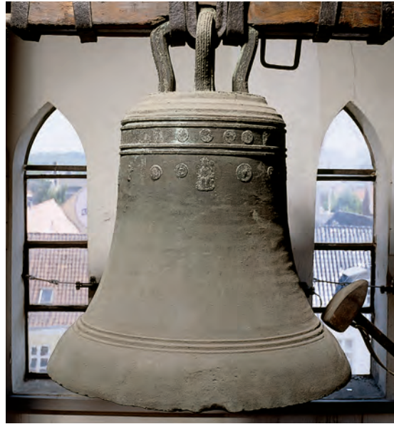
Fig. 3. Klokke, o. 1400, tilskrevet støberen »Olug Jurgensun« og forsynet med talrige pilgrimstegn og -mærker (s. 263). – Bell, c. 1400, attributed to the bell-founder "Olug Jurgensun" and furnished with many pilgrims' badges and other tokens.

På klokkelegemets øvre del ses en omløbende række med yderligere 16, til dels noget større, relieffer: 7) (Fig. 4) Pilgrimstegn fra klostret i Einsiedeln, et Maria-valfartssted i det nordlige Schweiz. Mærket er gavlformet, 7,7 cm højt, gennembrudt, og kronet af et lille kors. Det forestiller Einsiedelns Mariakapel, som efter en nybygning 948 skulle indvies af bisp Konrad af Konstanz; men en røst befalede ham at holde inde, eftersom Gud selv allerede havde indviet kapellet. Fremstillingen kan identificeres, til dels med hjælp af bevarede originaltegn. Den venstre del af mærket viser kapellet med søjlebåren gavlf og tag og et trønde Maria-billede med barnet stående på venstre knæ. I døråbningen står en engel med et stort lys, og foran kapellet bisp Konrad med bispestav og løftet vievandskvast samt endnu en engel. Rundt om hele mærket løber en tysk minuskelindskrift, hvoraf der kan læses tilstrækkelige brudstykker, til at den ses at have svaret til sådanne mærkers sædvanlige: »dis ist vnser vrowen capell zeichen von neisidelen die wiett gott selb mit engen« (Det er Vor Frues kapeltegn fra Einsiedeln, det indvier Gud selv med englene). 47 I mærkets hjørner ses små øskner, der har tjent til det originale mærkes påsning på pilgrim-