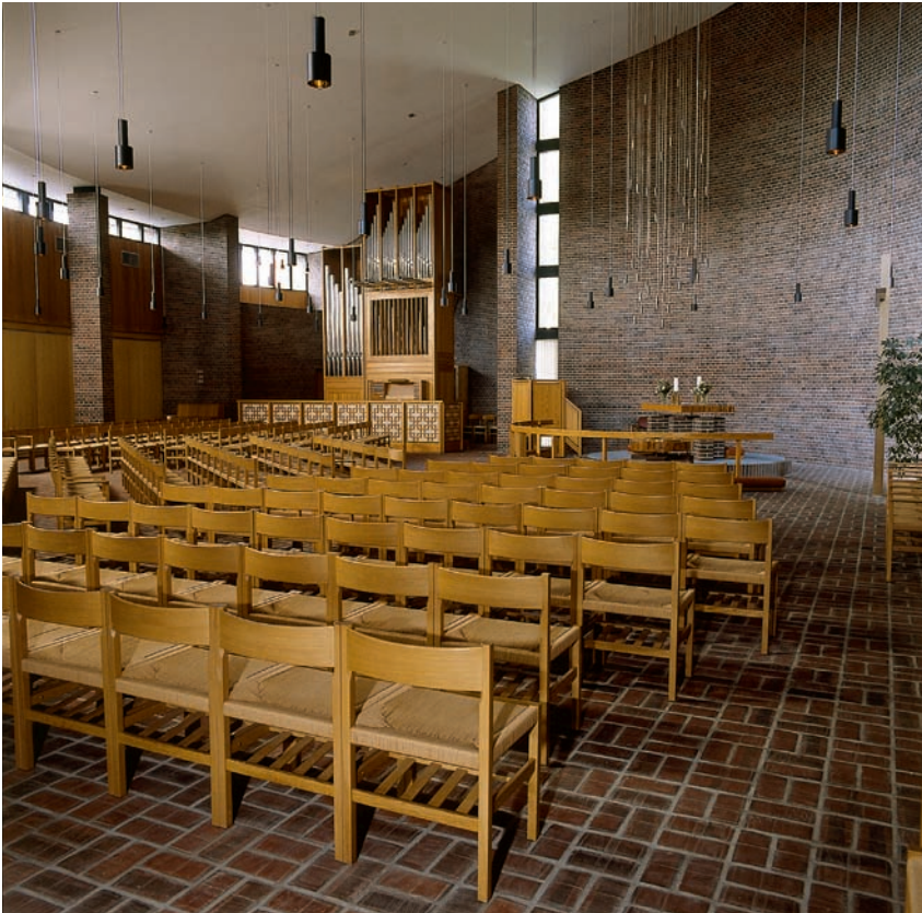
Fig. 4. Indre set mod alteret. Interior viewed towards the altar.

som en 'vifte' breder sig ud fra centrum, det høje korparti i sydøst. Bygningen, der af menigheden selv betegnes som en 'arbejdskirke', består, som mange af efterkrigstidens kirkecentre, foruden selve kirken af en række tilstødende lokaler: en mødesal, der, når det er ønskeligt, kan inddrages i kirkerummet, to konfirmandstuer og fire kontorlokaler samt en forhal og et køkken.