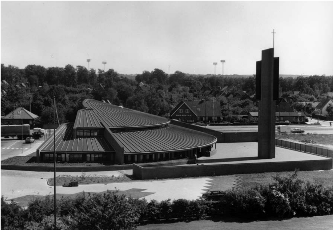
Fig. 1. Kirken set fra vest efter færdiggørelsen 1976. – The church viewed from the west after its completion in 1976.