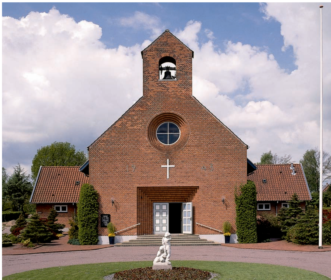
Fig. 1. Kirken set fra øst. Foto AM 2005. – The church viewed from the east.