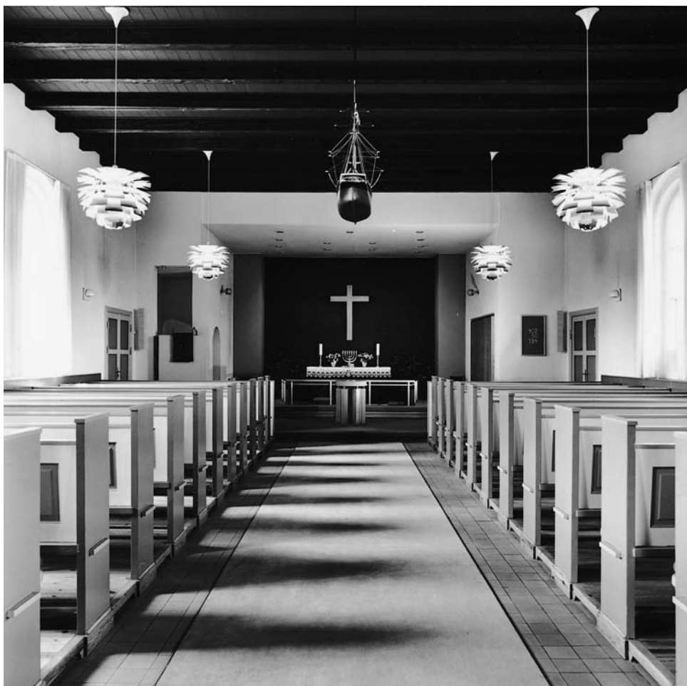
Fig. 3. Indre set mod vest, mod altret. – Interior viewed towards the west and the altar.

1977 ved arkitekt N. E. Steensen, Vejle, mens prædikestolen er fornyet efter branden 1983 af samme arkitekt. Til istandsættelsen efter branden hører også kirkerummets farvesætning i gråt, blåt og lidt gult.