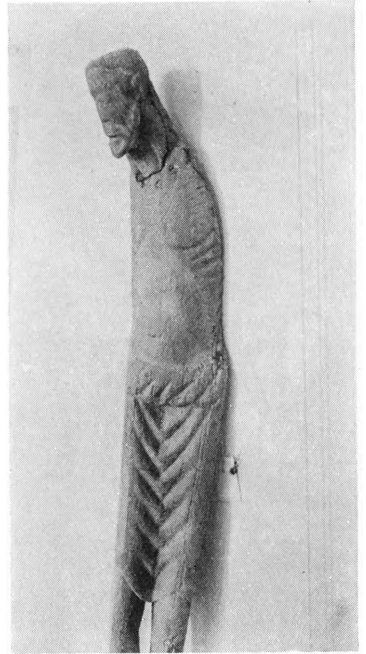
Fig. 3. Tæbring. Font (S. 816).