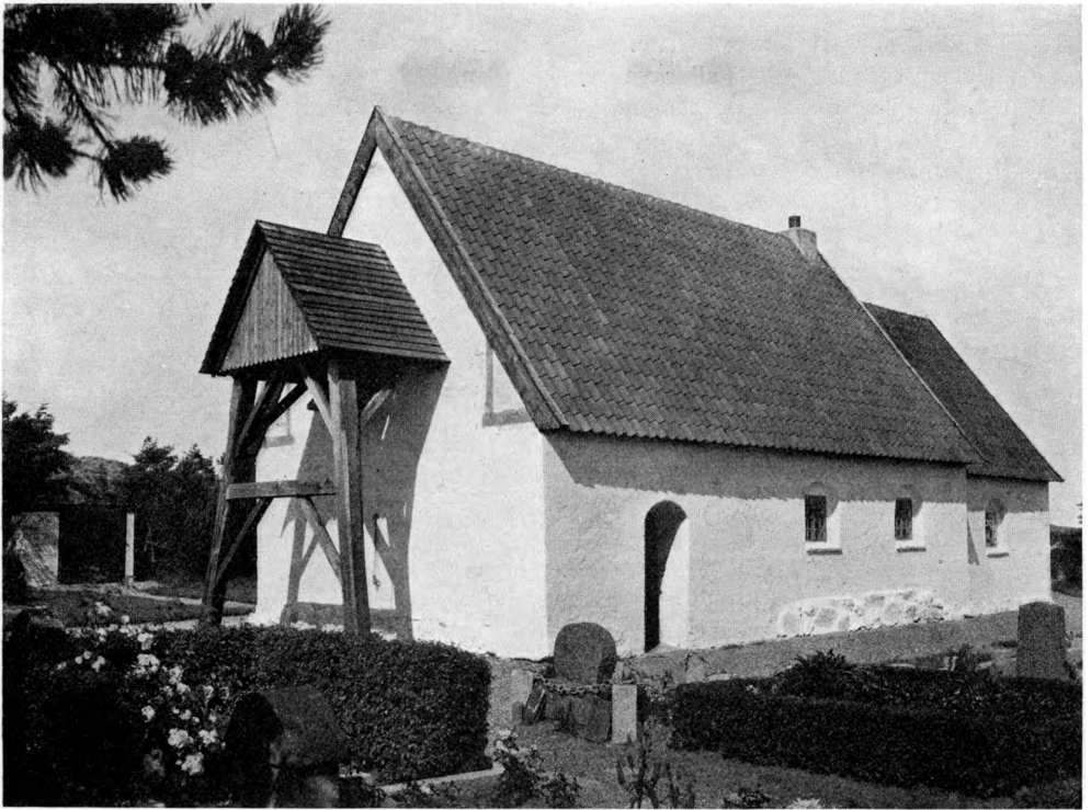
Fig. 1. Lodbjerg. Ydre, set fra Sydvest.