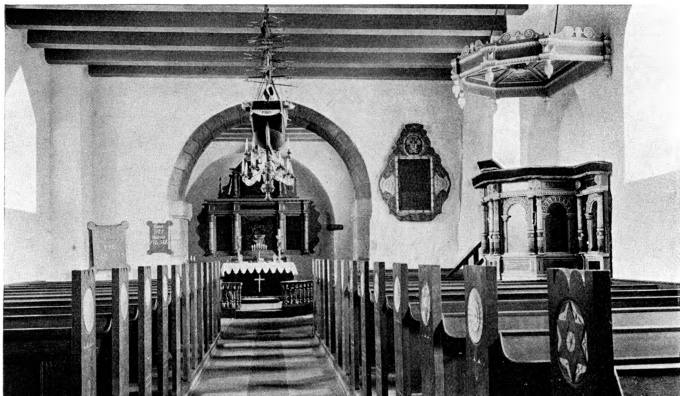
Fig. 3. Hørdum, Indre, set mod Øst.