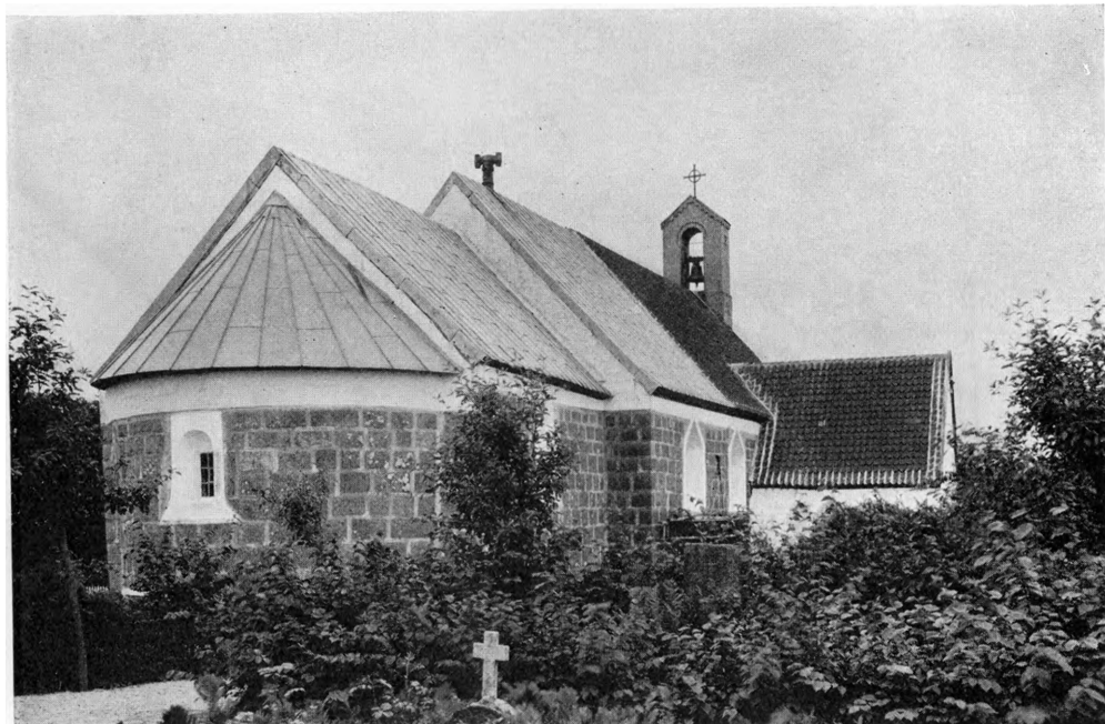
Fig. 1. Hørdum. Ydre, set fra Nordøst.