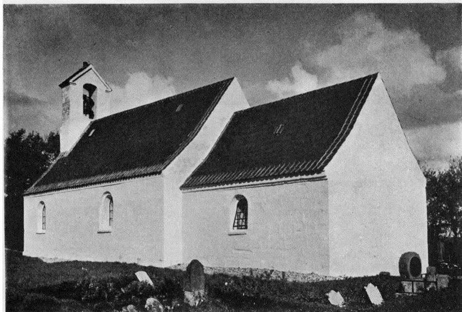
Fig. 1. Kallerup. Ydre, set fra Sydøst.