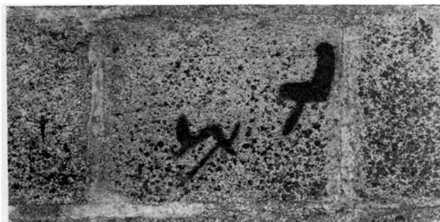
E. M. 1935