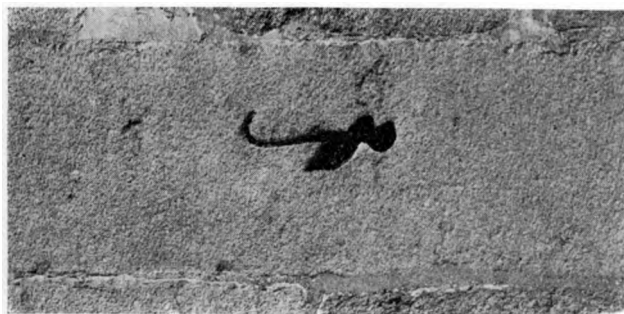
C. A. J. 1919