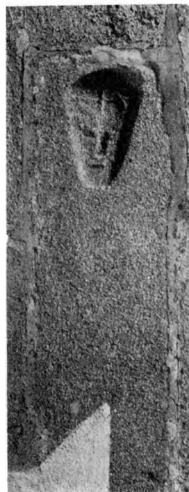
C. A. J. 1919