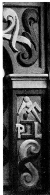
E. M. 1936