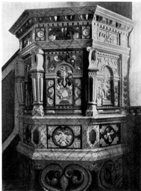
Fig. 6. Kaastrup. Altartavle 1649 (S. 312).