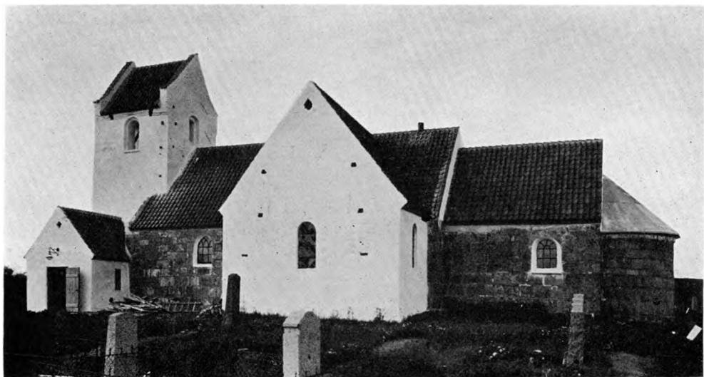
Fig. 1. Klim. Ydre, set fra Syd.