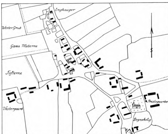
Fig. 11. Klim (1812).

5 I Klim Bjærg har der fra gammel Tid været brudt Limsten (Kridtsten), se Trap V (4. Udg.), 330. 6 Kirkehist. Saml. 5. R. III, 536. 7 Ved Maler Johs. Th. Madsen, Aalborg. 8 Danske Atlas V, 314. 9 Løffler: Gravsten S. 16, Tav. XVII, 85. 10 Smst. Tav. XVII, 88. 11 Wiberg: Præstehistorie I, 369. 12 Danske Atlas V, 314, sml. AarbThisted. 1908. S. 64, 1936. S. 250 f.