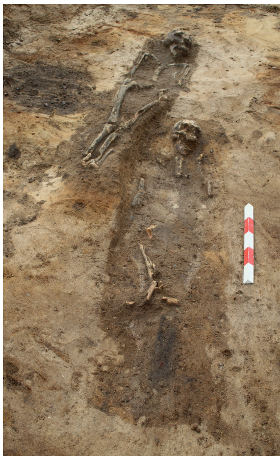
Fig. 4. Jordfæstegrave set fra øst. – Inhumation graves seen from the east.