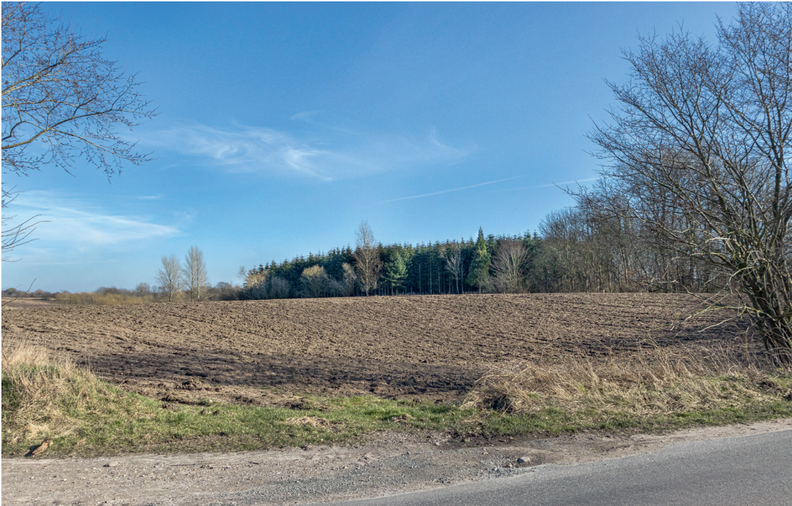
Fig. 1. Kirketomten set fra vest med grusgravssænkningen i forgrunden. Til venstre i billedet anes spiret på Brahetrolleborg Kirke. – The church ruin seen from the west with the gravel quarry hollow in the foreground. On the left of the picture one can make out the spire of Brahetrolleborg Church.