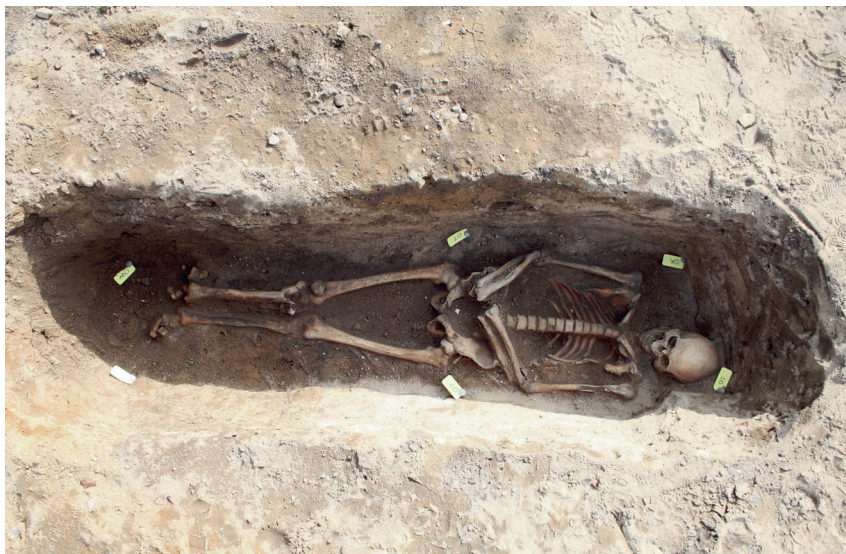
Fig. 3. Jordfæstegrav set fra nord. – Inhumation grave seen from the north.

dere berettede om fund af tagsten, murbrokker og knogler. 14 At bygningen i princippet kan have været placeret syd for det undersøgte område, i Damsbos have (jf. ovf.), hvor der tidligere er fundet knogler og tegl, kan dog ikke udelukkes.