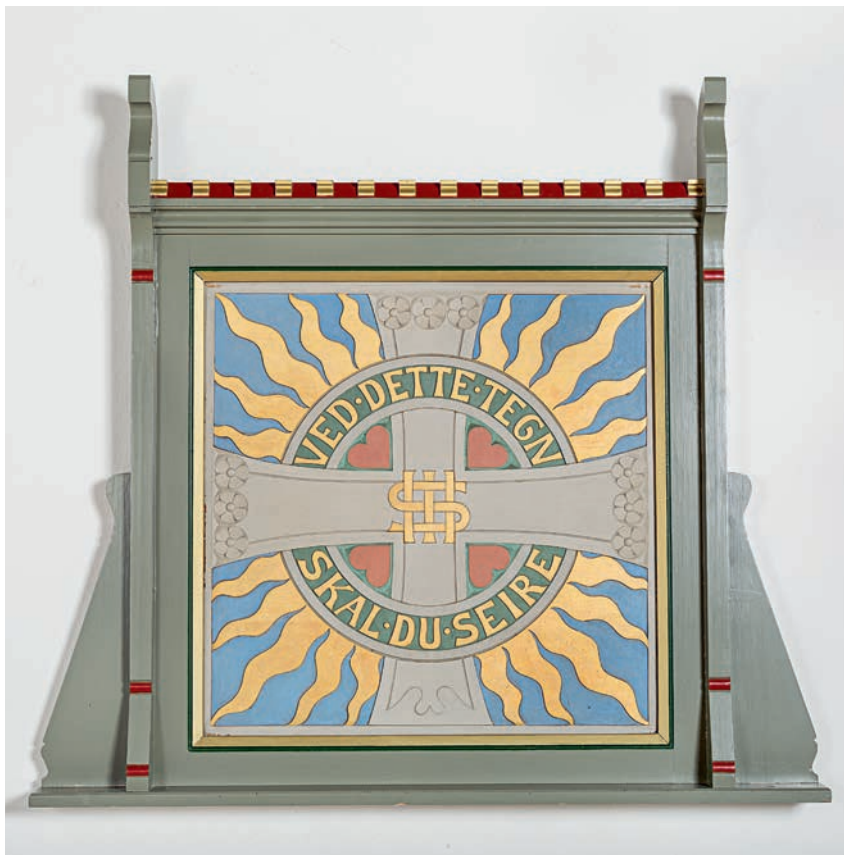
Fig. 8. Altartavle (s. 2880). – Altarpiece.

slaget blev dog ikke godkendt af Kirkeministeriet. 15