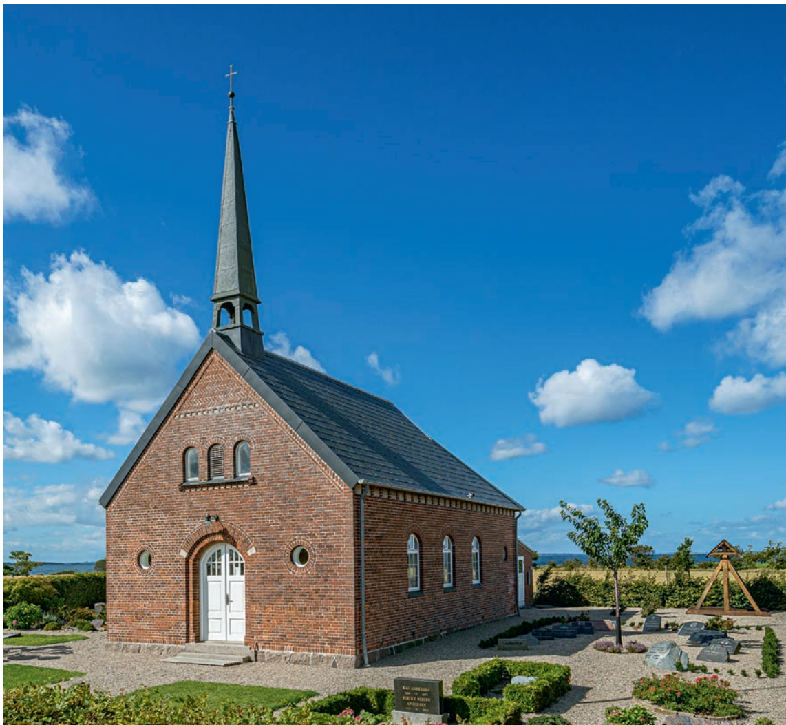
Fig. 1. Kirken og klokkestablen set fra øst. – The church and the bell frame seen from the east.