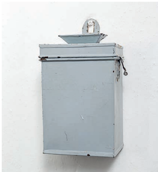
Fig. 17. Pengebøsse, o. 1850-1900 (s. 2883). – Money box, c. 1850-1900.