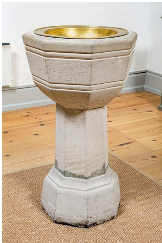
Fig. 12. Døbefont og dåbsfad (s. 2882). – Font and baptismal dish.

Fire salmenummertavler (fig. 14), 66×34 cm, med rundstav foroven og søm til ophæng af cifre. Rammeverket er brunlakeret med grøn inderprofil, selve tavlen er sortmalet. Oprindeligt blev salmenumrene skrevet på med kridt (jf. fig. 6).