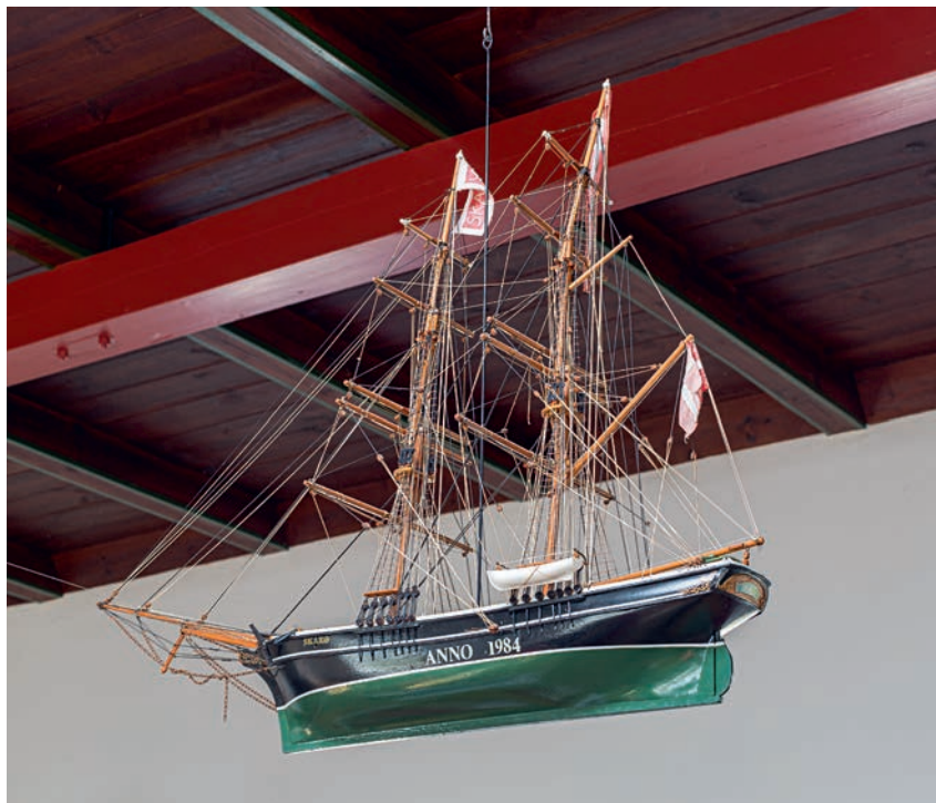
Fig. 13. »Skarø«. Kirkeskib, bygget af Fritz Brade Jørgensen, Bregninge, ophængt 1985 (s. 2884). – “Skarø”. Church ship built by Fritz Brade Jørgensen, Bregninge, hung up in 1985.