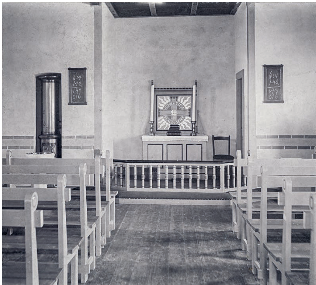
Fig. 6. Indre set mod nordvest, begyndelsen af 1900-tallet. – Interior looking north west, beginning of 1900s.

Vinduer. Kirkens vinduer har hvidmalede, sprossede trærammer (jf. fig. 4). De søndre er indsat 2006, og de tre vinduer i østgavlen er udskiftet 2008. 7 De oprindelige trærammer i de fladbuede vinduer havde kun sprosser i den øverste fladbuede del (jf. fig. 5), mens de cirkulære vinduer var sprossede. 1974 blev de søndre vinduer udskiftet. 7