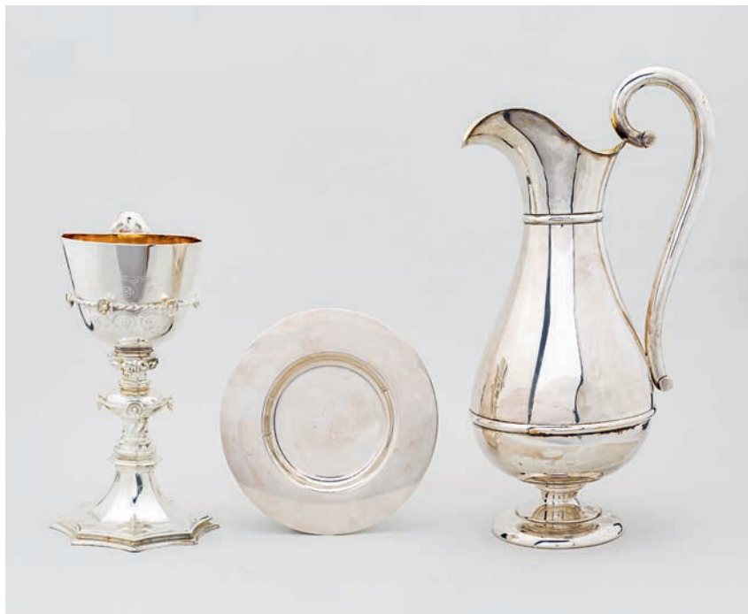
Fig. 9. Kalk, disk og alterkande (s. 2881). – Chalice, paten and altar jug.

til væggen i hver side. Skranken består af drejede, gråmalede balustre med røde og grønne profiler