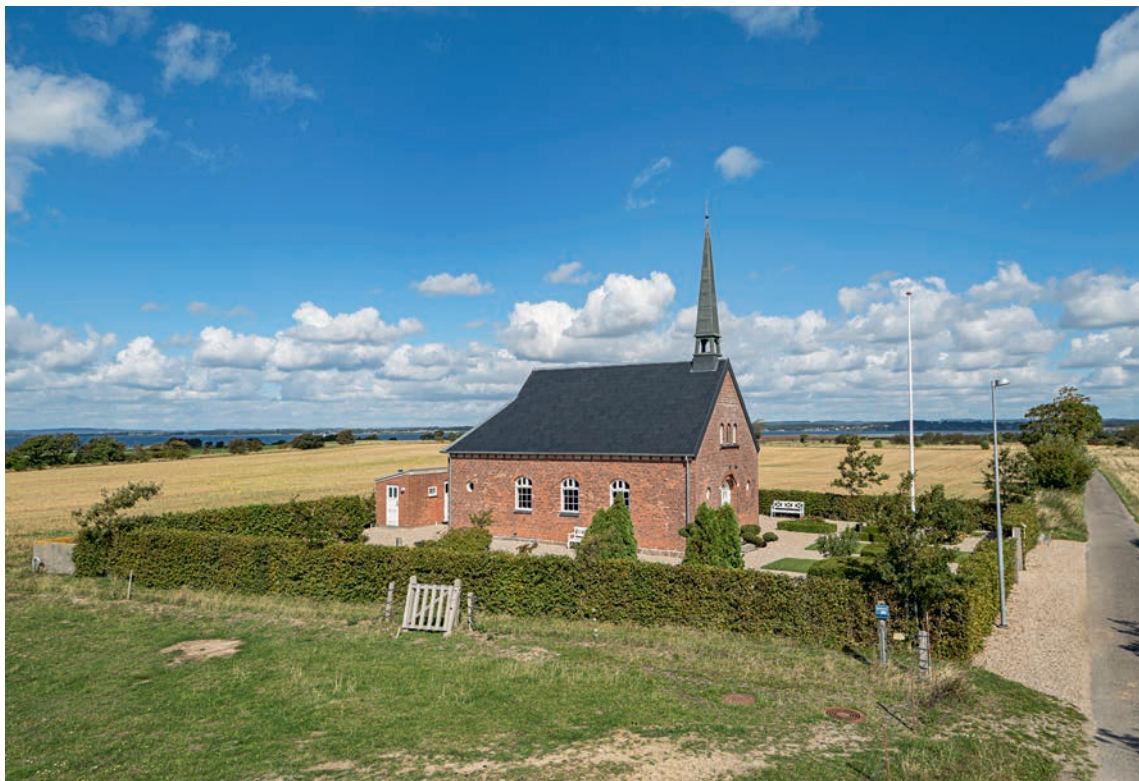
Fig. 4. Kirken i landskabet set fra syd. Foto Arnold Mikkelsen 2020. – The church in the landscape seen from the south.