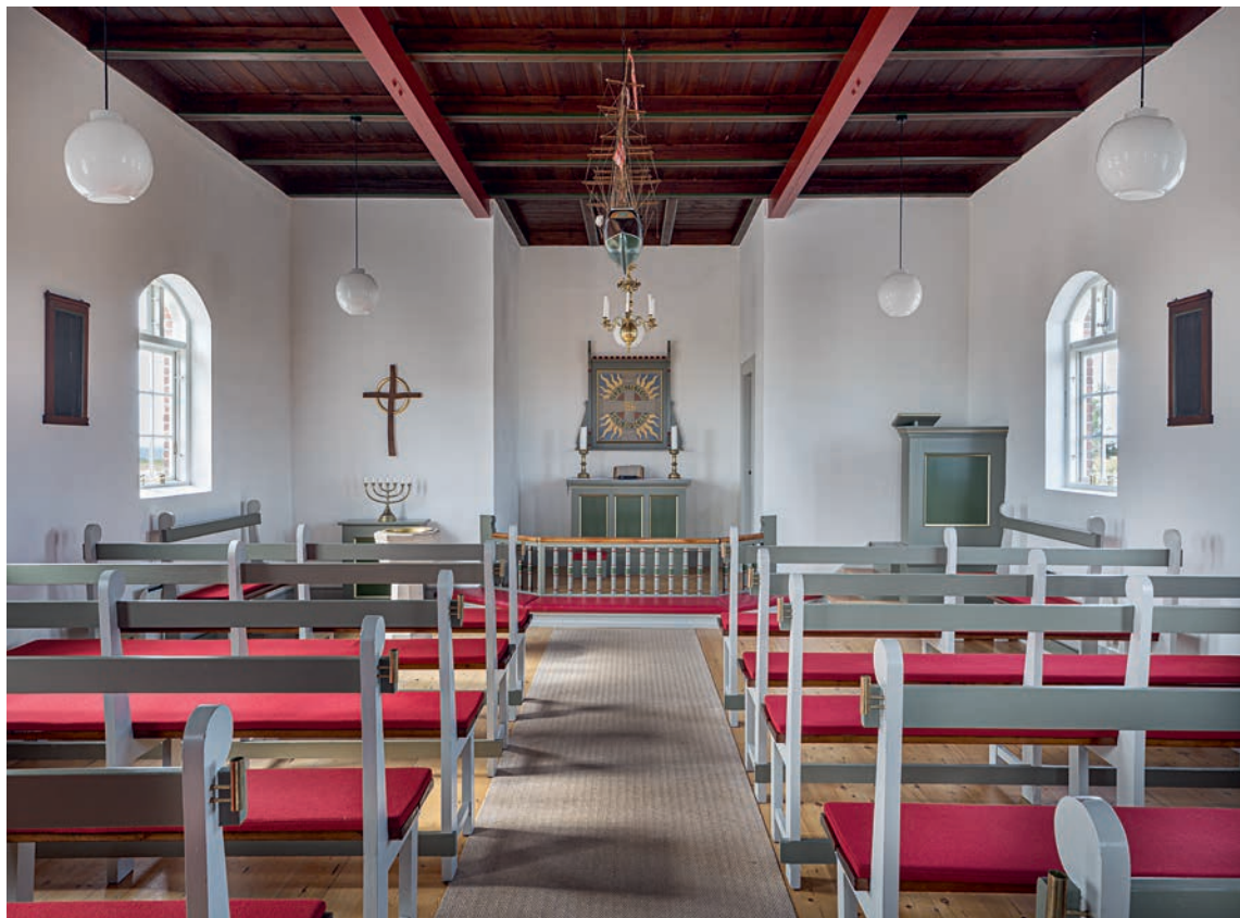
Fig. 7. Indre set mod nordvest. Foto Arnold Mikkelsen 2020. – Interior looking north west.