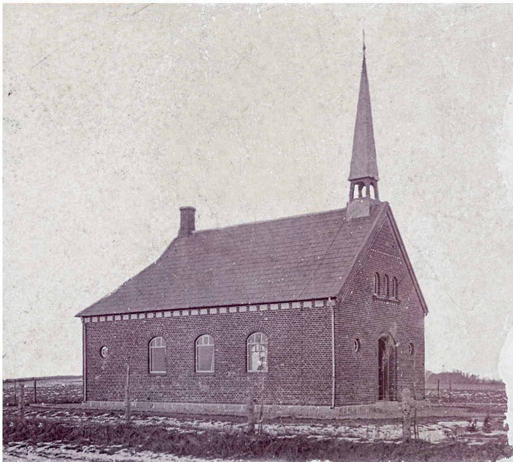
Fig. 5. Kirken set fra syd, begyndelsen af 1900-tallet. – The church seen from the south.

vinduer (jf. ovf.). Skifersålbænken hviler på et udkraget tandsnit med pudset bund og er indrammet af to små, profilerede konsoller.