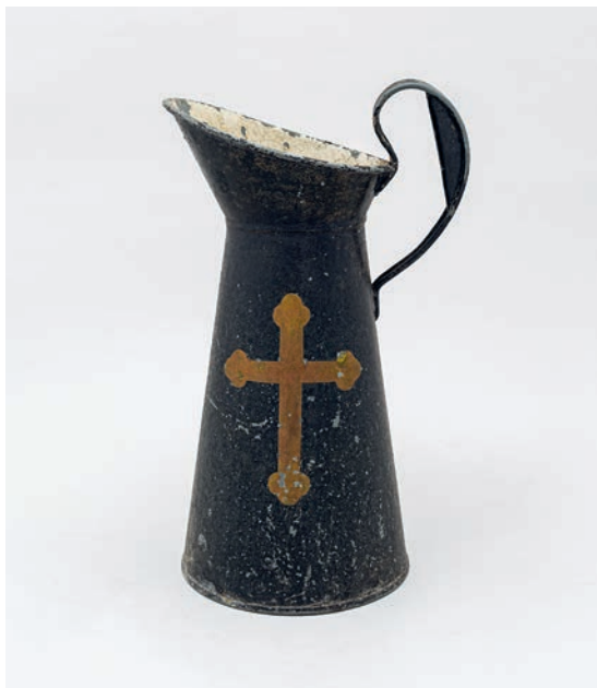
Fig. 11. Dåbskande, o. 1850-1900 (s. 2882). – Baptismal jug, c. 1850-1900.

Stolestaderne (jf. fig. 7) er enkle bænke med åbne rygge med tre lodrette stivere med cirkelformet udvidelse foroven og en tværstiver. De er malet i to grå nuancer med mørklakerede sæder og hynder af rødt uld. Der står seks bænke i nordsiden og ni i sydsiden; to tilsvarende bænke er opstillet langs væggene forrest i kirken.