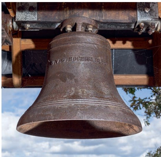
Fig. 15. Klokke, 1898, støbt hos Bochumer Verein für Bergbau und Gußstahlfabrikation (s. 2885). Foto Arnold Mikkelsen 2020. – Bell, 1898, cast by Bochumer Verein für Bergbau und Gußstahlfabrikation.

samt agter; midtfor på begge sider står med hvide versaler: »Anno 1984«. Skibet hænger i en kæde.