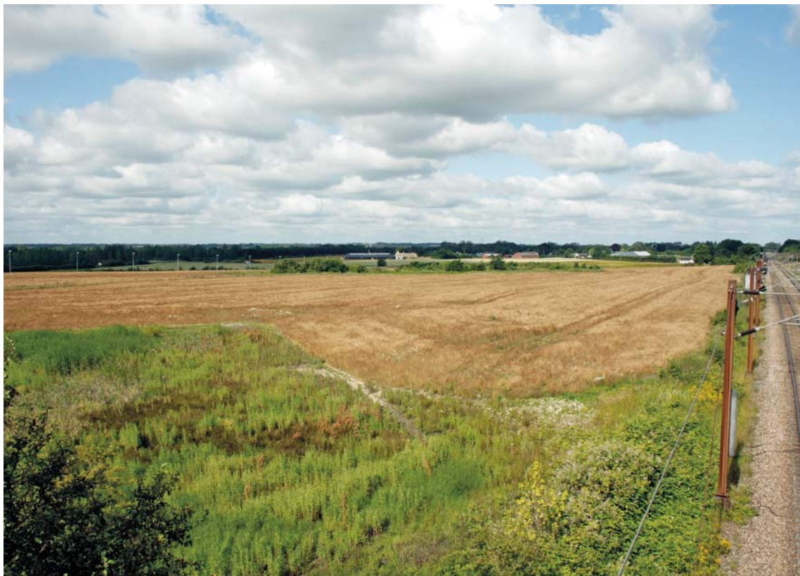
Fig. 1. Kirketomten set fra vest. – Church site seen from the west.