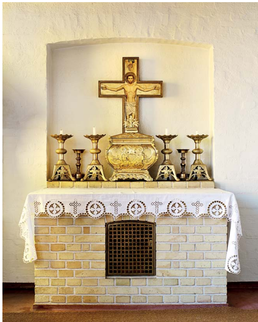
Fig. 7. Karl den Godes kapel. Foto Arnold Mikkelsen 2011. – The chapel of Charles the Good.

blev anskaffet, da kirken planlagde en indvielse til denne, er opstillet i en niche i våbenhuset. 16 2) 1900-tallet, af træ, 130 cm høj, Maria med barnet som den apokalyptiske Madonna stående på himmelgloben, bag hvilken måneseglet ses. Den brogede staffering domineres af Marias røde kjole og turkis kappe. I en niche sydligt på skibets vestvæg.