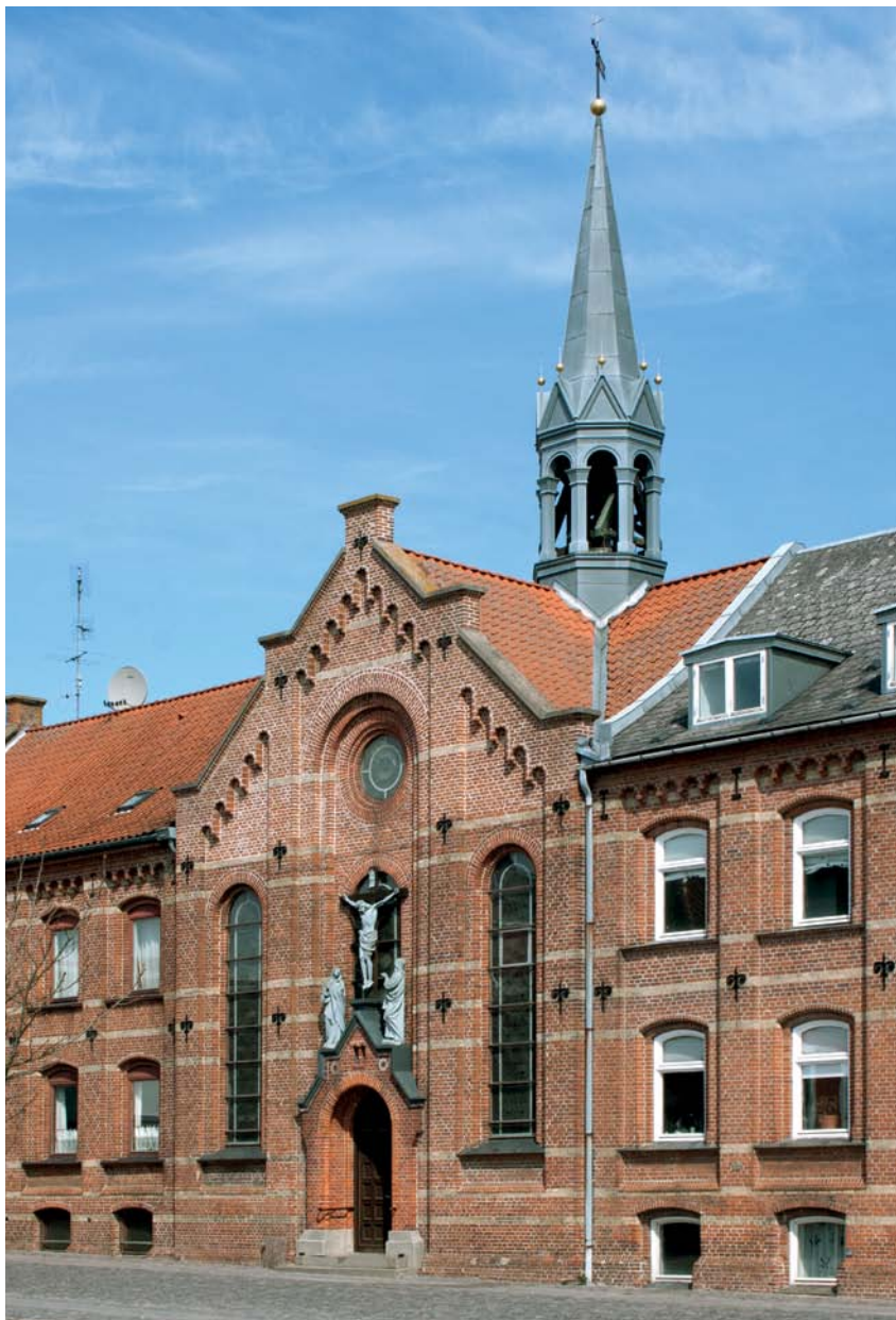
Fig. 3. Kirken set fra Havnegade. – The church seen from Havnegade.