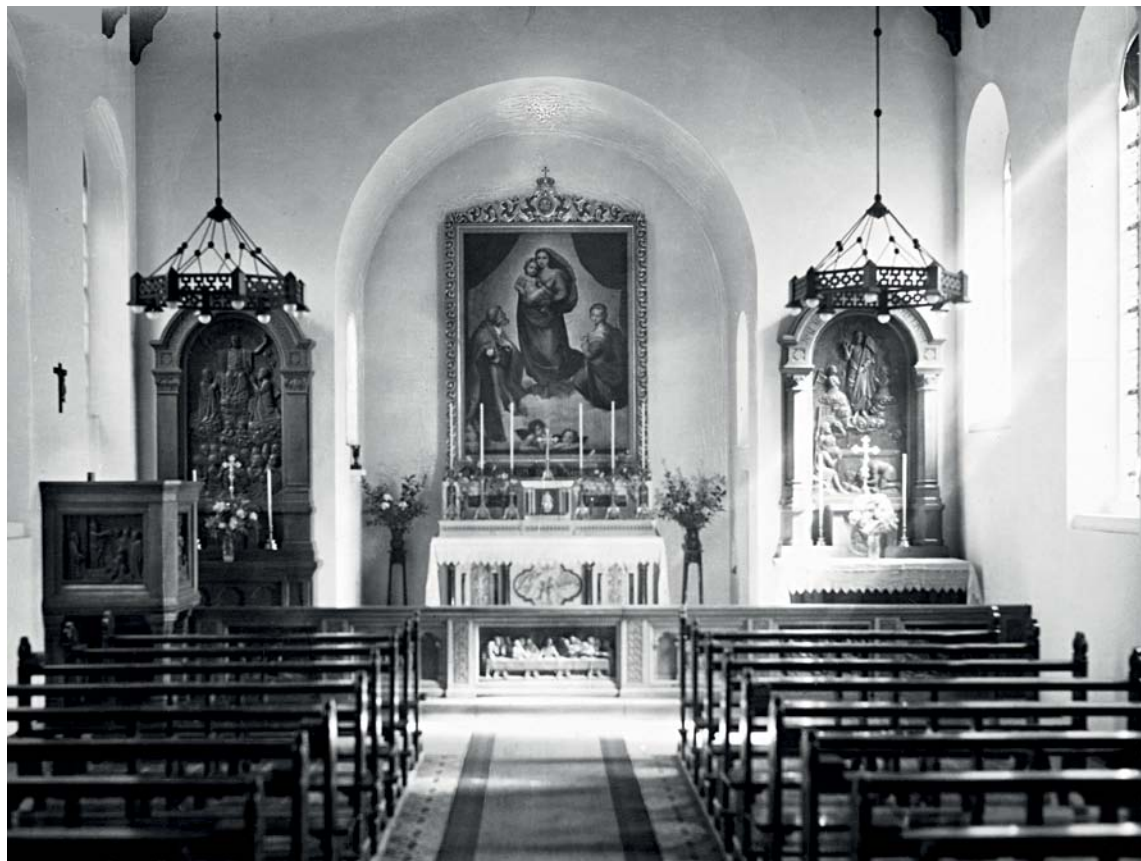
Fig. 6 Kirkens indre o. 1937. – Interior of the church c. 1937.

en todelt mekanisk sløjfevindlade med tilbygget pneumatisk keglevindlade; pedalet har pneumatisk keglevindlade. Oprindelig i todelt opstilling, flankerende vestvæggens midterste vindue. Ved ombygningen 1946 blev orglet opstillet samlet bag en ny facade med tre pibefelter. Orglet er malet gråt og rødt med blåmalede træpiber. På pulpituret, med spillebord i orgelhusets østgavl. 18