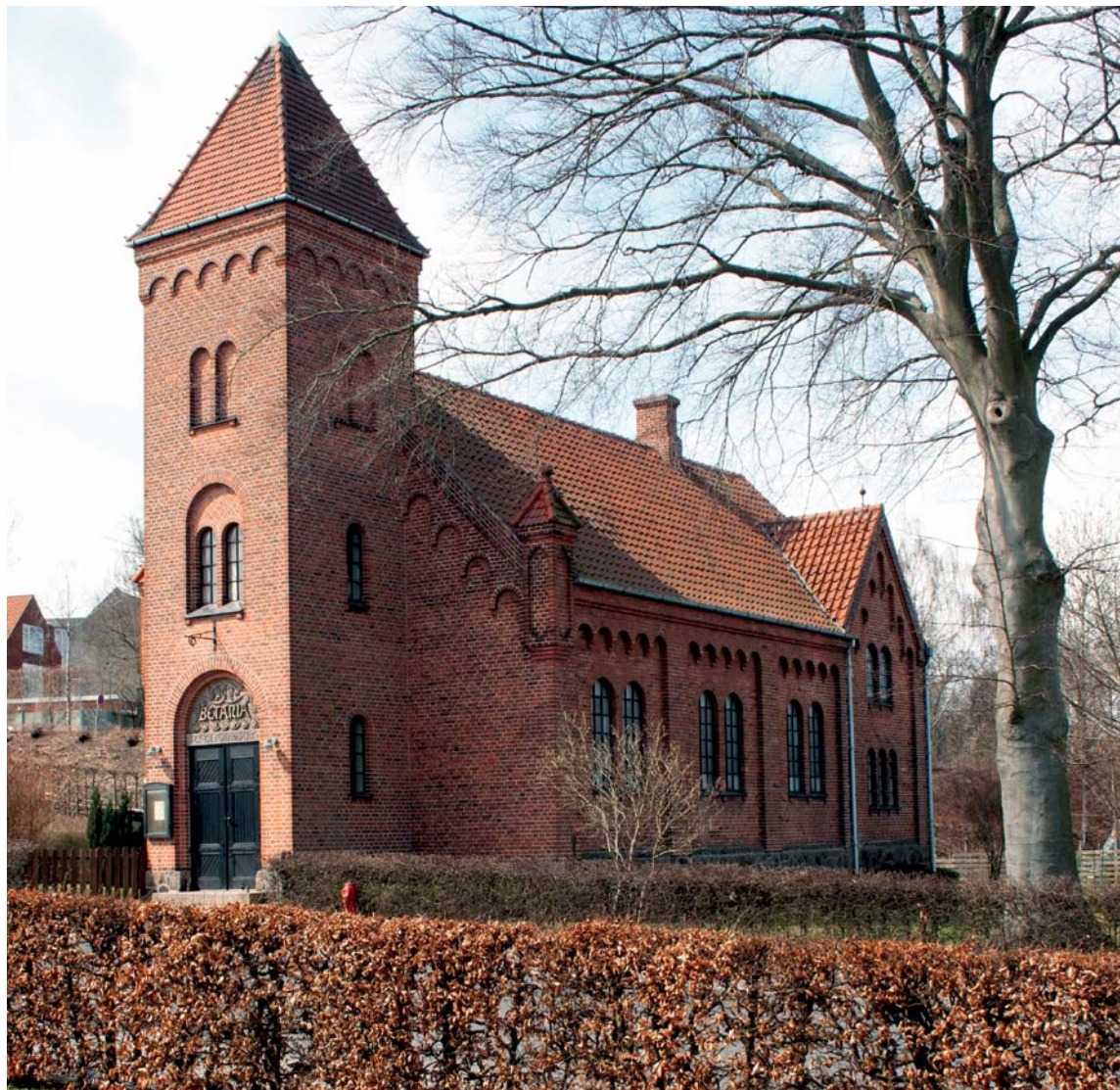
Fig. 1. Kirken set fra øst. Foto Mogens Vedsø 2013. – The church seen from the east.