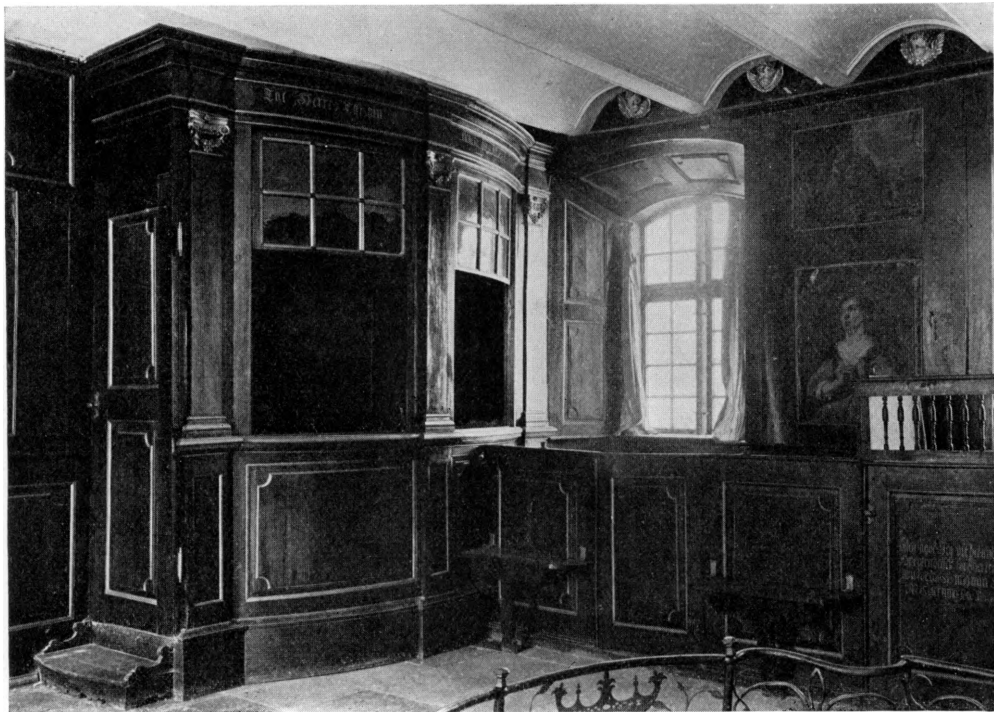
Fig. 1. Borreby. Herskabsstol (S. 952), i Kapellets Sydvesthjørne.