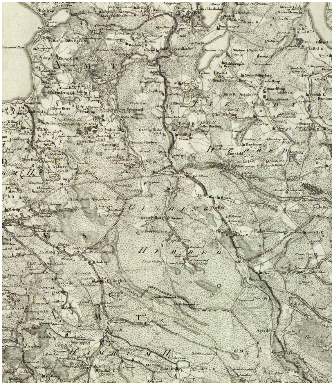
GINGING HERRED o. 1800. Herredet talte på daværende tidspunkt otte sognekirker, Estvad, Rønbjerg, Sahl, Ejsing, Ryde, Sevel, Haderup og Hodsager. Hertil er siden kommet et antal nyere kirker: Feldborg Kirke, opført 1890 som anneks til Haderup Kirke, Trandum, rejst 1891 som filial til Sevel Kirke, Grove Kirke, bygget 1893, Vinderup Kirke, opført 1905-06 som anneks til Sahl Kirke, og Herrup Kirke, bygget 1920-22, ligeledes som en filialkirke til Sevel Kirke. Udsnit af Videnskabernes Selskabs kort over Skivehus, Bøvling og Lundenæs amter 1800. 1:250.000. – Map of Ginding District c. 1800.