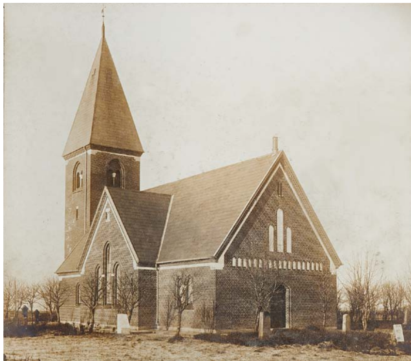
Fig. 5. Kirken set fra sydøst i begyndelsen af 1900-tallet. Efter ældre foto i kirken (sml. fig. 9). – Die Kirche aus Südosten zu Beginn des 20. Jahrhunderts. Nach einem älteren Foto in der Kirche.

Kirkens to døre i øst og vest er placeret midt for bygningens længdeakse. Over den fladbuede hovedindgang i vest er et spidsbuet spejl, hvorover stikket ledsages af en blomsterfrise under et binderskifte. Stikket over den fladbuede kordør suppleres af et kantstillet skifte og et løberskifte, begge af trekvartsten.