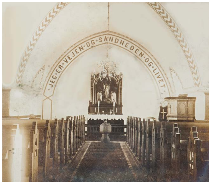
Fig. 6. Indre set mod øst i begyndelsen af 1900-tallet. Efter ældre foto i kirken (sml. fig. 9). Inneres gegen Osten, Anfang des 20. Jahrhunderts.

†Kalkmalede dekorationer (jf. fig. 6). Indtil 1954 fremstod vinduesbuer og hvælv med sparredekoration, og på korets østvæg læstes skriftstedet Joh. 14,6 med versaler.