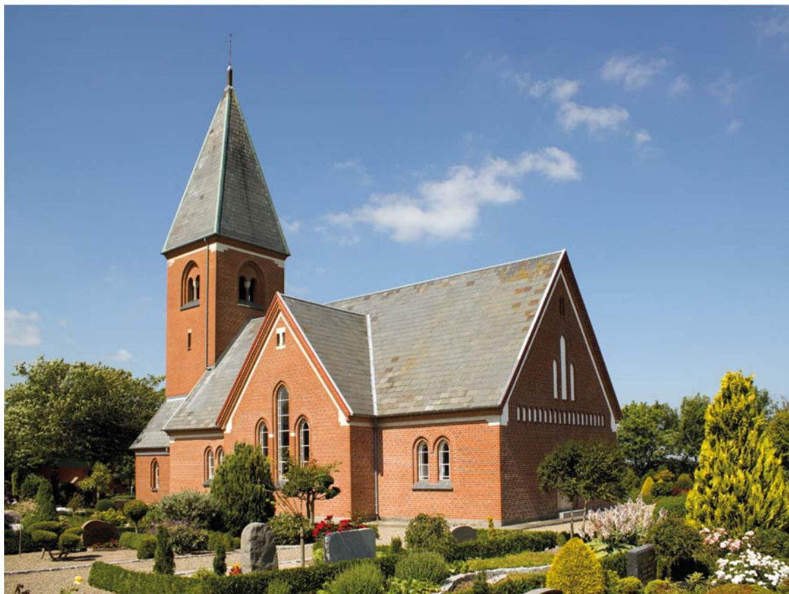
Fig. 2. Ydre set fra sydøst. – Äußeres aus Südosten.

Kirkegården har fire indgange: hovedindgangen mod vest, en fodgængerlåde i sydøsthjørnet, der ikke bruges længere, samt to nyere indgange mod nord. Førstnævnte består af en køreport flankeret af fodgængerlåger, der lukkes af galvaniserede jerntremmelåger. Lågerne er ophængt i murede og sadeltagsafdækkede piller, hvoraf de midterste og højeste er dekoreret med pudsede kors. Ganglågen mod sydøst svarer til hovedindgangens, mens indgangene mod nord lukkes af galvaniserede jerntremmelåger og stolper.