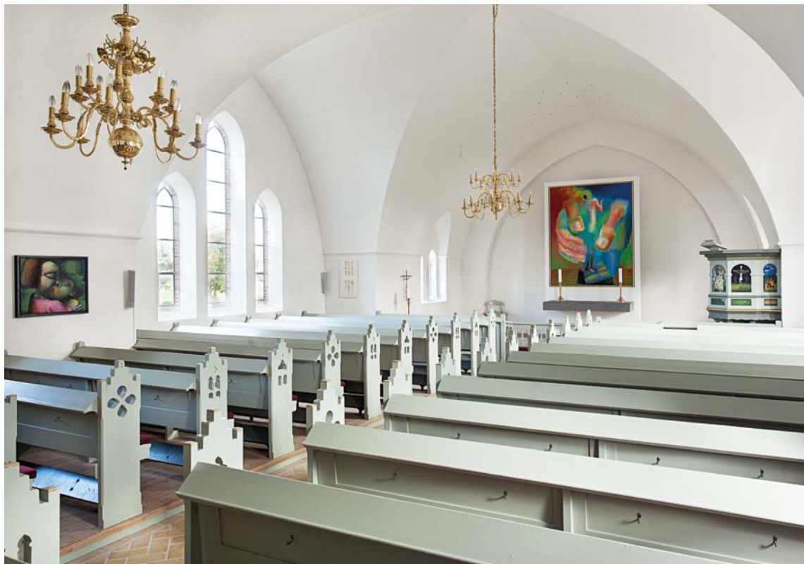
Fig. 7. Indre set mod nordøst. Foto Arnold Mikkelsen 2013. – Inneres gegen Nordosten.