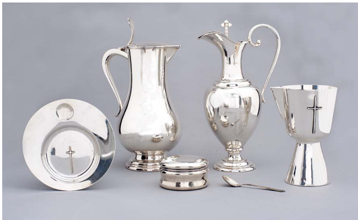
Fig. 8. Disk, 1956, alterkander nr. 1-2, hhv. o. 2000 og o. 1904, oblatæske, o. 1904, vinskummeske, 1913, og kalk 1958 (s. 2110-11). Foto Arnold Mikkelsen 2013. – Patene, 1956, Altarkannen Nr. 1-2, um 2000 bzw. um 1904, Oblatendose, um 1904, Löffel, 1913, und Kelch, 1958.

Prædikestolen (jf. fig. 6, 7) har femsided kurv, i hvis rundbuede storfelter og smalfelter er indsat akrylmalerier udført af Arne Haugen Sørensen 2012. De viser fra vest: 1) Ud drivelsen fra paradiset, 2) Jesu fødsel, 3) Nadveren, 4) Korsfæstelsen og 5) Den fortabte søn. 11 Bemalingen er lys grå med mørkegråt og forgyldning på vandrette profiler.