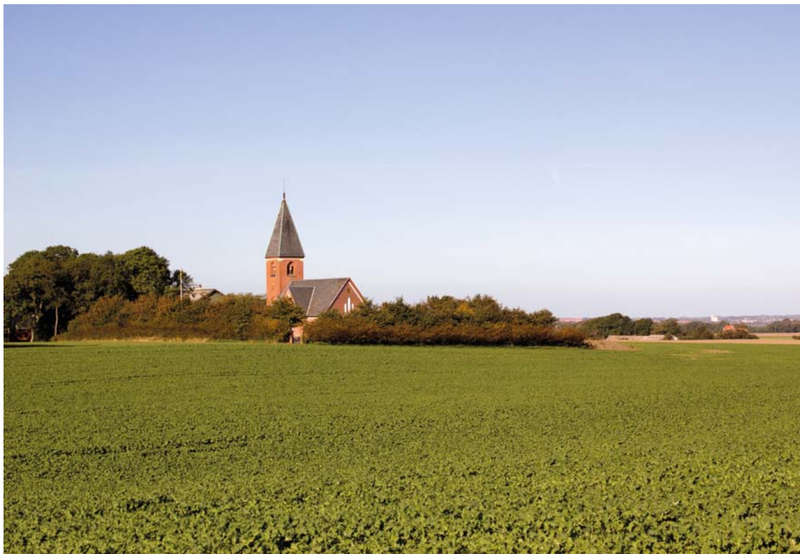
Fig. 1. Kirken i landskabet set fra sydøst. – Die Kirche in der Landschaft aus Südosten.