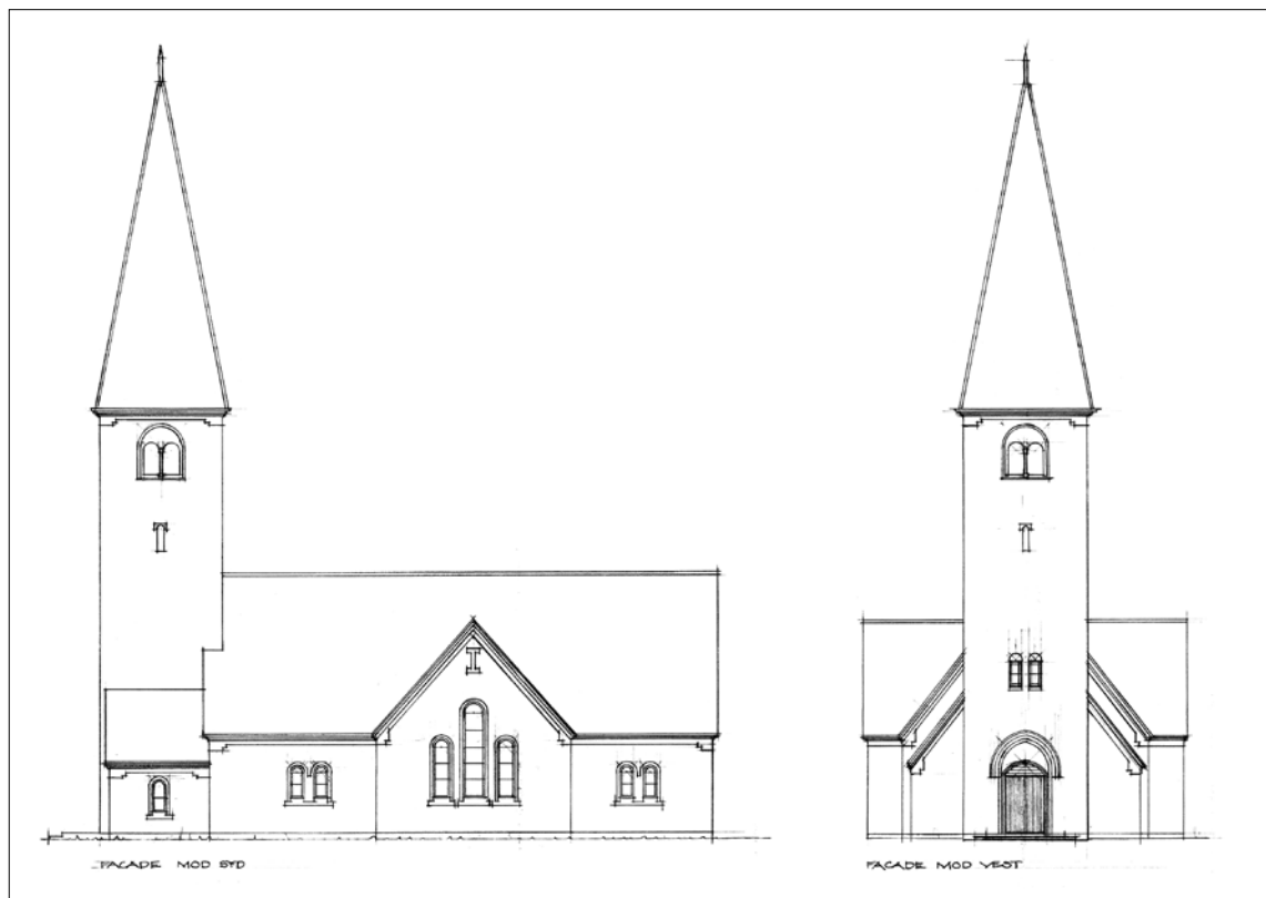
Fig. 3. Facader. 1:300. Målt af H. Møller Nielsen 1979, suppleret og tegnet af Ib Lydholm og Asger Thomsen 1995. – Fassaden.

til den profilerede gesims bestående af et rundet og to rektantede led. Korgavlen er i gavlfodshøjde dekoreret med et bånd af rektangulære og trappestikafdækkede blændinger med hvidkalket bund, og herover er tre spidsbuede højblændin-