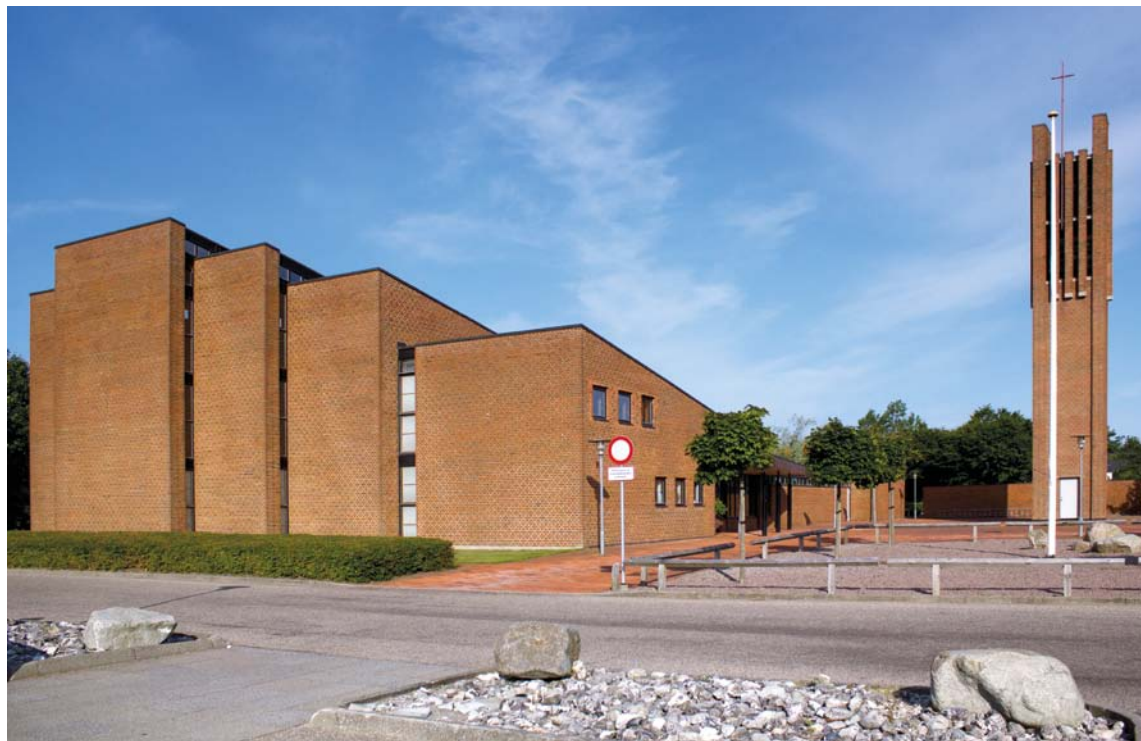
Fig. 1. Ydre set fra nordøst. – Äußeres aus Nordosten.