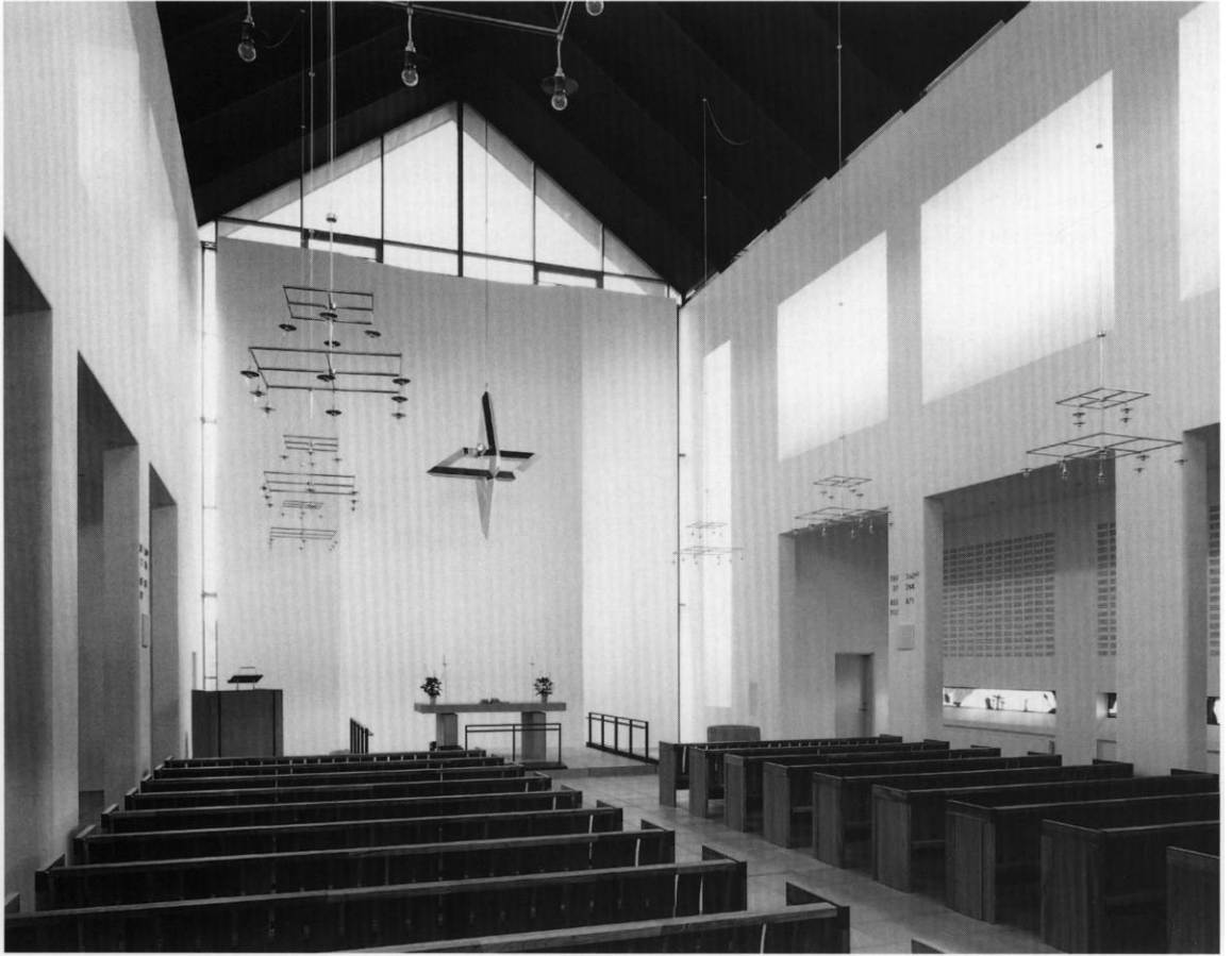
Fig. 3. Indre set mod øst. HW fot. 1999. - Kircheninneres gegen Osten.

Inventaret er samtidigt med bygningen, bortset fra altersølvet og orglet, der er fulgt med fra vandrekirken, samt klokken, som er støbt 1920 som genforeningsklokke til Herning kirke.