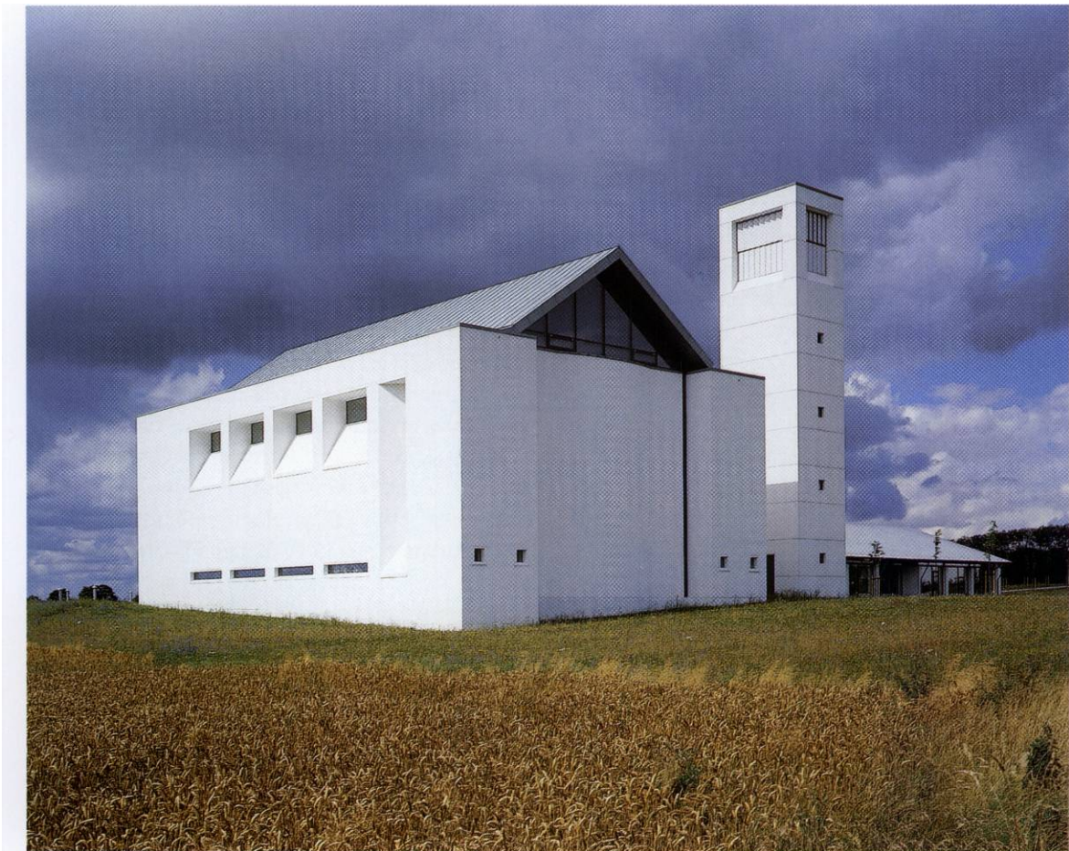
Fig. 1. Kirken set fra sydøst. HW fot. 1999. - Südostansicht der Kirche.