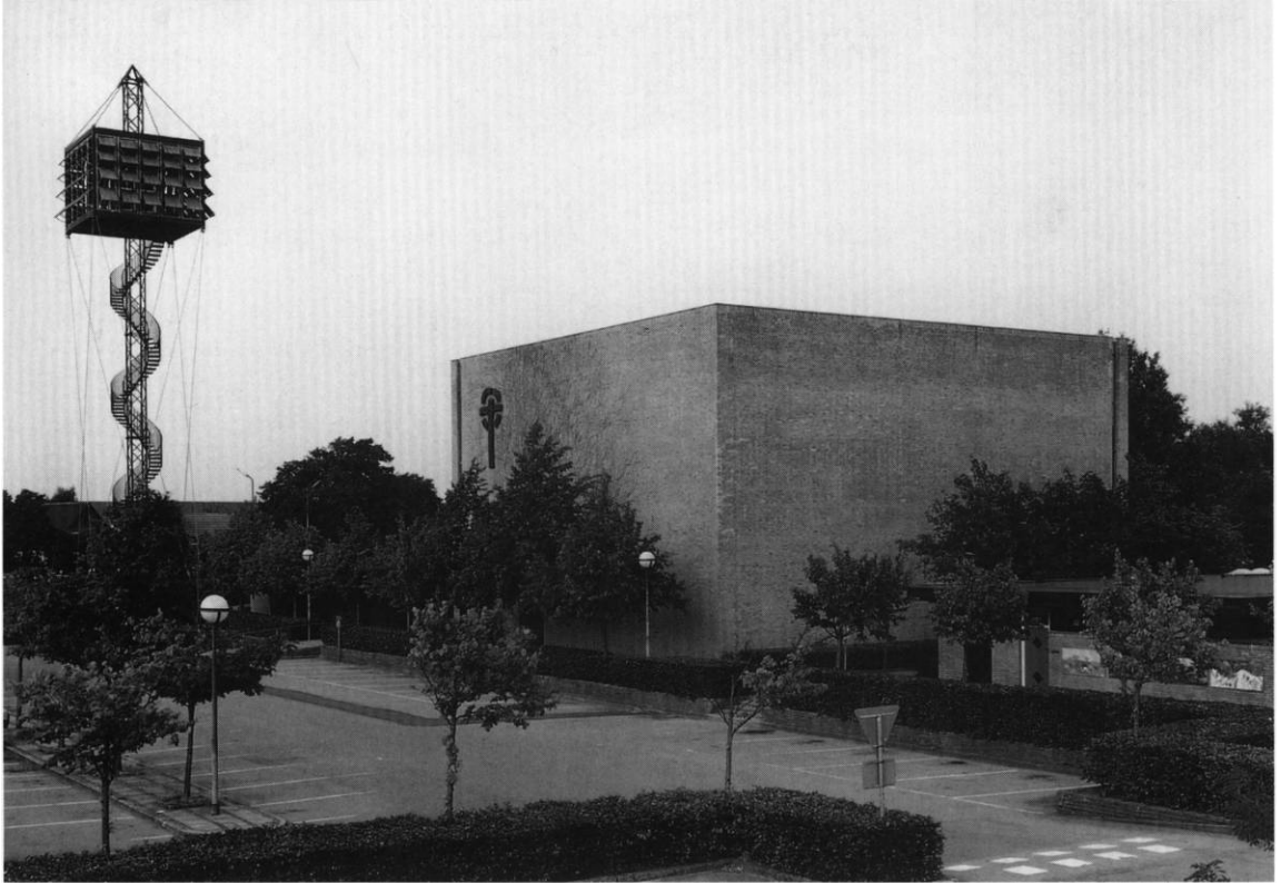
Fig. 2. Kirken set fra sydvest med fritstående klokketårn tv. HW fot. 1997. - Südwestansicht der Kirche mit freistehendem Glockenturm.

Kirkens øst- og vestfacade smykkes siden 1986 af to identiske kors af støbejern, 3,5x2 m, udformet som cirkelkors. De er tegnet af billedhuggeren Erik Heide og udført af Morsø Jernstøberi.