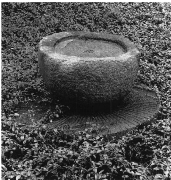
Fig. 5. Vievandskar(?), af granit, muligvis romansk (s. 328). - Weihwasserbecken(?) aus Granit, möglicherweise romanisch.

fra hærskarers Herre«. Klokkespillet, hvis største klokker tjener som ringeklokker, kan betjenes både manuelt og automatisk.