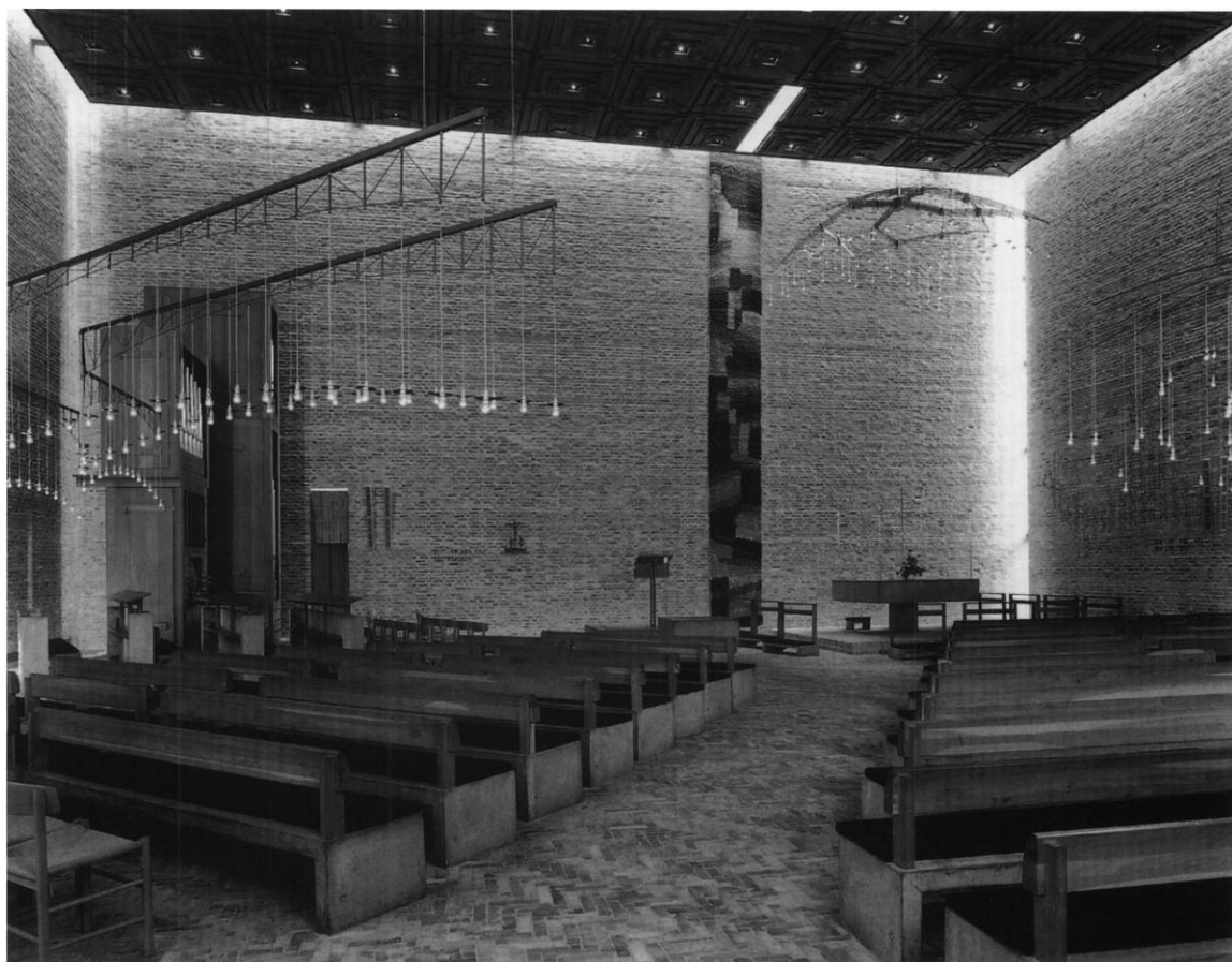
Fig. 3. Indre set mod sydøst. HW fot. 1997. - Kircheninneres gegen Südosten.

Beplantningen skyldes landskabsarkitekt C. Walbjørn Christensen. I den indre gård, der nær kirken indeholder et regnvandsbassin med afløb fra kirkens tag, er plantet birk i et bunddække af vinca, omkring de ydre mure bøg, der holdes som klippede hække.