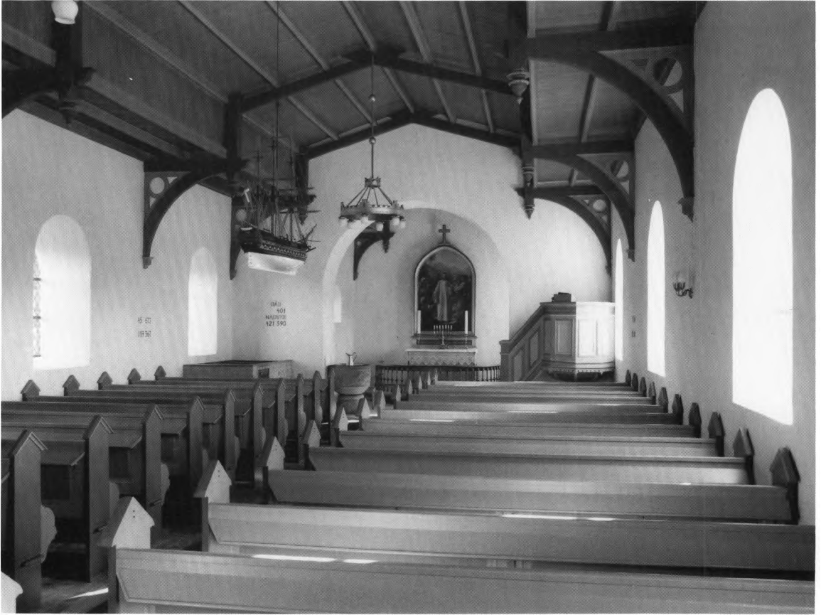
Fig. 4. Indre set mod øst. NE fot. 1986. – Innenansicht nach Osten.

Alterbordet , fra 1884, er af træ, anbragt et stykke fra væggen og malet i gyldent med rødbrune kanter. Alterklæde , 1943, lyst gult med broderet skriveskrift langs overkanten: »Til minde om lærer J. J. Kring og hustru skænket af deres børn til Jordrup kirke i anledning af fars hundrede års fødselsdag den 25. juli 1943«. † Alterklæde , sikkert fra 1800'ernes slutning, af rødt fløjel med guldkors, jfr. fig. 11. 9