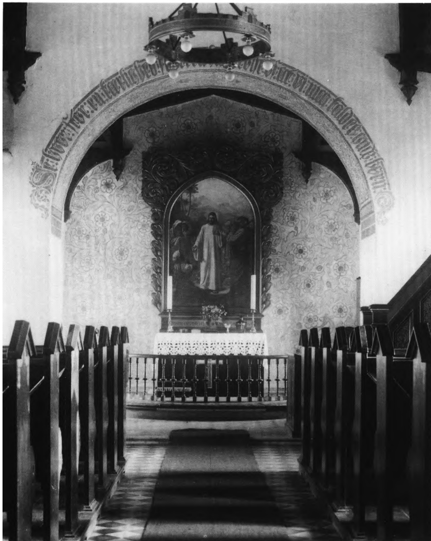
Fig. 11. Interiør o. 1920, med ÷kalkmalet dekoration (s. 2449). – Kirkeninneres um 1920.