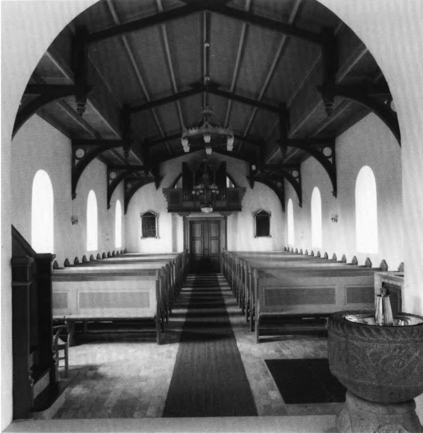
Fig. 5. Indre set mod vest. NE fot. 1986. – Innenansicht nach Westen.

mentlig fornyet 1854. 19 20,5 cm høj. Den seks-tungede fod har lodret standkant og afsæt yderst, og drives kegleformet op i det sekskantede skaft. På en af tungerne er graveret »C. W.«, og på to er der våbener for henholdsvis Schwane-wede og Dyre, under initialerne H(erman) F(rantz) S(chwane)W(ede) og (dennes hustru) C(hristence) D(yre). Herimellem, fordelt på tungerne, står årstallet 16/80 (fig. 9). Mellem samtlige tunger er desuden graveret franske lil-ler. Under bunden et udvisket stempel (fig. 12). Ny indsats, ifølge stempel udført af Knud Ei-bye, Odense.