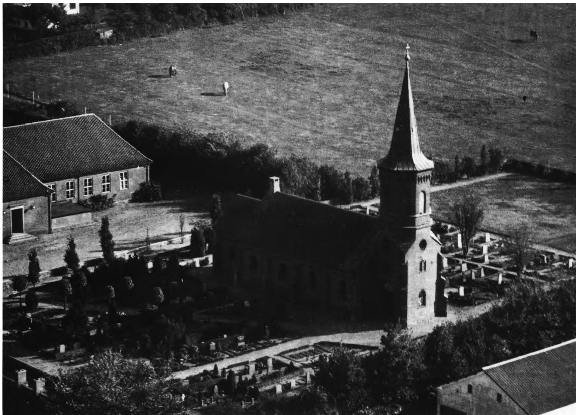
Fig. 1. Luftfoto af kirken og kirkegården set fra nordvest. Ålborg Luftfoto o. 1950. Det kgl. Bibliotek. – Luftaufnahme von Kirche und Friedhof. Nordwestansicht.