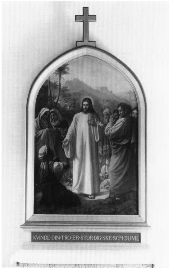
Fig. 6. Altermaleri, udført af P. N. Møller 1884 og forestillende Kristus og den kananæiske kvinde (s. 2450). NE fot. 1991. – Altargemälde, 1884 von P. N. Møller. Eine Darstellung von Christus und der kananäischen Frau.

gonalt anbragte arme. 2) 1900'ernes første halvdel, 37,5 cm høj.