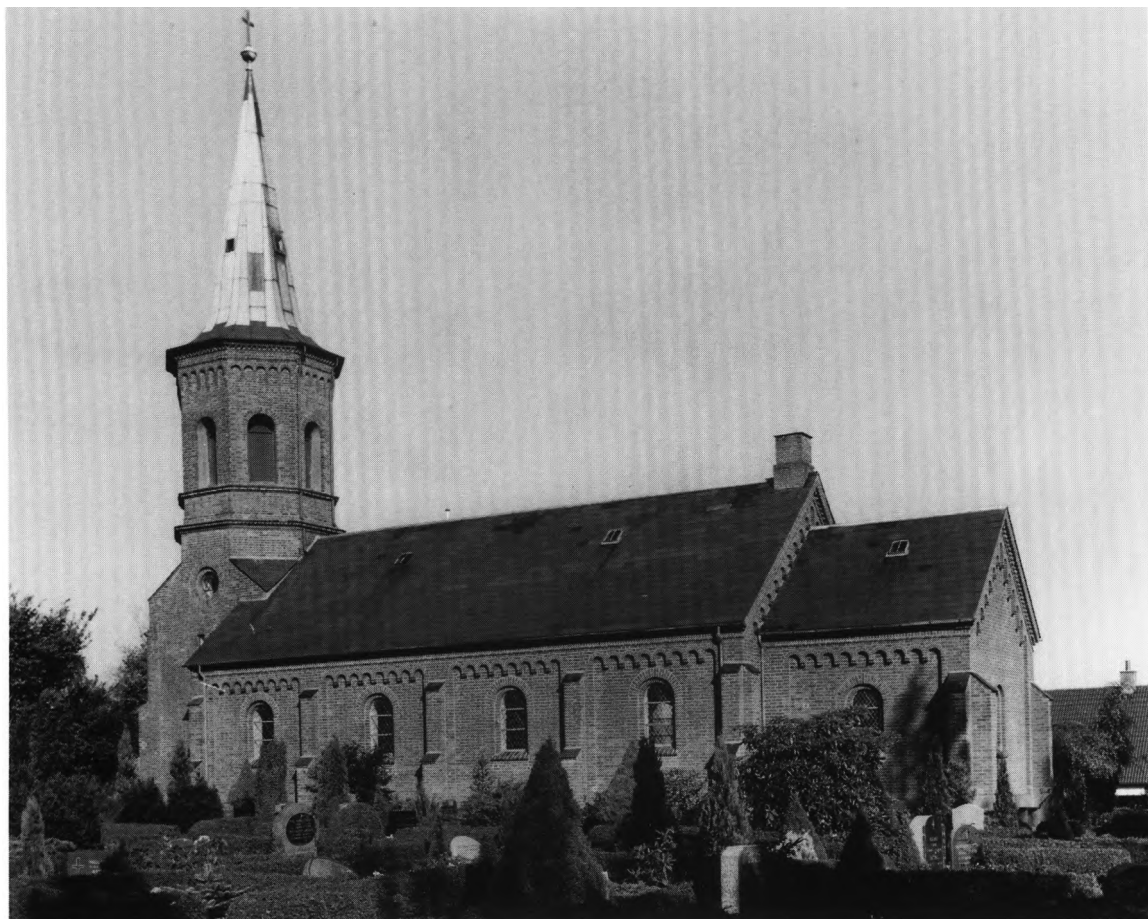
Fig. 3. Kirken, opført 1884, set fra sydøst. NE fot. 1986. – Südostansicht der 1884 errichteten Kirche.

Der er adgang til kirken gennem en rundbuet dør i nordsiden af tårnets underetage, der tjener som våbenhus. I det indre står kirken med hvidtede vægge. Kor og skib forbindes af en rund korbue. Loftet er en såkaldt åben tagstol, et »basilikalt« træløft med synligt tømmer, hvilende på kraftige konsoller. 17 Koret har bevaret sin oprindelige gulvbelægning af ottekantede, lysegrå fliser; i skibets gulv er 1955 9 lagt gule mursten på fladen.