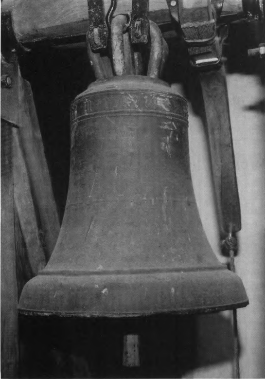
Fig. 10. Klokke nr. 1, støbt 1407, ifølge den latinske indskrift til »Longstogh« kirke (s. 2454). NE fot. 1986. – Glocke Nr. 1, gegossen 1407. Laut lateinischer Inschrift für die »Longstogh« Kirche.

To lysekroner , ophængt 1918, udført af tømrermester J. Bjerrisgaard. Kronerne, af forgyldt træ, er sammensat af to krenelerede ringe,