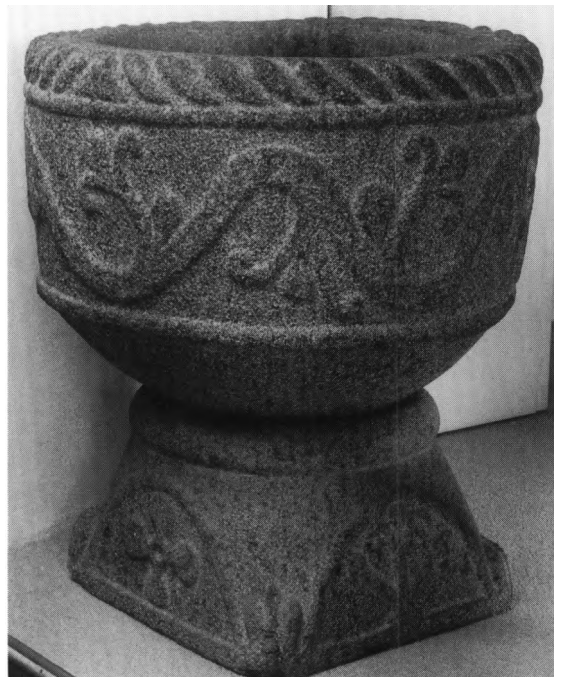
Fig. 7. Romansk døbefont af granit (s. 2452). – Romanische Granittaufe.

Prædikestol (jfr. fig. 4), fra kirkens opførelsestid, bestående af en firsidet kurv med underbaldakin på en ottesidet støttestolpe og en sam-