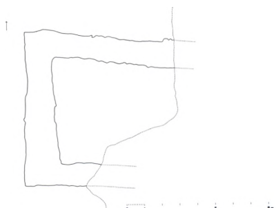
Fig. 1. Udgravningsplan af kirkens vestende, 1:300. Målt af Knud J. Krogh 1966. – Ausgrabungsplan für den Westteil der Kirche, 1966.

Der er al grund til at tro, at de romanske sokkelkvadre under Vorbasse kirkes vestforlængelse (jfr. s. 2302) er hentet fra tomten i Fitting, idet en hjørnesokkelkvader (fig. 2) med samme rundstav og hjørneknop som i Vorbasse kirkes vestparti tidligere lå som trappesten i Fitting. 10 Sokkelkvadre med en lignende, ret kraftig rundstav findes også i Lindknud og Brørup kirke (Malt hrd.), men her er kvadrenes højde en anden. – Ud fra de foreliggende oplysninger og iagttagelser synes det således at kunne konkludere