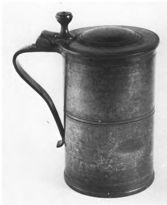
Fig. 2-3. 2. Alterkalk, 1845 (s. 1406), med uidentificerede stempler (fig. 4). Kalken har tilhørt den gamle ÷kirke i Oksby (jfr. s. 1398). 3. Dåbskande af tin (s. 1406), anskaffet 1862 til Oksby ÷kirke (jfr. s. 1399). — 2. Abendmahlskelch, 1845, mit unidentifizierten Stempeln. Der Kelch gehörte der alten ÷Kirche von Oksby. 3. Taufkanne aus Zinn, angeschafft 1862 für die ÷Kirche von Oksby.

Kalken (fig. 2) er 20 cm høj, foden konisk med graveret blad bort langs standkanten og en bred krave med tunget kant og indprikket mønster ved overgangen til cylinderskaftet. Knoppen er linseformet, bægeret halvkugleformet med nyere hældetud. På fodpladens side to ukendte stempler (fig. 4), et »H« eller »IH« samt et mærke, der måske skal læses »BLu«. Mærkerne er gentaget på knoppen og øvre skaftled samt på undersiden af disken , tvnm. 12 cm, der på fanen har et enkelt indgraveret Jesumonogram og (modstillet) et kors (jfr. s. 1367). Oblatæske