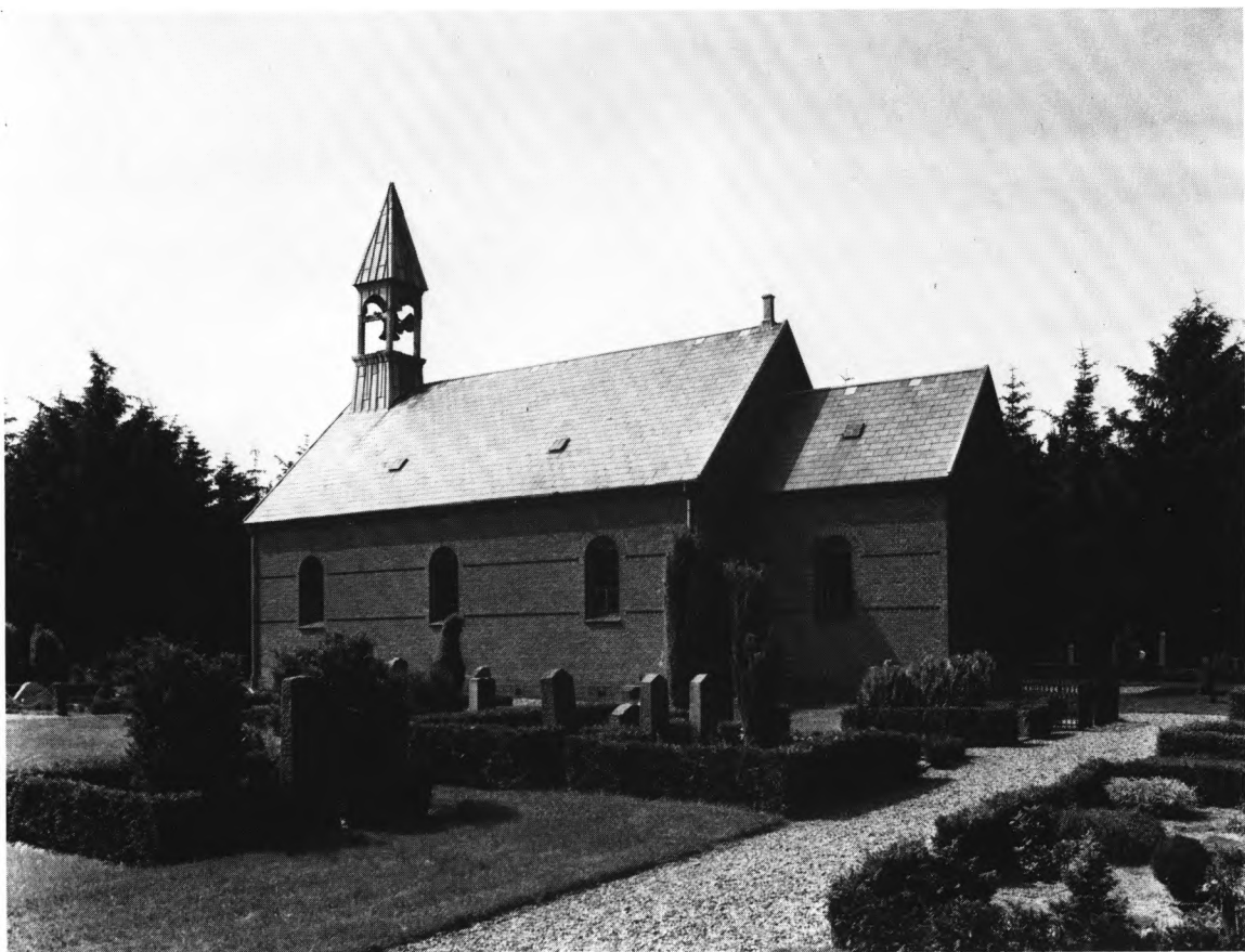
Fig. 1. Mosevrå kirke set fra sydøst. — Die Kirche von Mosevrå, von Südosten gesehen.