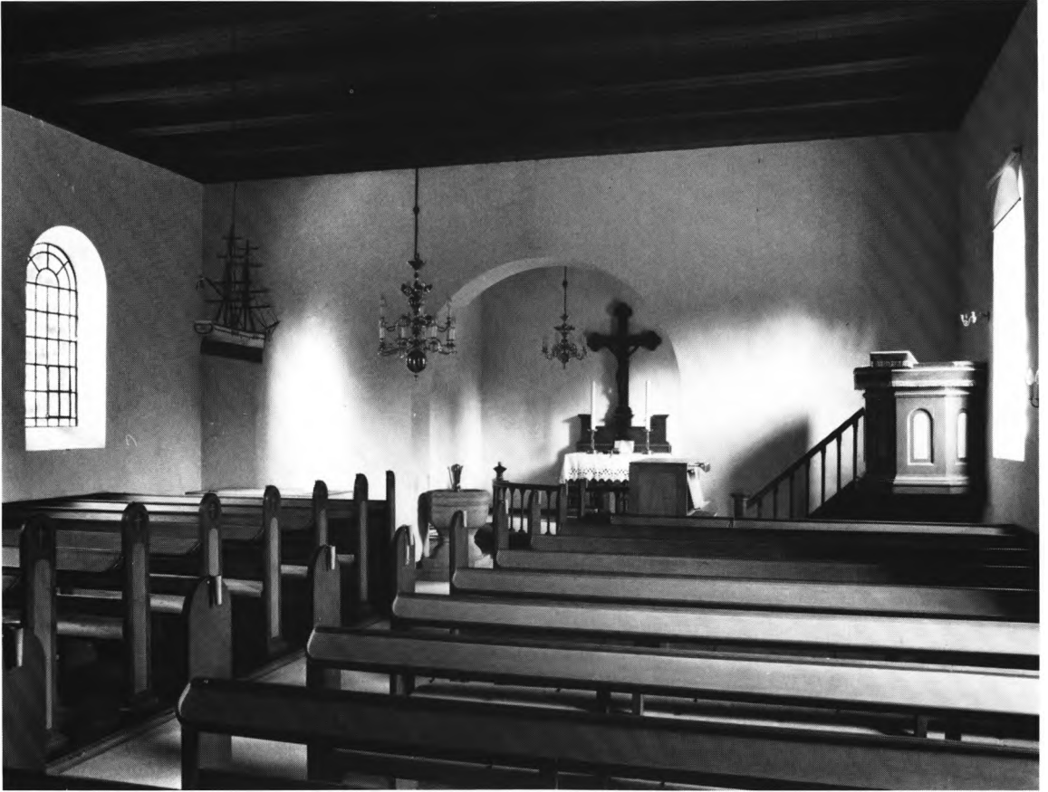
Fig. 5. Mosevrå kirke. Indre set mod øst. NE fot. 1981. — Die Kirche von Mosevrå. Interieur gegen Osten gesehen.

Petersen, Grærup, og skænket af gårdejer Villads Villadsen og hustru, Vejers. 5 Klokken er fra 1891 af »støbestål«, tvm. 76 cm, med reliefversalene: »Geg. in Bochum 1891«.