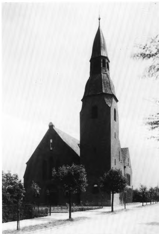
Fig. 42. Zions kirke, set fra vest. — Zionskirche, von Westen gesehen.

Koret, der åbner sig mod skibet i hele sin bredde, er hævet syv trin over skibets gulv for at give plads til et underliggende sakristi. Mellem sideskib og tårn er et lille dåbsværelse; fonten, en granitkumme i jugendstil, står dog nu i koret. Hovedskibet dækkes af et højt spændt tøndehvælv, hvilende på svære gjordbuer; sideskibet har fladt træloft.