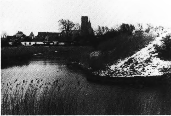
Fig. 23. Riberhus slotsbanke med sokkelkvadre fra byens \dagger kirker genanvendt i rondellerne (s. 859). EN fot. 1984. — Schloßberg von Riberhus mit Sockelquadern aus den Kirchen der Stadt, hier wiederverwendet in den Rondellen.

står lodret og således ikke er trykket ud af deres oprindelige plads.