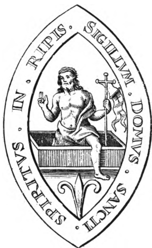
Fig. 21. Helligåndshuset. Seglaftryk fra 1480 (s. 850), efter Terpager 1736, s. 523. — Heiliggeisthaus. Siegelabdruck aus dem Jahr 1480.

Beliggenhed. Helligåndshuset lå vest for johanniterklostret, på vestsiden af en gade, hvis forløb svarede nogenlunde til den nuværende S. Laurentiigade (fig. 2). Kirken lå mod nord i bygningskomplekset, kirkegården mod øst ud til gaden. 145 På hjørnegrunden til S. Klemensgade og S. Laurentiigade fandtes 1934 rester af en munkestensmur på kampestenssyld, ca. 8 m lang, 80 cm bred og 45-55 cm høj, muligvis en rest af Helligåndsgården. 146