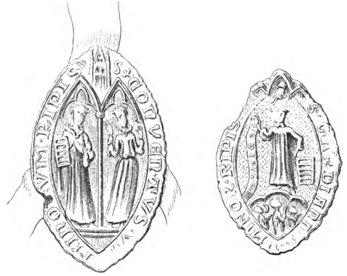
Fig. 18-19. Franciskanerklostret. Aftryk af segl fra 1200'erne (s. 847). 18. Konventsegl. 19. Guardein-segl. Efter H. Petersen: Danske gejstlige Sigiller fra Middelalderen, 1886. — Franziskanerkloster. Siegelabdrucke aus dem 13. Jh. 18. Konventsiegel. 19. Guardein-segel.

Fra klostret kendes fire seglafrø . Konventseglet (fig. 18), der er bevaret på breve fra 1332 og 1465, går antagelig tilbage til klostrets første tid, den omløbende majuskelindskrift lyder: »(igillum) conventus [fratrum] minorum ripis« (konventsegl for minoriterbrødrene i Ribe). S. Laurentius med risten og S. Franciskus med oprakte hænder står i hver sin spidsbuede arkade.