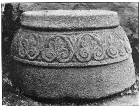
Fig. 2. Vordingborg Slotskirke. Søjlefod af Granit.

Slotskapellet, der i Størrelse noget overgik en almindelig Landsbykirke, har været en romansk Murstensbygning fra Slutningen af 1100'erne, med Apsis, Kor og Skib. Korets Nordmur har bevaret en Rest af den syv Skifter høje Munkestenssokkel, med ret rige Formstensprofiler: Skraakant, Rundstav og øverst Hulstav (Fig. 3), Stenene har delvis været riffelhugne. I Skibet er Vestmurens Fundament sværere end Langmurenes, hvis Vestender dog kun var mangelfuldt bevarede. Nær Vestenden staar der midt i Rummet Halvparten af et cirkelrunt Fundament, og svarende hertil er der ved Sydmuren bevaret et Vægpilefundament. Sikkert med Rette har J. B. Løffler formodet, at Borgkirken fra første Færd har haft et Vesttaarn, beslægtet med Fjennes-