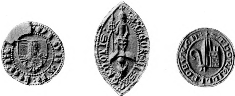
Fig. 4. Vordingborg Slotskirke. Aftryk af Signeter, fra 1300'erne, fundne i Grave.

pillen, og at det indre har været delt i to Hvælvfag. Ved Sydkapellets Sydøsthjørne fandtes endvidere Rester af en lille, endnu yngre Tilbygning , som over Sylden har bevaret enkelte Skifter af Munkestensmure i ret uregelmæssig Skiftegang, og hvori der i senere Tider er indrettet en Kælder med undermurede Vægge af Munkestensbrokker; der synes at have været Nedgang fra Nord. Denne Tilbygnings Bestemmelse er usikker; Resens fejlfulde Billede anbringer Gaasetaarnet omtrent paa dens Plads og et mindre Taarn, »Gammel Klokketaarn«, i Ringmuren paa Gaasetaarnets Sted, og det er muligt, at Tegneren har forbyttet to Taarne, men de bevarede Fundamenter er skæve og saa spinkle, at de højst kan have baaret en meget lille og let Taarnbygning.