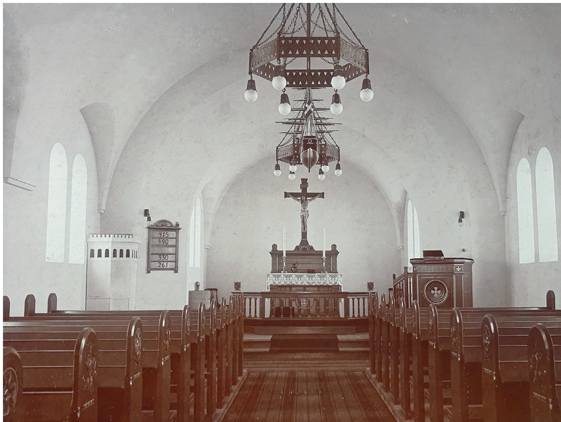
Fig. 5. Indre set mod øst o. 1914. – Interior looking east c. 1914.

skibet via en rektantet dør, der svarer til indgangsdøren i vest. Et præsteværelse er indrettet i det søndre rum, mens opgangen til de øvre etager er henlagt til en trappe i den nordre sidebygning.