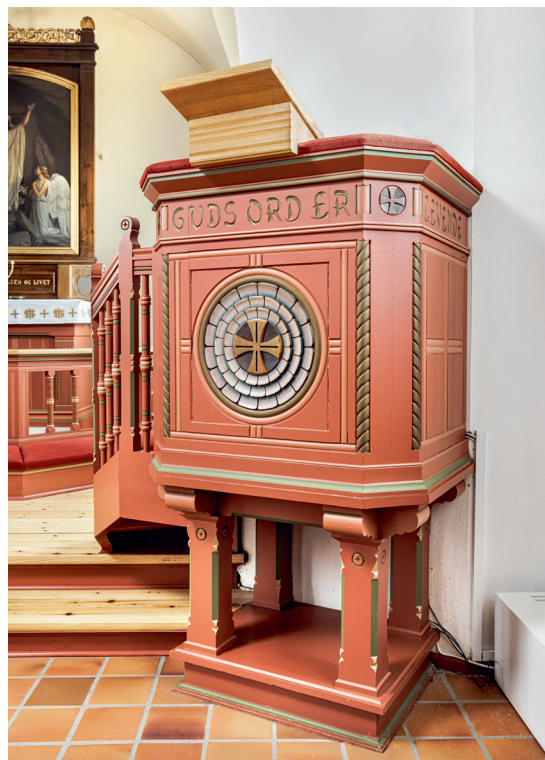
Fig. 11. Prædikestol, 1914 (s. 6537). – Pulpit, 1914.

Udvendige dørfloje . 1) I tårnets vestfacade en tofløjet, rektangulær fyldingsdør i blank eg, med sproset vinduesparti foroven. 2) Præstedør i korets sydside, en enkeltfløjet fyldingsdør med rød