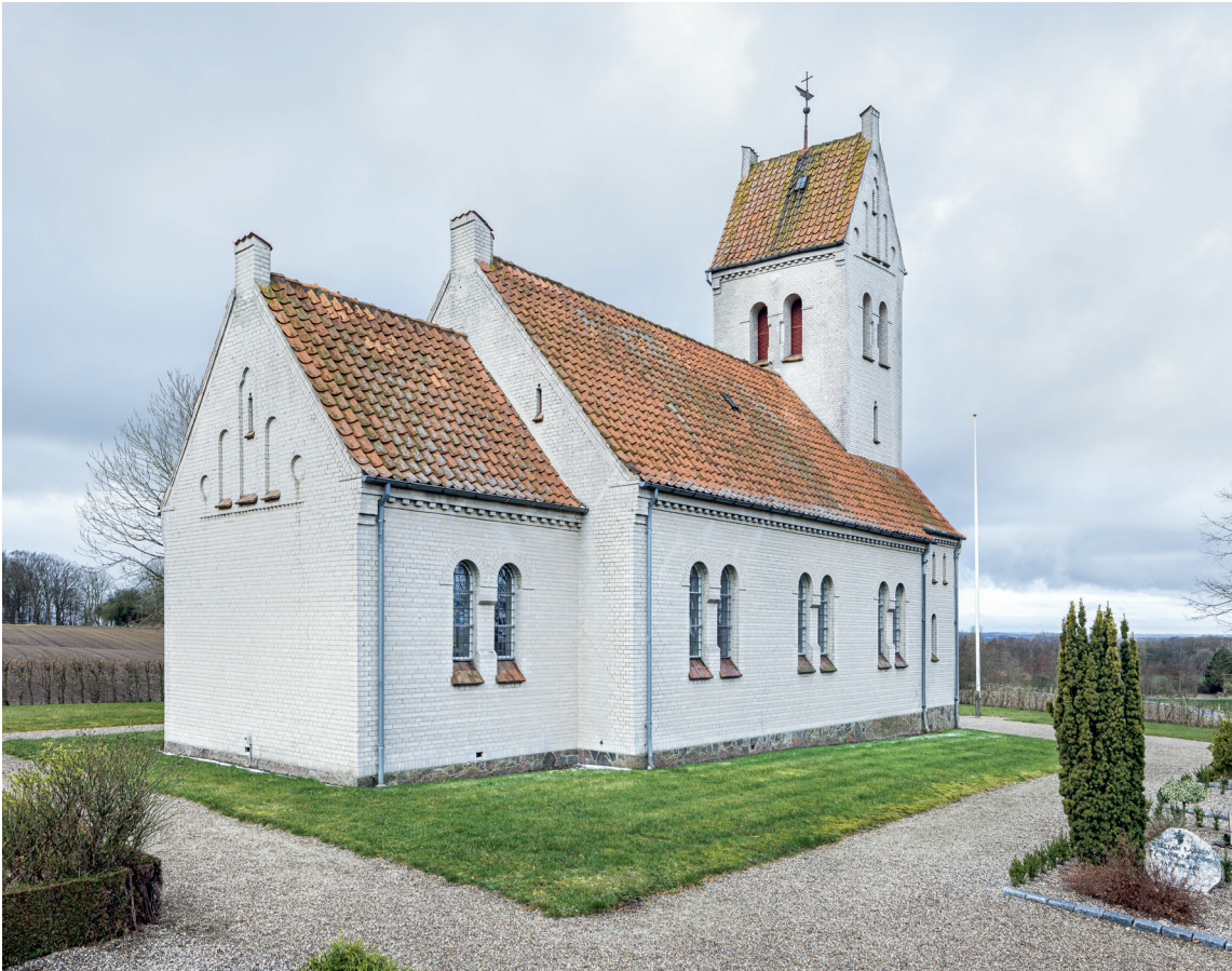
Fig. 1. Kirken set fra nordøst. – The church seen from the north east.