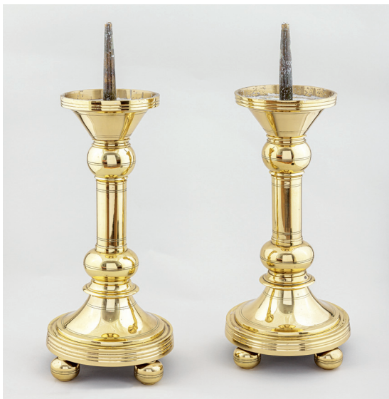
Fig. 14. Alterstager fra 1914 (s. 6536). – Altar candlesticks from 1914.