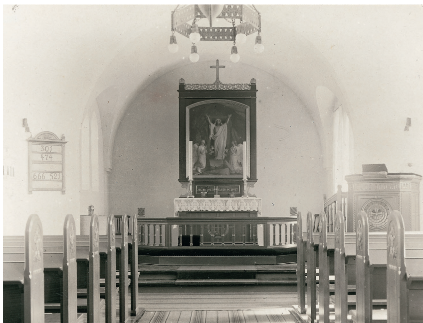
Fig. 8. Indre set mod øst efter 1920. Foto i NM. – Interior looking east after 1920.

Oblatæske , fra Den Kongelige Porcelænsfabrik, København. Cylindrisk, 14,5 cm i diameter og 6 cm høj, af sortmalet porcelæn med forgyldte kanter og forgyldt kors på låget; fabriksmærke under bunden.