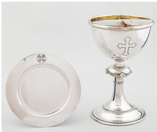
Fig. 10. Altersæt, bestående af kalk 1909 og disk 1914, udført af K. C. Hermann, København (s. 6535). Foto Arnold Mikkelsen 2022. – Communion set consisting of a chalice from 1909 and the paten from 1914, made by K. C. Hermann, Copenhagen.

Dåbskande (jf. fig. 12), af messing, 27 cm høj. Kanden, hvortil der findes sidestykker i bl.a. Padesø (s. 6100), har rund fod, omvendt konisk korpus med cirkelkors i relief og knækket hank. Grebet på det kuplede låg er udført som et cirkelkors.