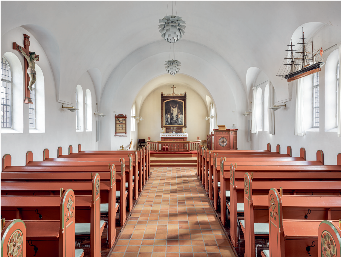
Fig. 6. Indre set mod øst. Foto Arnold Mikkelsen 2022. – Interior looking east.

ryg- og sideåse, førstnævnte på kongestolper. Tagbeklædningen består overalt af røde vingetagsten.