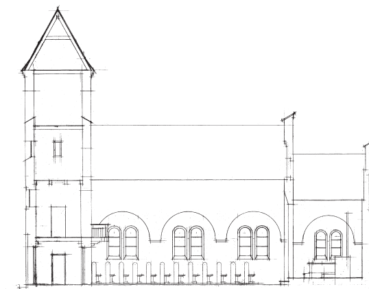
Fig. 4. Længdesnit set mod nord. 1:300. Målt og tegnet af Ebbe Lehn Petersen 1988. I NM. – Longitudinal section looking north.

kalkstensplader, består yderst af et helstensstik og herpå to binderskifter hvorimellem en rudefrise – et motiv med forlæg i den romanske Tikøb Kirke (DK Frborg 686). Det støbte tympanonfelt, der hviler på en granitbjælke, beriges af et korsrelief med flankerende alfa- og omegategn, der dog mod sædvane er ombyttet; herunder årstallet 1914.