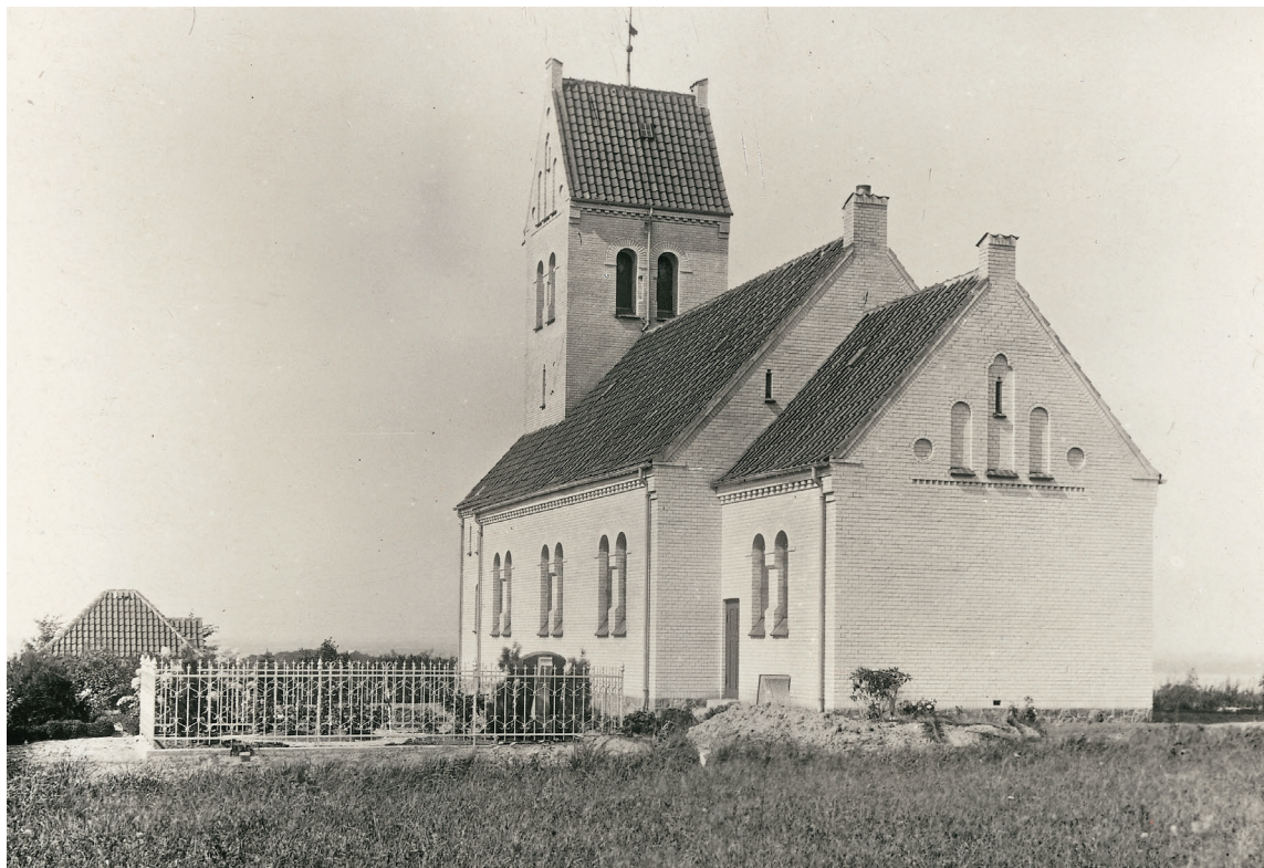
Fig. 2. Kirken set fra sydøst o. 1920. Foto i NM. – The church seen from the south east c. 1920.

Kirken er opført nær toppen af en 71 meter høj bakke og ligger i åbent land med vid udsigt over Lillebælt.