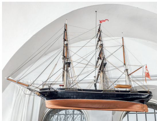
Fig. 13. Kirkeskibet »Haabet«, 1914, bygget af buntmager Osvald Clausen, Nyborg (s. 6539). – The church ship »Haabet«, 1914, built by furrier Osvald Clausen, Nyborg.

i blankt træ med sort kursivskrift og datering »anno 1997«. Ophængt på sydvæggen. 16