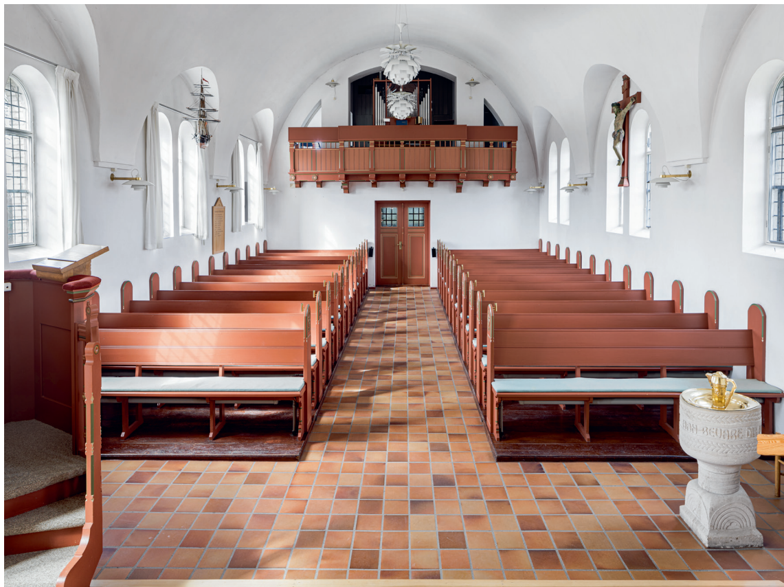
Fig. 12. Indre set mod vest. 2022. – Interior looking west.

Præsterækketavle , 1997, rektangulær med glat profilramme og diminutiv trekantgavl. Den står