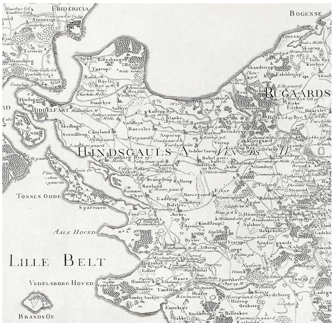
VENDS HERRED i 1783. Dengang talte herredet 18 sognekirker: Kauslunde, Vejlbj, Asperup, Rørslev, Brendrup, Fjeldsted, Harndrup, Gelsted, Rørup, Balslev, Ejby, Nørre Åby, Indslev, Gamborg, Udby, Føns, Ørslev og Husby. I sidstnævnte sogn findes også Wedellsborg Slotskapel. Den middelalderlige sognekirke i †Viby blev nedrevet efter 1555. Ejby Kirke blev revet ned og genopført 1842. I nyere tid er der opført filialkirker i Strib (1911) og Røjleskov (1914). Udsnit af Videnskabernes Selskabs kort over Nordfyn. 1:180.000. Tegnet af Caspar Wessel 1780 og stukket af Claude Alexandre Guittair (Guiter) 1783. — Map of Vends District 1783.