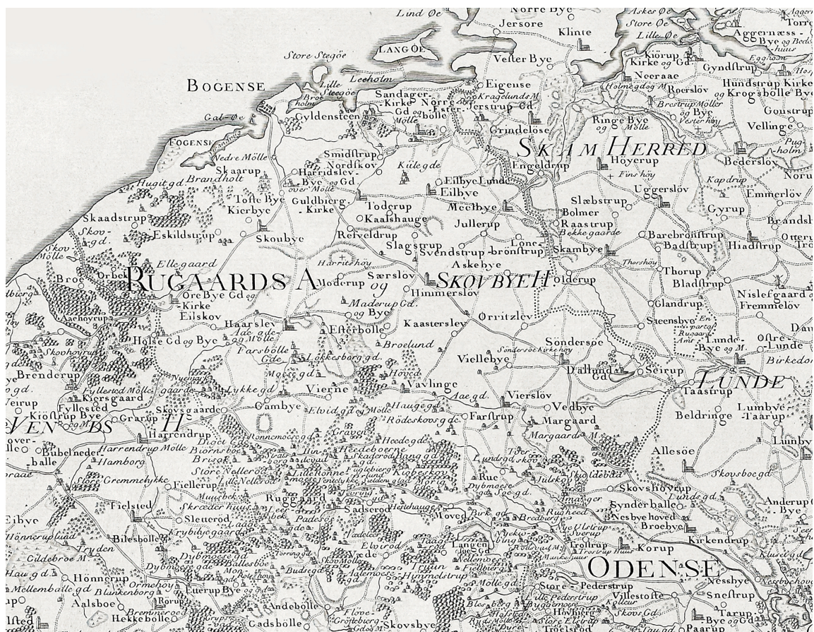
SKOVBY HERRED i 1783. Det talte dengang 11 sognekirker: Skovby, Ore, Guldbjerg, Nørre Sandager, Ejlbj, Melby, Særslev, Hørslev, Veflinge, Vigerslev og Søndersø. I nyere tid er der opført filialkirker i Langesø Skovkapel (1870) og Padesø (1881). Udsnit af Videnskabernes Selskabs kort over Nordfyn. 1:180.000. Tegnet af Caspar Wessel 1780 og stukket af Claude Alexandre Guittair (Guitar) 1783. – Map of Skovby district 1783.