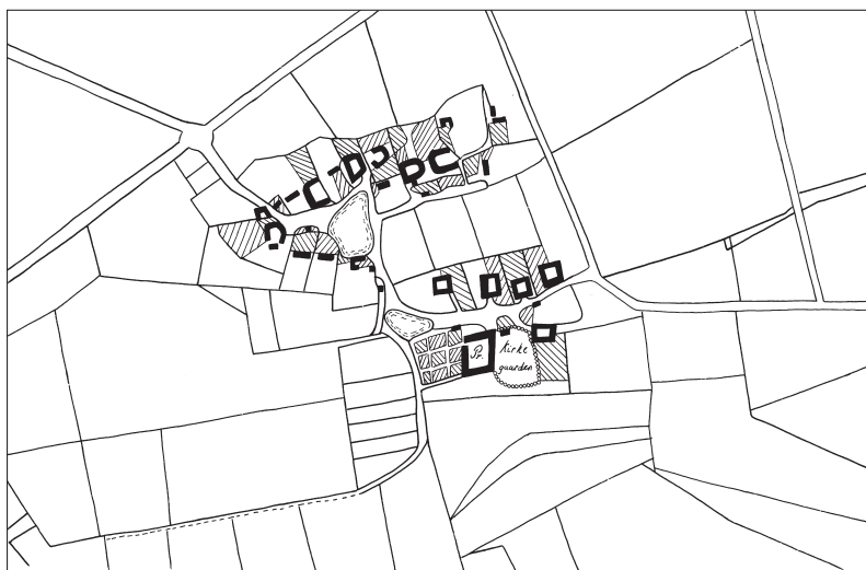
Fig. 1. Matrikelkort. 1:10.000. Målt af J. J. Bærner 1783-84. Tegnet af Freerk Oldenburger 2019. – Cadastral map.