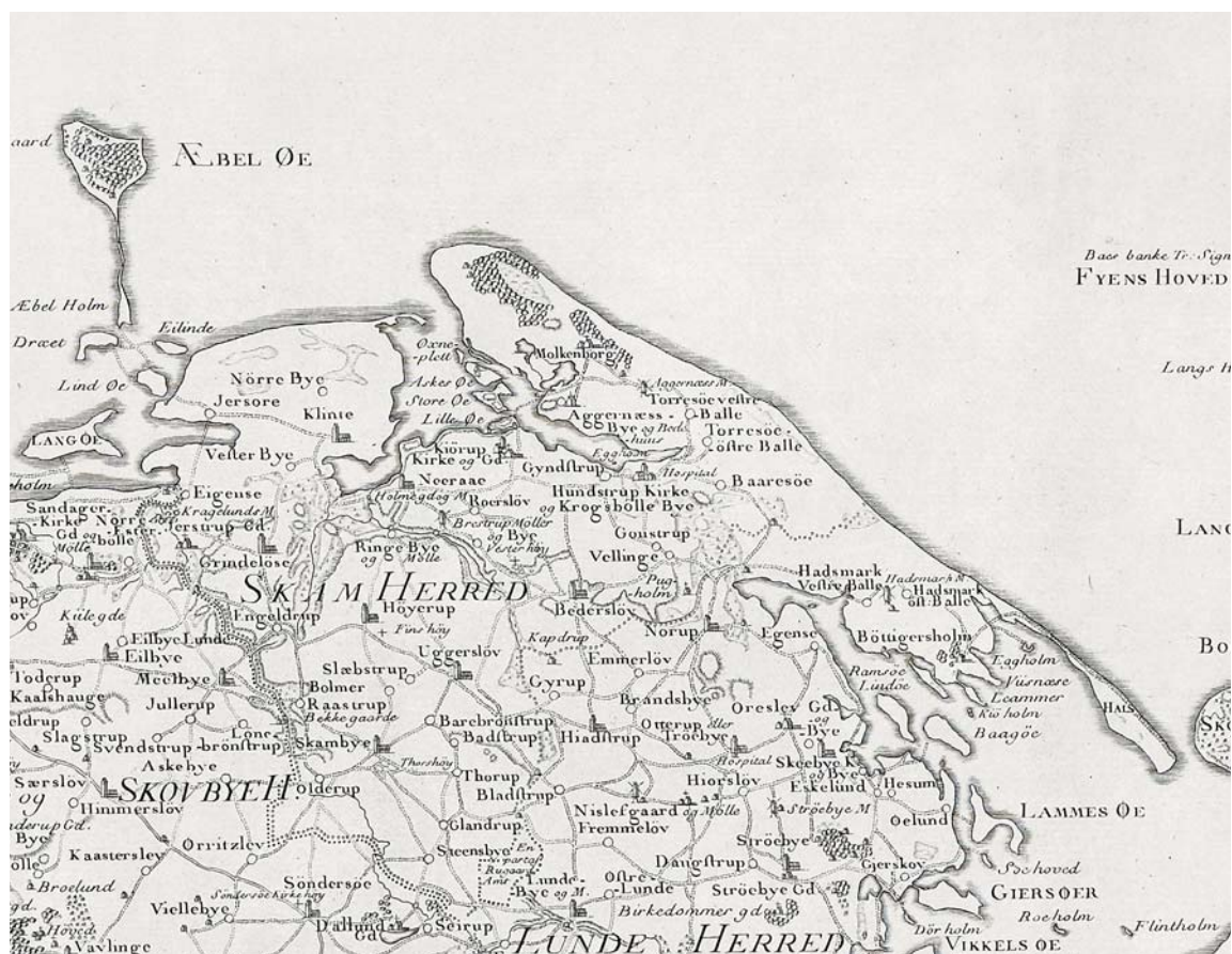
SKAM HERRED i 1783. Dengang talte herredet ni sognekirker: Krogsbølle ('Hundstrup'), Nørre Nærå, Bederslev, Uggerslev, Nørre Højrup, Skamby, Klinte, Grindløse samt †Trefoldighedskirken ved herregården Kørup (nedrevet efter 1781). to middelalderlige sognekirker i †Kørup og †Agernæs blev nedrevet henholdsvis 1555 og 1602; sidstnævnte for at blive erstattet af ovennævnte †Trefoldighedskirke. Udsnit af Videnskabernes Selskabs kort over Nordfyn. 1:180.000. Tegnet af Caspar Wessel 1780 og stukket af Claude Alexandre Guittair (Guitar) 1783. – Map of Skam district 1783.