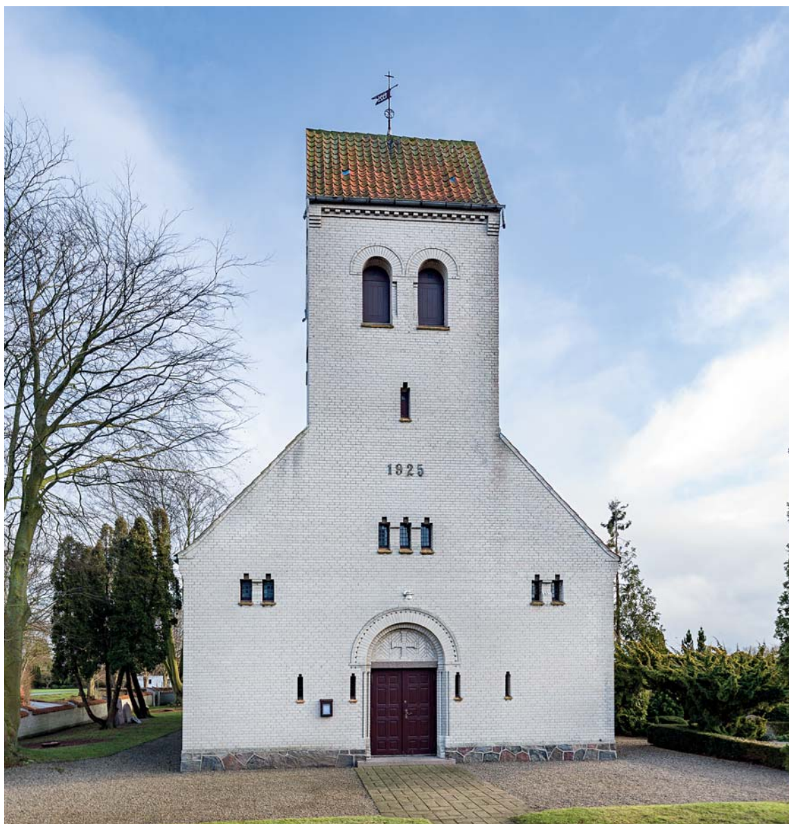
Fig. 3. Kirken set fra vest. – Church seen from the west.

Udvendig står kirken i blank mur, mens væggene og alle detaljer indvendig er hvidtede.