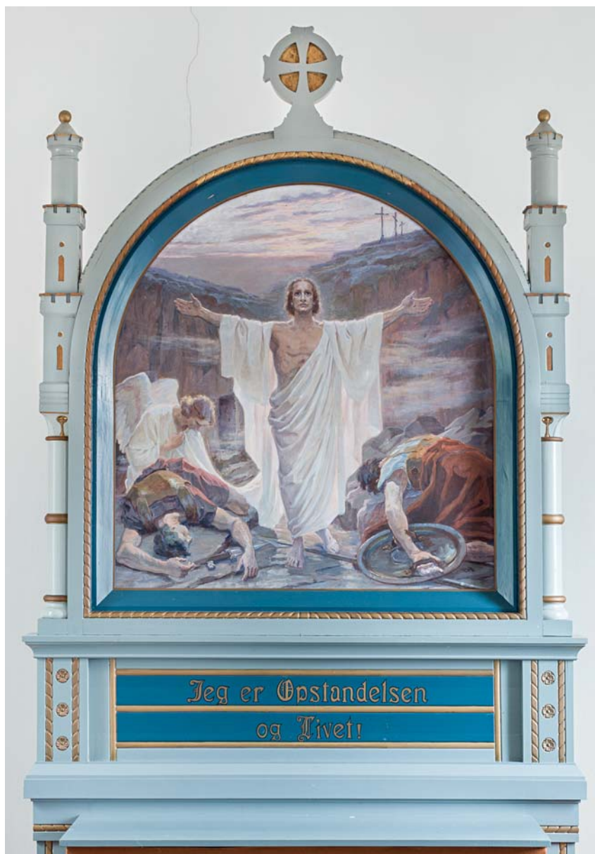
Fig. 5. Altertavlen med Ellen Hofman-Bangs maleri »Påskemorgen«, 1927 (s. 4894). – Altarpiece with Ellen Hofman-Bang's painting "Easter Morning", 1927

er drevet op mod skaffets midtknop; på foden er indgraveret »1994«. Bægret er højt og har rette sider, hvorpå er indgraveret et kors med trepasender. Under foden er stemplet fabriks-, mester- og lødighedsmærke: »C. Antonsen/ Sjødahl. A/ Sterling/ 925S«. Disken måler 16,5 cm i diameter og er prydet af et indgraveret kors med trepasender