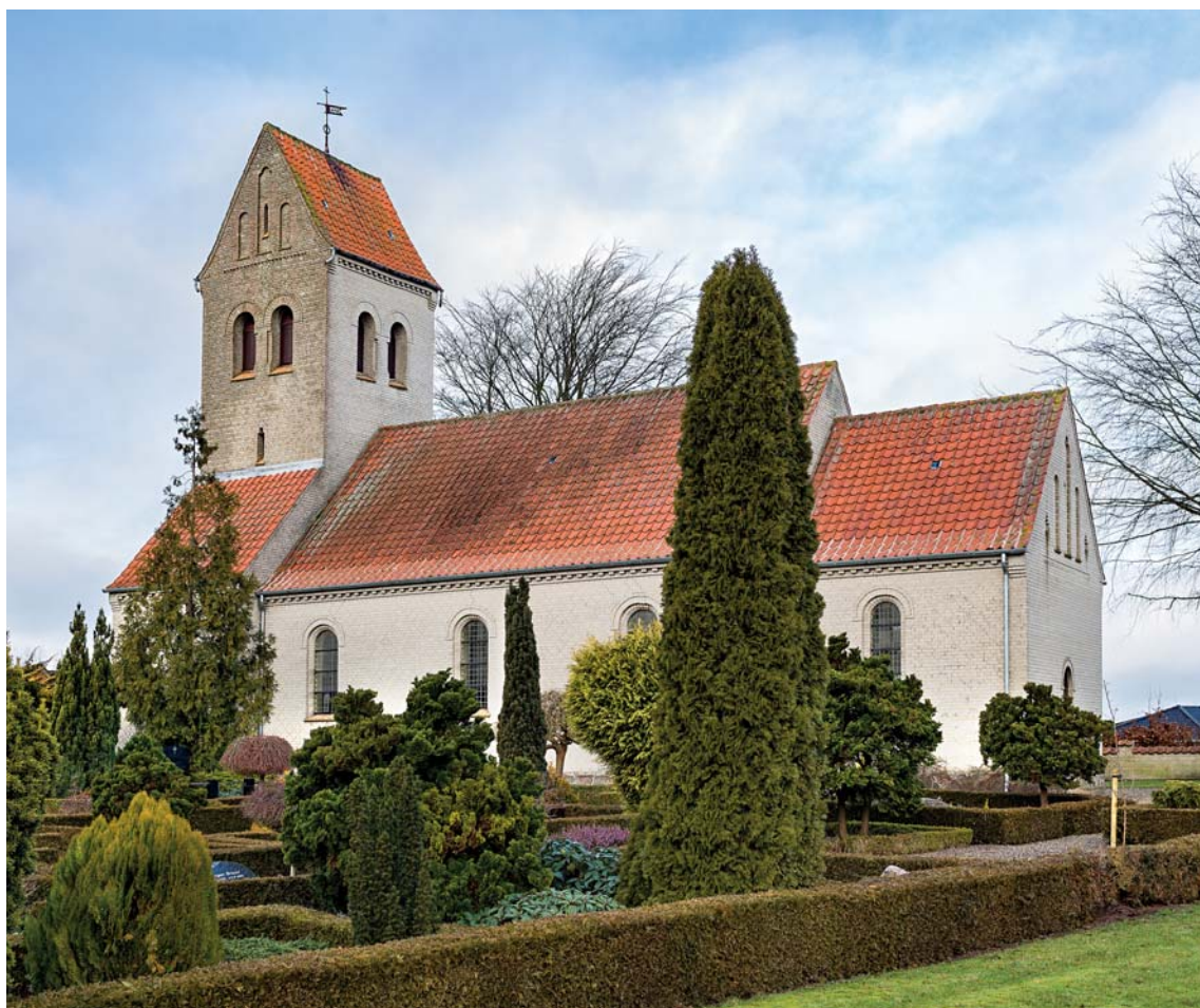
Fig. 1. Kirken set fra syd. Foto Arnold Mikkelsen 2018. – Church seen from the south.