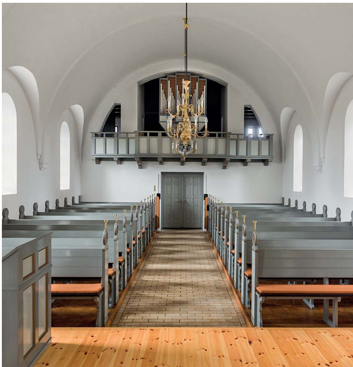
Fig. 11. Kirkens indre set mod vest. – Church interior looking west.

To lysekroner (jf. fig. 11), o. 1925, med 2×6 s-svungne arme på balusterskaft afsluttet af en hængekugle med stor knop. Ophængt i skibet.