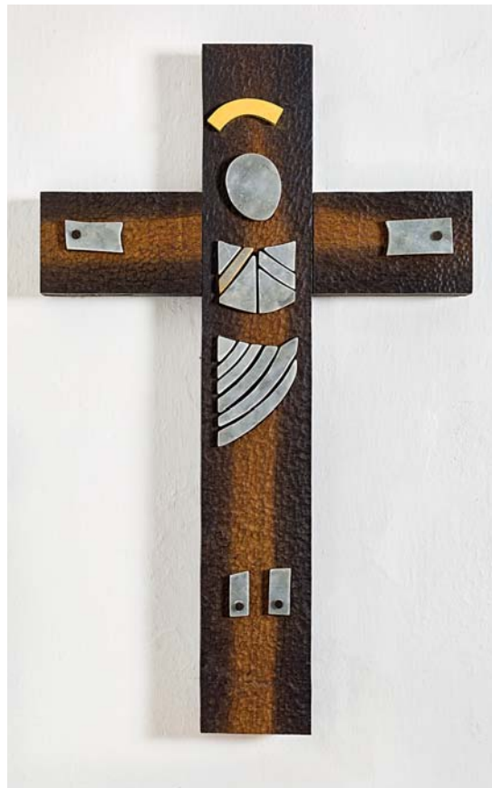
Fig. 9. Krucifiks, udført 2000 af Kristen Østerby, Odense (s. 4897). Foto Arnold Mikkelsen 2018. – Krucifix , made in 2000 by Kristen Østerby, Odense.

klædet og det gloriekronede hoved. Krucifikset blev anskaffet i forbindelse med kirkens 75-årsjubileum og er ophængt på triumfvæggen.