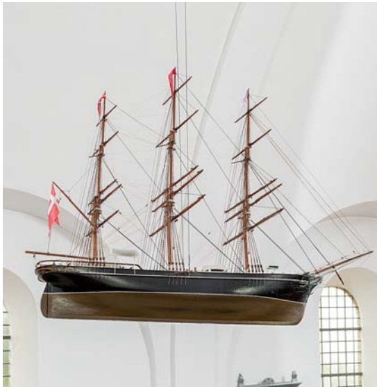
Fig. 10. Kirkeskibet »Margrethe«, bygget 1944 af Gorm Clausen, Marstal (s. 4898). Foto Arnold Mikkelsen 2018. – The church ship "Margrethe", built in 1944 by Gorm Clausen, Marstal.

Stolen står i grå bemaling med hvide fag og detaljer i guld og blå. I sin udformning er den at betragte som en let forenklet variant over de prædikestole, N. P. Jensen tegnede til Strib og Røjleskov i 1911 og 1914.