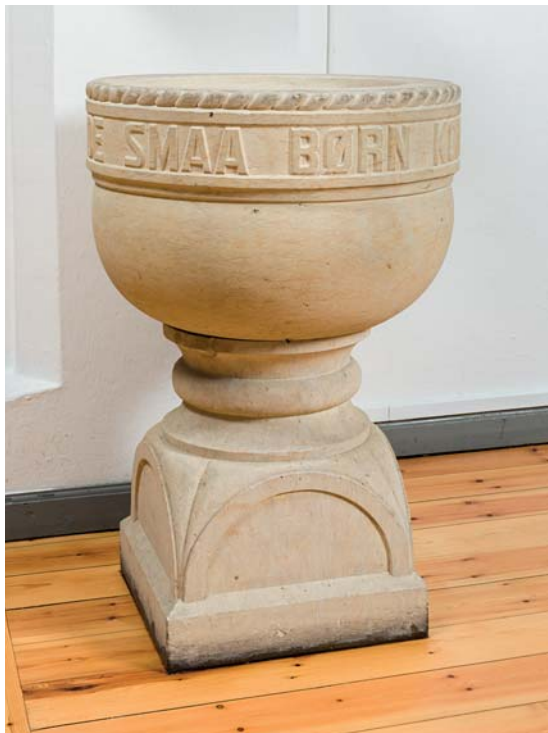
Fig. 8. Døbefont, 1925 (s. 4897). – Font, 1927.