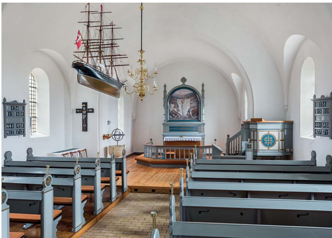
Fig. 4. Kirkens indre set mod øst. – Church interior looking east.