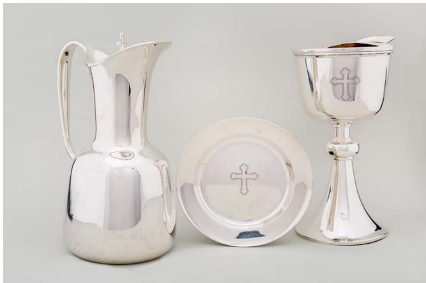
Fig. 7. Kirkens altersølv, udført 1994 af Erik Sjødahl Andersen (s. 4894). – Altar plate, made in 1994 by Erik Sjødahl Andersen .

Altersranken (jf. fig. 4), 1925, har rektangulær plan med affasede hjørner. De fem fag har kraf-