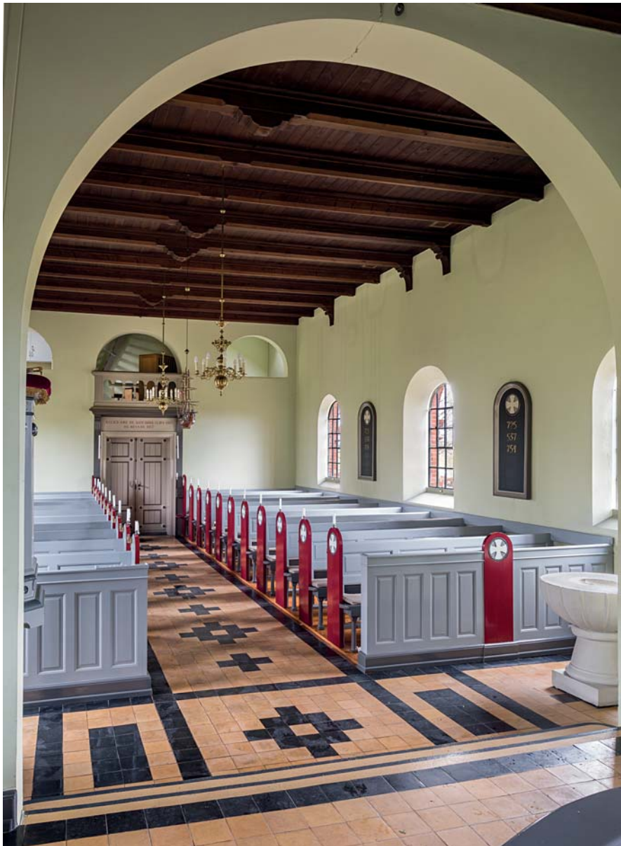
Fig. 13. Kirkens indre set mod vest. Foto Arnold Mikkelsen 2018. – Church interior looking west.

†29. nov. 1929, med hustru Charlotte Louise Hofman-Bang, født Müller. 86,5×56 cm, sort granit med personalia i indhuggede og hvidmalede antikva (navne i versaler). Nord for skibet.