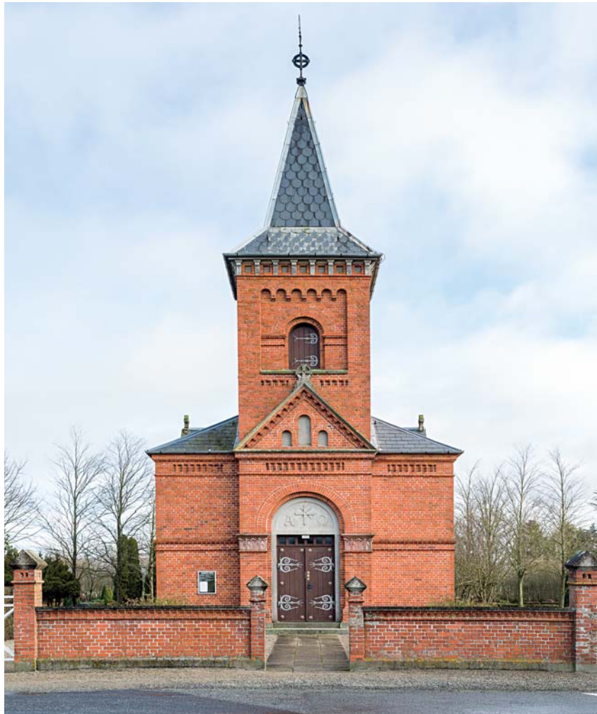
Fig. 2. Kirkens set fra vest. – The church seen from the west.

Murene er rejst i røde, maskinstrøgne teglsten over en betonsokkel, hvorover et i tegl udført