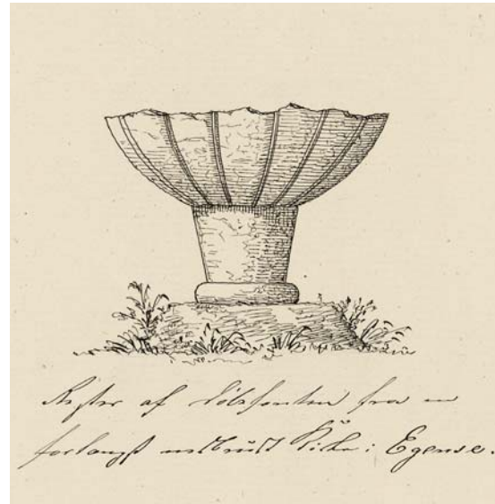
Fig. 14. Den romanske døbefont, der stammer fra Egense †Kirke (s. 4849). Tegnet af J. B. Løffler 1886. – The Romanesque font which comes from Egense †Church.

København 1941, 413, opfattede alene foden som middelalderlig. Den diskuteres imidlertid ikke, men er inkluderet i en af bogens tabeller.