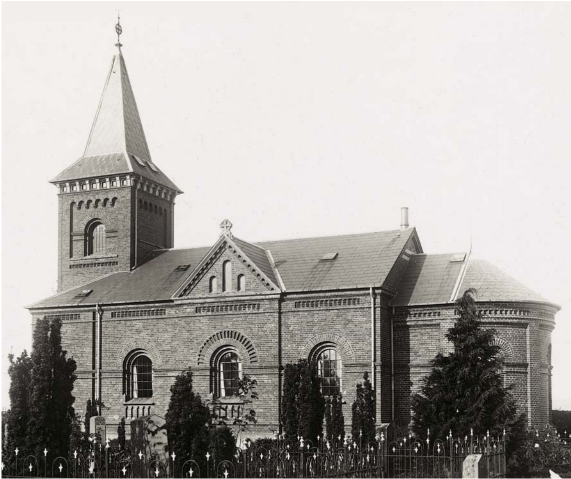
Fig. 3. Kirken set fra syd. Foto i NM, o. 1925. – The church seen from the south

sokkelled er placeret. Facaderne er horisontalt tvedelt ved en fire skifter høj, profileret cordon-gesims, der gennembrødes af dørpartiet i vest og kirkens vinduer, mens korets og apsidens facader ydemere er lodret opdelt af liséner. Øverst afsluttes korets og skibets mure af en ligeledes profileret gesims, der prydes af korte, tre sten høje savskifter.