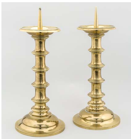
Fig. 9. Alterstager, o. 1892 (s. 4842). – Altar candlesticks, c. 1892.

nyet forud for fontens opstilling i kirken 1892, eftersom den oprindelige var svært forvitret efter at have stået udendørs igennem århundrede (jf. ndf.). 14 Fonten fremstår med en lysegrå bemaling og meget ensartet overflade, der antyder, at den er blevet udspartlet forud for bemalingen.