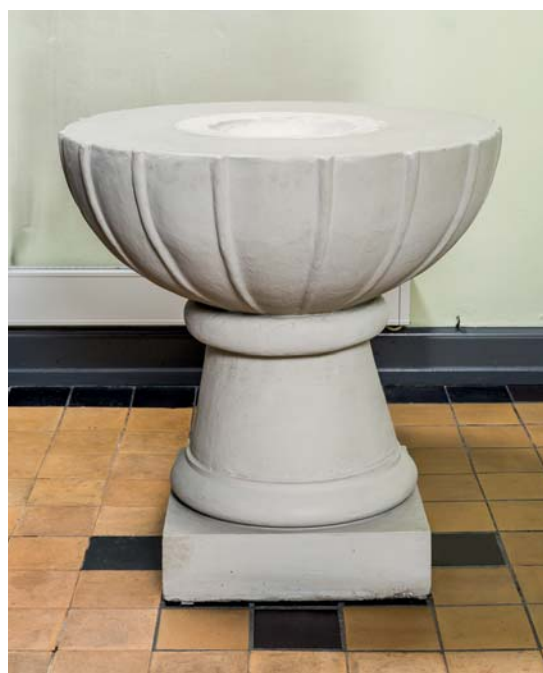
Fig. 10. Den romanske døbefont, der stammer fra Egense †Kirke (s. 4842). – The Romanesque font which comes from Egense †Church.

Stolestaderne er opstillet i to blokke af 11 stole. Gavlene er rundbuede og prydes af en profileret medaljon, og bænkenes ben er ligesom alterskrankens balustrer udformet som glatte søjler med terningkapitel. Frontpanelerne har fire fyldinger og deles i to sektioner af rundbuegavl af samme udformning som bænkenes.