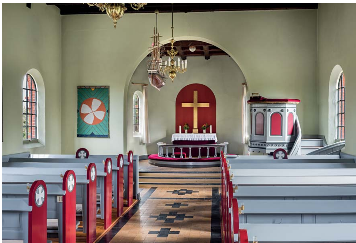
Fig. 6. Kirkens indre set mod øst. Foto Arnold Mikkelsen 2018. – Church interior looking east.

førelsen opvarmes med en \ddagger kakkelovn (jf. fig. 5), denne blev 1930 udskiftet med en ny og større \ddagger ovn, som fungerede helt frem til 1967, hvor et \ddagger oliefyr blev installeret ved kirken. Det nu eksisterende el-anlæg afløste oliefyret. 7