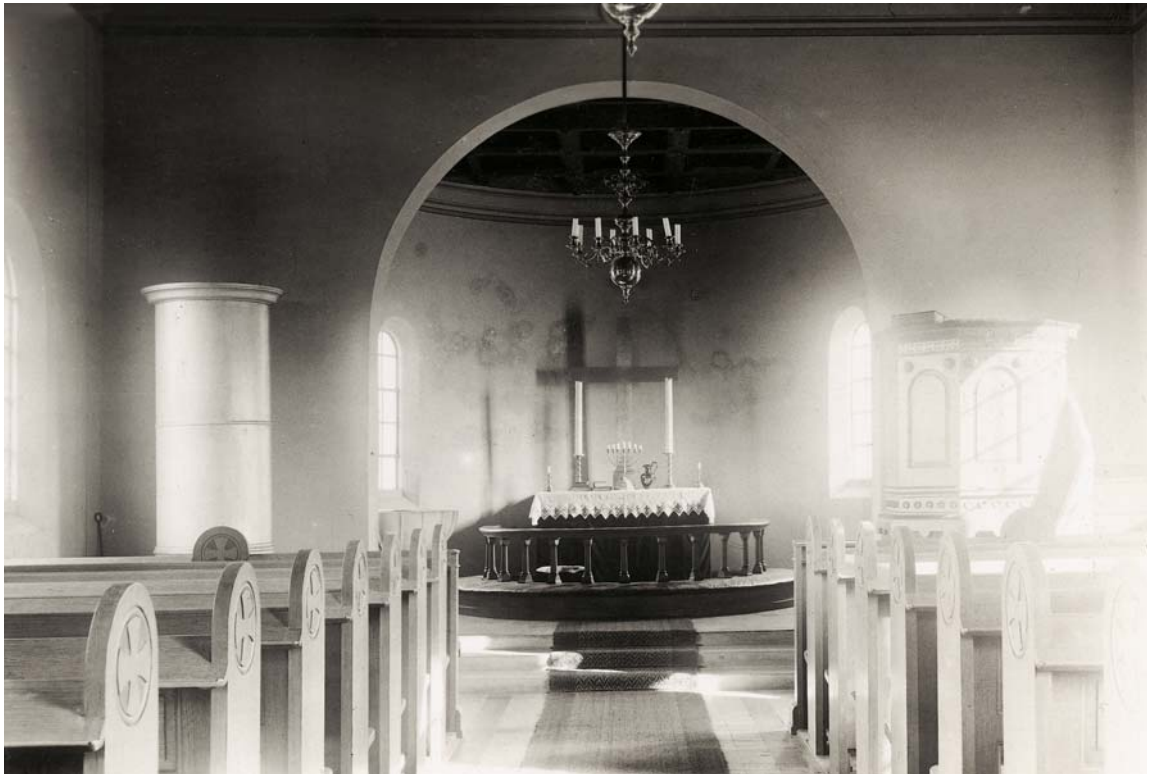
Fig. 5. Kirkens indre set mod øst. Foto i NM, o. 1925. – Church interior looking east.

rene afsluttet af en prydesims med støbte detaljer.