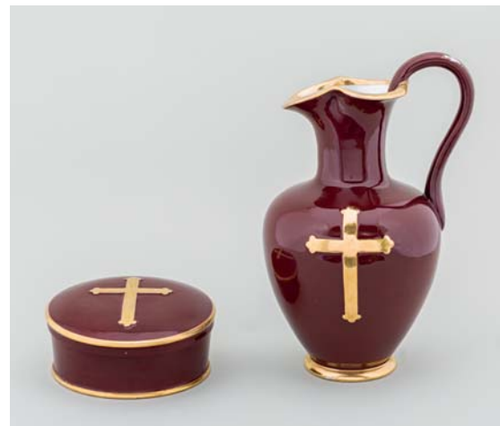
Fig. 8. Oblatæske og alterkande, udført på Den kgl Porcelænsfabrik før 1890 (s. 4842). – Wafer box and altar jug, made at the Royal Porcelain Factory before 1890.

Døbefont (fig. 10), fra 1200-tallet med fornyet kumme, af gotlandsk kalksten. Den 88 cm høje font har en konisk fod, der hviler på en lav, kvadratisk base. En vulst formidler overgangen til den omtrent halvcirkulære fornyede kumme, der måler 85 cm i tværmål og er prydet af 16 lodrette lister (jf. ndf.). Kummens gods er ca. 22 cm, og dens indre mål således blot 41 cm i diameter; dette er endda udstøbt til en beskeden forsænkning, der passer til dåbsfadet. Kummen blev for-