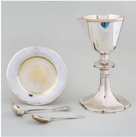
Fig. 7. Altersølv. Kalk disk og ske nr 1 (forrest) udført o. 1892 af sølvsmed R. A. C. Christophersen, Odense. Ske nr. 2, udført 1935 af Johannes Siggaard, København (s. 4842). – Altar plate. Chalice, paten and spoon no. 1 (front) made c. 1892 by the silversmith R. A. C. Christophersen, Odense. Spoon no. 2, made in 1935 by Johannes Siggaard, Copenhagen.

Altersæt , o. 1892, udført af R. A. C. Christophersen, Odense. Kalken er 25,5 cm høj, har sekskantet fod, der er drevet stejlt op i et sekskantet skaft med fladt midtled. Det slanke bæger er konisk med fladrund bund og indbygget hældetud; på siden er indgraveret et kors med trepasender. Stemplet under bunden med mester-, by- (to gange) og lødighedsmærke (826); 11 sikkerhedsmærket (»HK«). Den tilhørende disk måler 17 cm i tværmål, på fanen er indgraveret et kvadratkors med trepasender. Stemplet med mester- og bymærker.