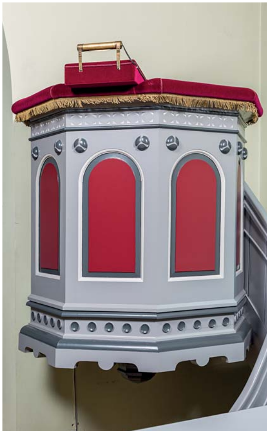
Fig. 11. Prædikestol, 1892 (s. 4843). Foto Arnold Mikkelsen 2018. – Pulpit , 1892.

Et 'billedtæppe' (jf. fig. 6) ( tekstiler ) vævet af Jette Nevers, Otterup, er opsat i kirken 1992 i anledning af dens 100-årsjubileum. Tæppet, 143×88,5 cm, er vævet i et x-mønster med et rødt og hvidt hjulkors i skæringen og kantes foroven og -neden