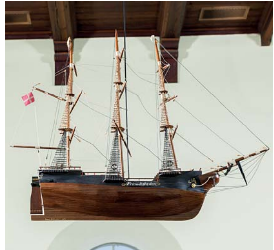
Fig. 12. Kirkeskibet »Frimodigheden«, o. 1892 (s. 4844). – The church ship "Frimodigheden", c. 1892.

af en blå bort; den øvre har indvævede hvide og gule felter. Opsat på triumfvæggens nordre del.