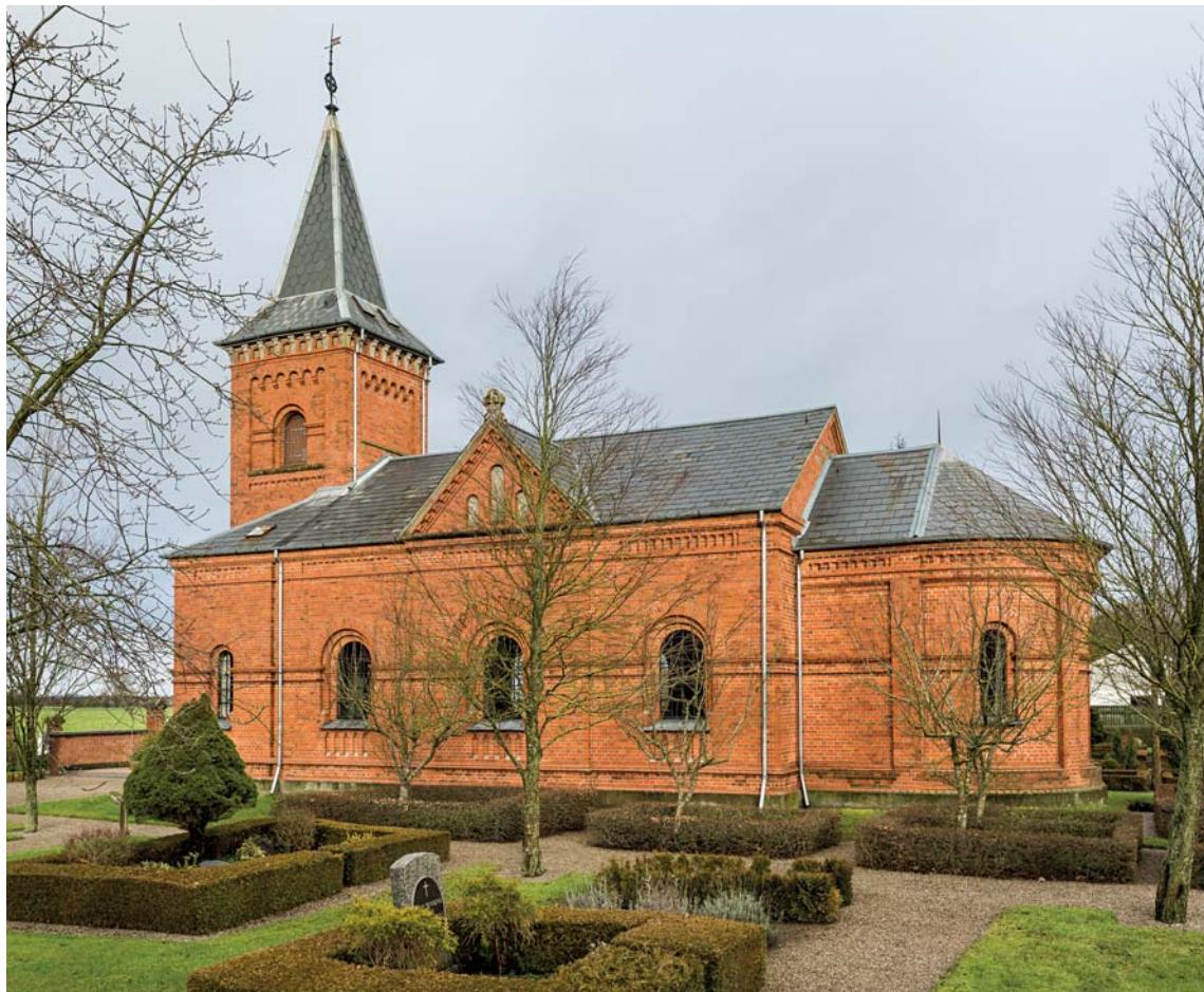
Fig. 1. Kirken set fra syd. Foto Arnold Mikkelsen 2018. – The church seen from the south.